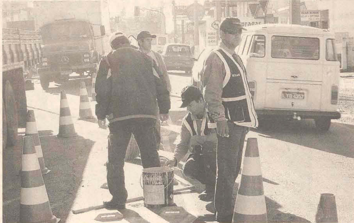
Funcionários da diretoria de trânsito concluíam a ilha de segurança na manhã de quarta-feira (18)