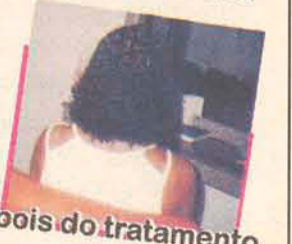
Depois do tratamento

RUA ARNOLDO KOCH Nº 106 - COLONINHA - GASPAR - Fundos do Supermercado Zoni - Rua do Gasparensense