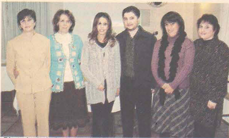
Diretoria da Ação Social Cidadã de Gaspar