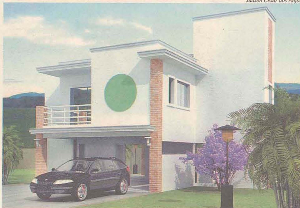
Maquete digital do exterior de uma casa