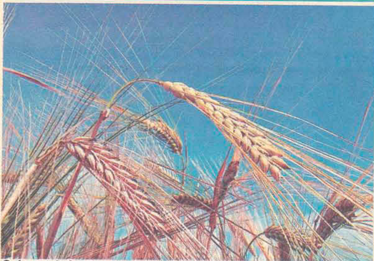
Safra em baixa traz pejuízos a agricultores

A produção nacional de trigo em 2006 foi de 2.464.936 toneladas, 47,1% inferior à de 2005 e a menor dos últimos cinco anos. Com os produtores descapitalizados, em razão das dificuldades enfrentadas nas duas últimas safras, como a estiagem e os baixos preços obtidos na comercialização, ocorreu uma queda de 25,1% na área plantada.