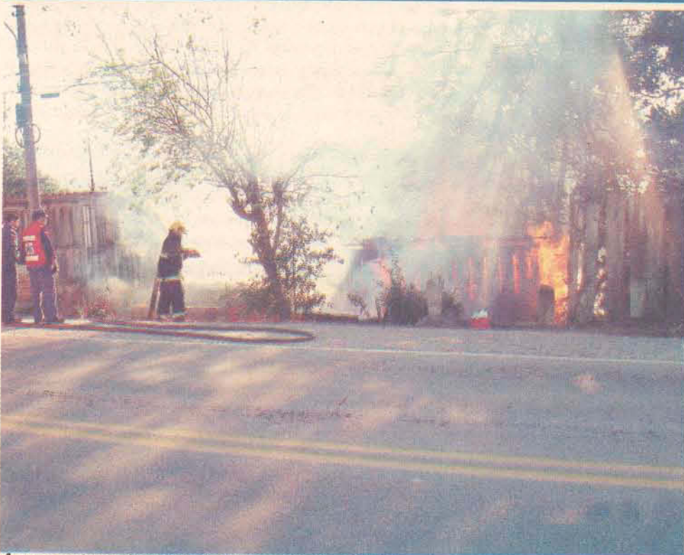
A casa estava abandonada e ninguém ficou ferido

Na manhã de sexta-feira (20), segundo informaram moradores do bairro Figueira, um andarilho ateou fogo em uma casa na Rua Anfilóquio Nunes Pires, próximo a Malhas Soft.