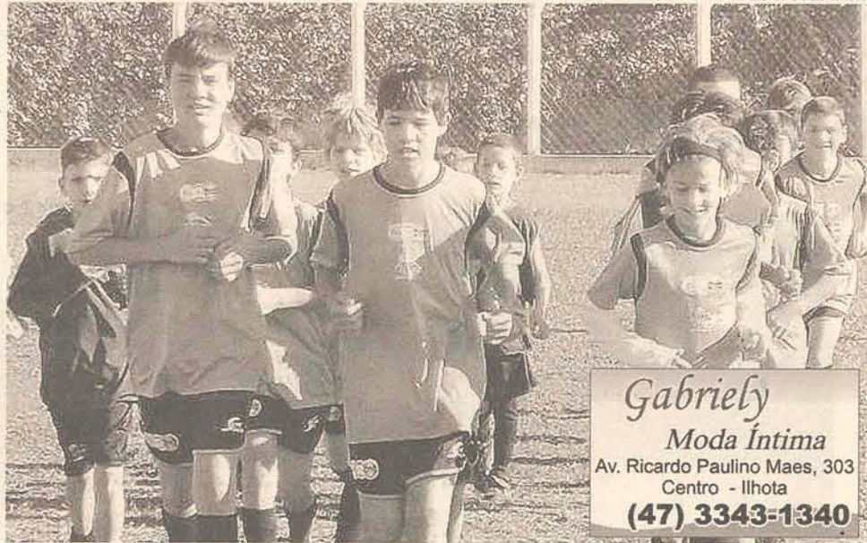
Meninos de Ilhota agora carregam as cores do tricolor gaúcho

Mas imediatamente a Fundação se preocupou em esclarecer que esses valores são destinados aos que têm possibilidade de efetuar o pagamento, quem não pode e tem filhos que desejam fazer parte do núcleo de futebol do Grêmio, basta comparecer com a documentação correta, constando