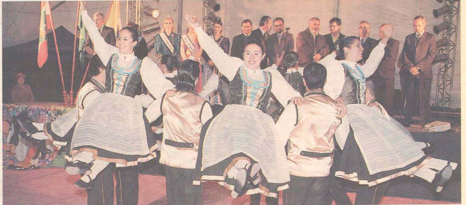
A coreografia Desalpe será apresentada pelo grupo gasparense na segunda-feira (23)