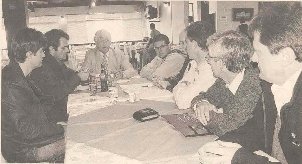
A solução encontrada pelos contadores foi encaminhar o pedido ao Executivo