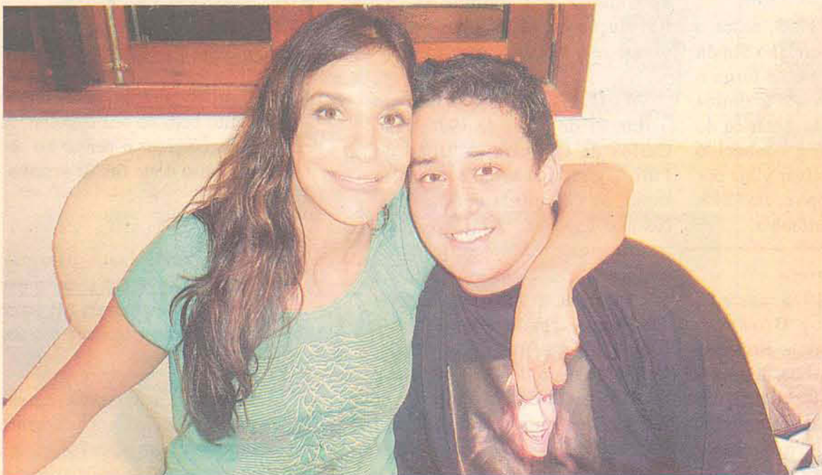
Marcos é fã da cantora e já se encontrou com ela duas vezes

Serviço: Show da cantora Ivete Sangalo, no setor 2 do Parque Vila Germânica, Rua Alberto Stein, 199, Bairro Velha, Blumenau.