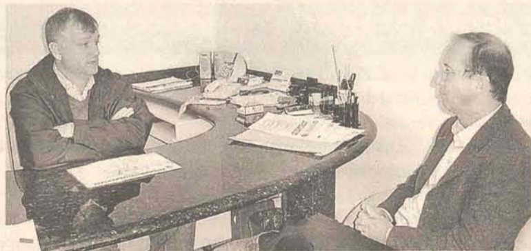
Prefeito conversou com delegado de Gaspar sobre ações em Ilhota

"Iremos fazer um trabalho em conjunto com o Executivo de Ilhota, pois há pontos que podemos prevenir para evitar o crescimento do tráfico no