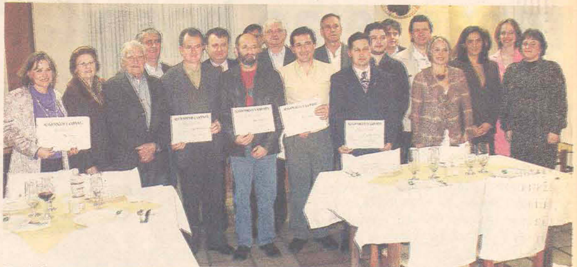
Oscip homenageou pessoas que direta ou indiretamente ajudam a entidade

A Ação Cidadã atua há dois anos na cidade, ajudando os menos favorecidos