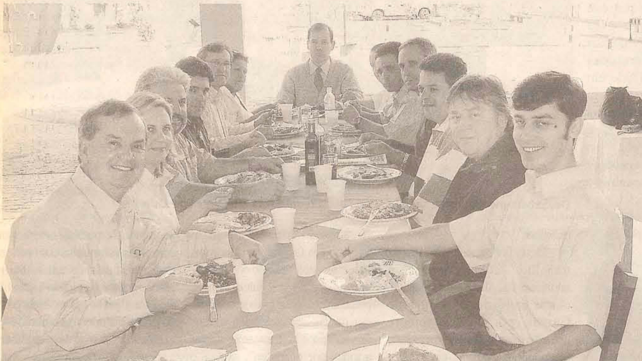
Aproximar a executiva dos filiados foi uma das pautas do almoço