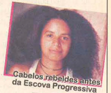
Cabelos rebeldes antes da Escova Progressiva