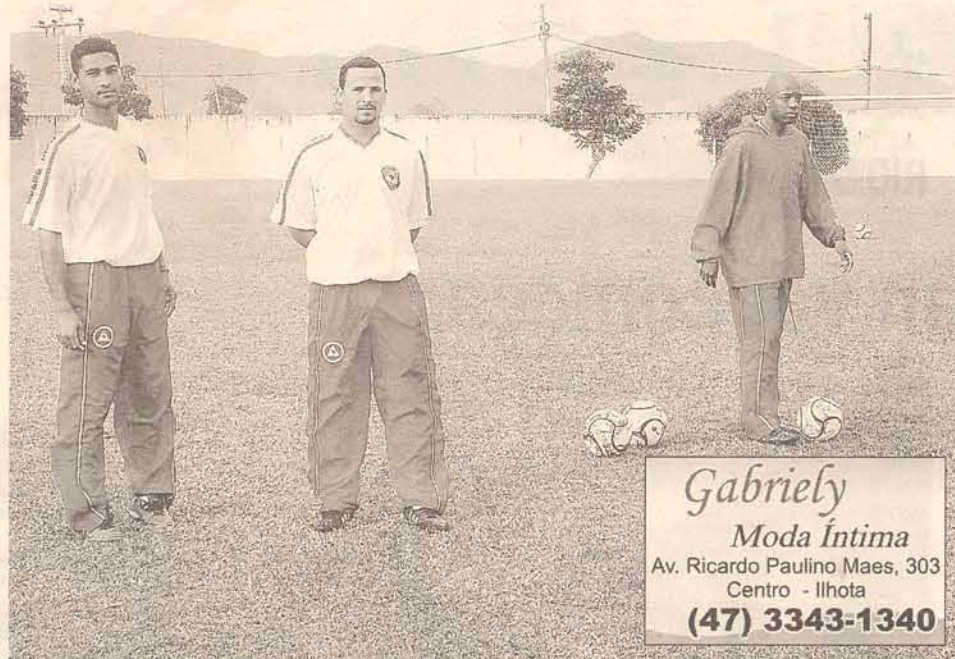
A comissão técnica aproveitou a folga para treinar mais e espiar adversários

“O fator físico imperou durante a partida,