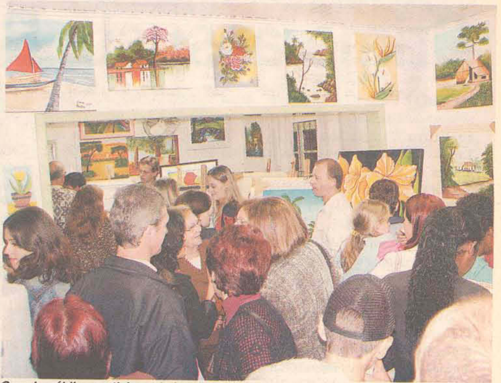
Grande público participou da inauguração da Casa

Segundo ela, as oficinas já existiam há cinco anos, mas divididas em diferentes locais. Agora, a casa atenderá