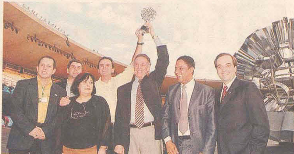
Autoridades no lançamento da Pira Pan-americana, no Maracanã

O jacaré, um dos animais que compõem a fauna típica brasileira, também estará na cerimônia de abertura