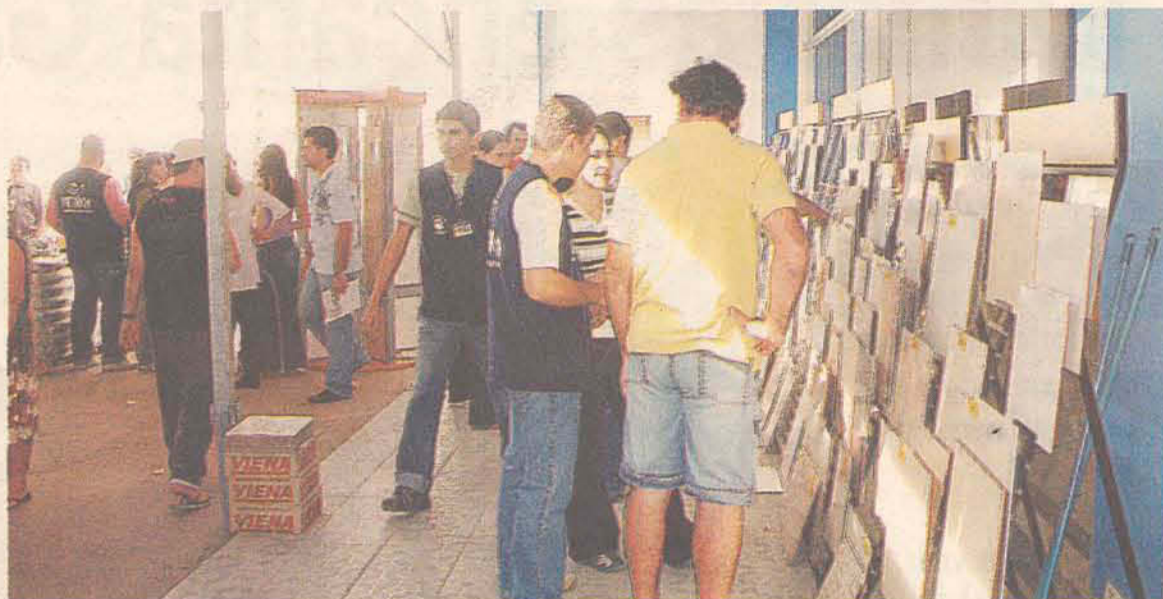
Pisos foram vendidos a partir de R$ 5,00 no sábado

O horário de atendimento durante a semana é o horário comercial e no sábado até 12h.