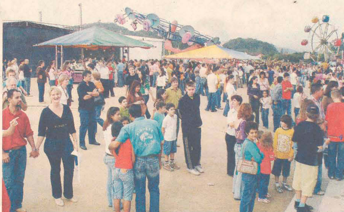
Milhares de pessoas devem visitar a Feira durante os quatro dias de realização