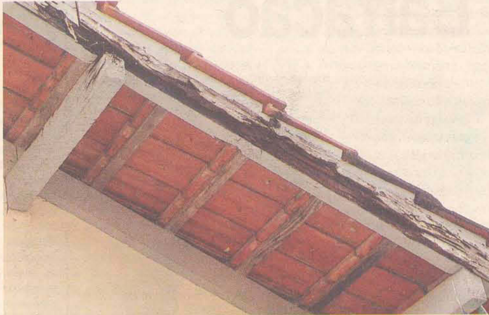
Forro e base do telhado estão comprometidos por causa dos cupins

é a falta de biblioteca, que por estar condenada, foi demolida e hoje só sobrou o nome.