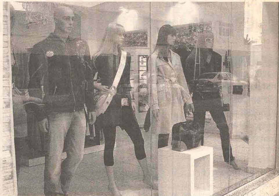
Vitrines convidam o consumidor a conhecer a coleção de inverno