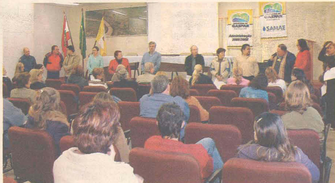
Em cerimônia na prefeitura de Gaspar, conselheiros foram empossados

“Já temos alguns assuntos em mente que iremos discutir, como: a fiscalização dos bailes da terceira idade, para verificar se não há pessoas mais jovens frequentando e se aproximando de pessoas mais