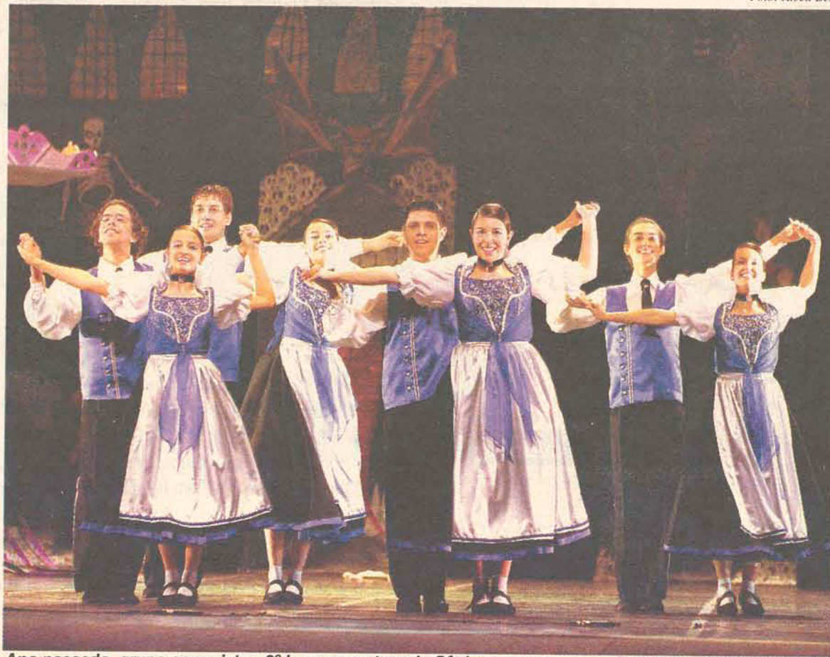
Ano passado, grupo conquistou 2º lugar na categoria Sênior com a coreografia "Parco dei Divertiment"