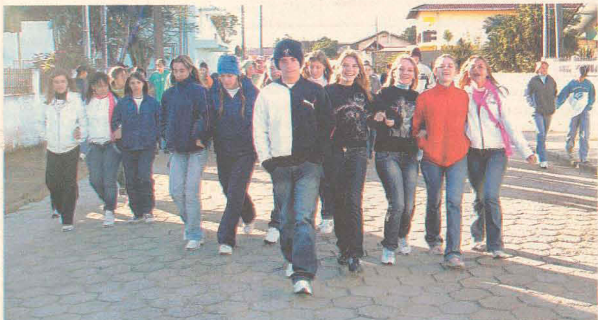
Alunos do Ensino Médio do Frei Godofredo caminharam pelas ruas do bairro Sete de Setembro

O confronto é feito entre duas cidades de mesmo porte, no qual vence a que conseguir mobilizar o maior número de pessoas por pelo menos 15 minutos de atividade física. As cidades ganhadoras do Desafio recebem um troféu de honra ao mérito e também ganham qualidade de vida através do incentivo à prática de exercícios físicos.