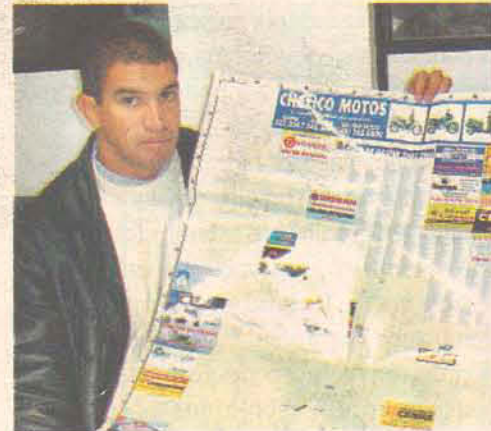
Em Gaspar são feitos 2 mil exemplares