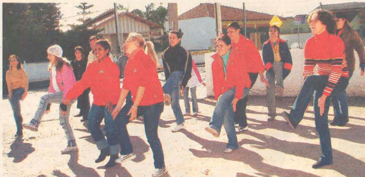
Funcionários do Supermercado Zoni cumpriram o desafio com muita ginástica

Somente a Escola Frei Godofredo mobilizou cerca de 1300 pessoas. "Os alunos do pré-escolar até o oitavo ano fizeram alongamento e dança,