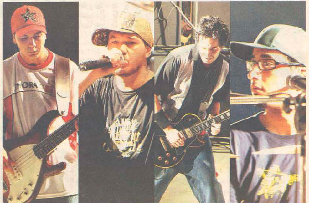
CBJR será a banda que se apresentará no palco Nacional da festa neste sábado

década de 80 como uma mostra de campo, denominada Festa do Interior, que constituía num aglomerado de boxes típicos de costaneiras. Nos boxes eram servidos e vendidos pratos típicos, salgados, quentes, frios, doces caseiros, bebidas, paçoca de pinhão, etc. As atrações ficavam por conta de apresentações nativistas, bailes, domingueiras e outras como torneio de laço, concursos, trovas e missa campeira (crioula).