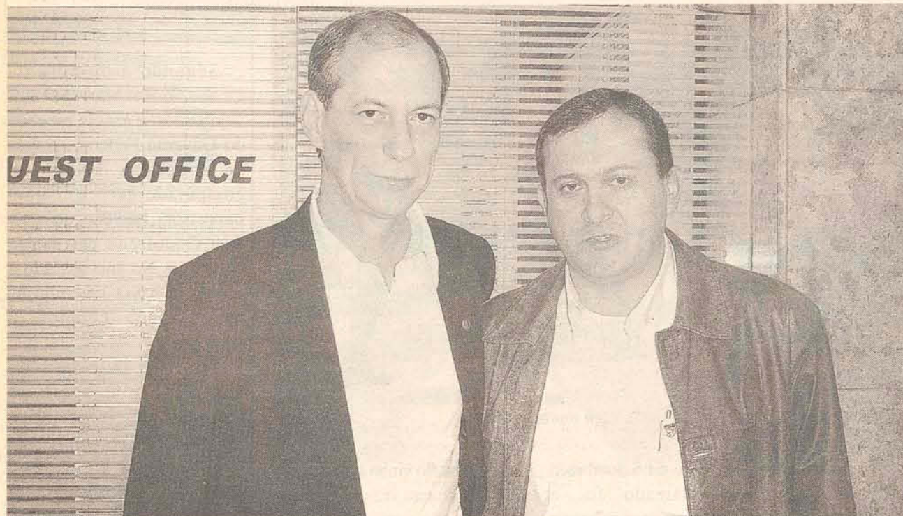
Ciro e Adilson Schmitt antes do café da manhã no Hotel Plaza, em Blumenau

O DEPUTADO FEDERAL Ciro Gomes (PSB), junto a lideranças do Partido Socialista Brasileiro visitaram a cidade de Gaspar na sexta-feira (1º) e oficializaram a filiação do Prefeito Adilson Schmitt, em cerimônia no Restaurante Bunge Natureza.