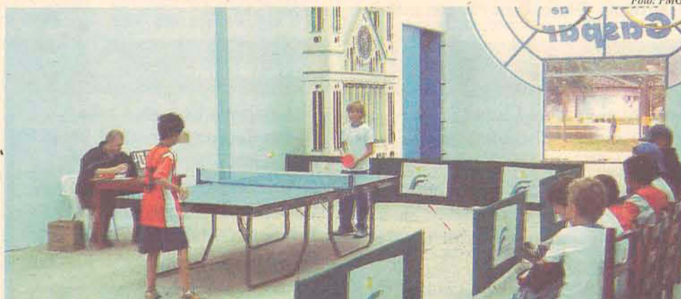
A Churrascaria Toni apoiou a seletiva, custeando a arbitragem da competição

A fase Regional dos JESC acontece de 4 a 7 de junho, em Pomerode. Na próxima segunda-feira, 14/05, a Fundação Municipal de Esportes estará promovendo com os professores de Educação Física uma reunião sobre a participação das equipes no campeonato, que será na sede da FME a partir das 11 horas. As disputas aconteceram na última terça-feira, 08/05, no Ginásio Municipal Prefeito João dos Santos. Confira as equipes classificadas para representar o município.