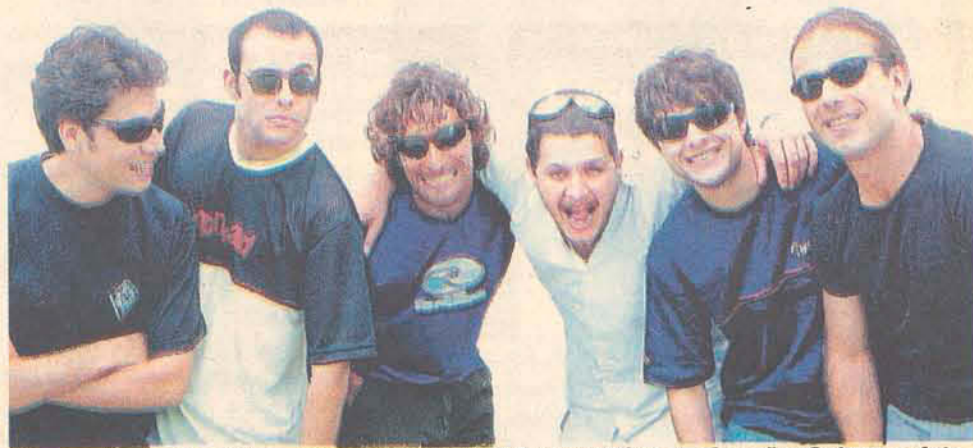
Dazaranha será a última atração do Festival Universitário da Canção, Cultura e Arte