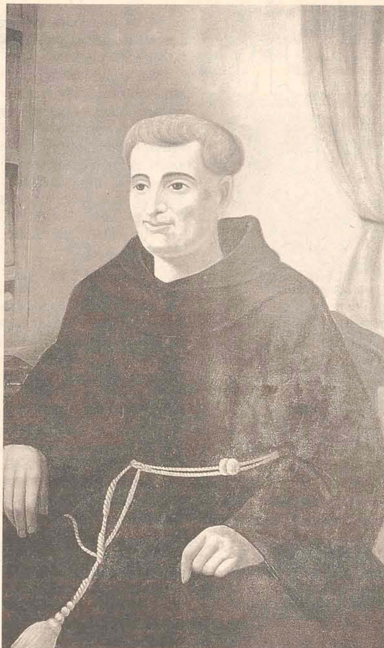
Frei Galvão foi canonizado na sexta-feira (11)

A Igreja considera que foi um milagre o fato de Sandra ter conseguido dar à luz seu filho Enzo, em 1999, depois de ter ingerido as chamadas pílulas de Frei Galvão.