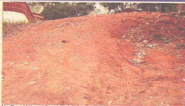
Na Rua Nelson Casas o buracos dificultam o acesso

Já na Rua Fernando Krauss, o problema é grave nos dias de chuva. Como não há tubulação o esgoto escorre a céu aberto, causando mau cheiro e alagamentos para os moradores da rua.