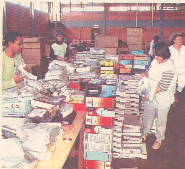
Os produtos ainda estão sendo separados e organizados para o bazar

valores, colocaremos preços compatíveis com o mercado que sejam vantajosos para o comprador, mas que não