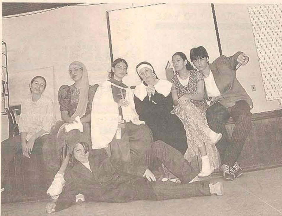
O grupo encenou "Nem tudo é como parece", peça adaptada de Shakespeare