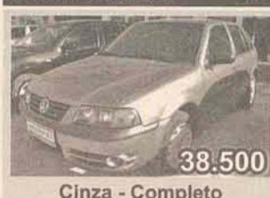
38.500 Cinza - Completo