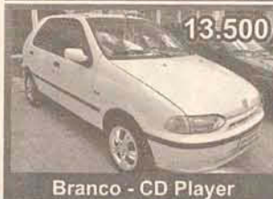
13.500 Branco - CD Player