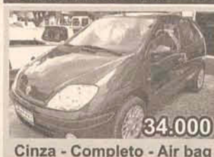
34.000 Cinza - Completo - Air bag