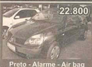
22.800 Preto - Alarme - Air bag