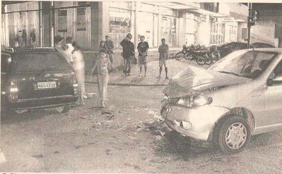
O Siena avançou o sinal da rua Duque de Caxias atingindo a Parati

Dois carros colidiram na noite de segunda-feira (30), quando um Siena prata, placas MEZ 6729 avançou a sinaleira na rua Duque de Caxias para entrar na rua São Pedro, no bairro Centro.