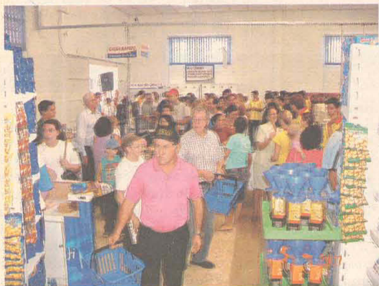
Clientes aproveitaram as ofertas de inauguração da nova filial