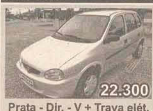
22.300 Prata - Dir. - V + Trava elét.