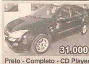
31.000 Preto - Completo - CD Player