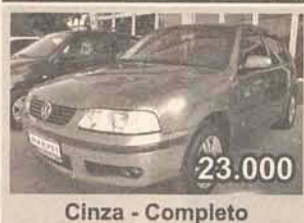
23.000 Cinza - Completo