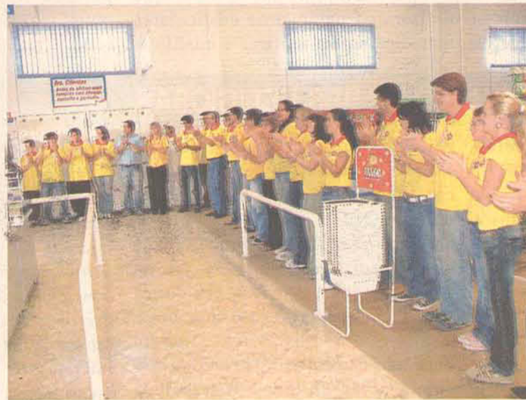
O novo empreendimento gerou emprego para 40 pessoas