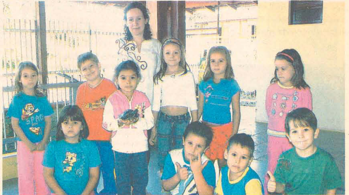
Alunos do pré matutino 2 conheceram de perto uma tartaruga