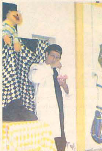
Apresentação da Cia da Alegria