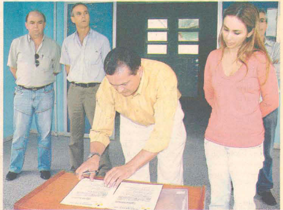
Contrato de aluguel para que o PA funcione no Hospital foi assinado na quinta-feira (3)

O Pronto Atendimento Municipal agora é de total responsabilidade do município. Apenas será mantido onde já vinha funcionando antes da liminar, mas