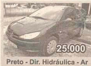
25.000 Preto - Dir. Hidráulica - Ar