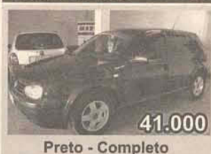
41.000 Preto - Completo