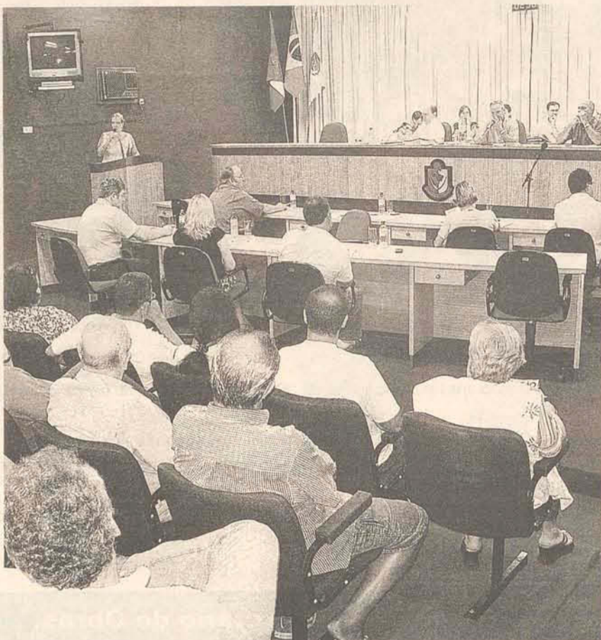
Câmara aprovou o projeto na quarta-feira (18)

A emenda garante que após três anos instalada em Gaspar a empresa se compromete a ficar pelo menos mais três, pagando impostos. Outra emenda de autoria da vereadora, de que a empresa pagasse pelo menos 2% do Imposto sobre serviços de qualquer natureza (ISSQN) não foi aceita pelos vereadores.