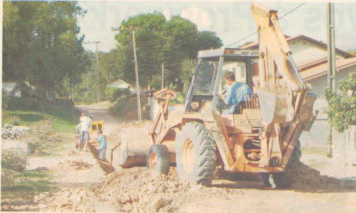
No Gasparinho há máquinas trabalhando, mas o cronograma da "Força-Tarefa" não está sendo cumprido