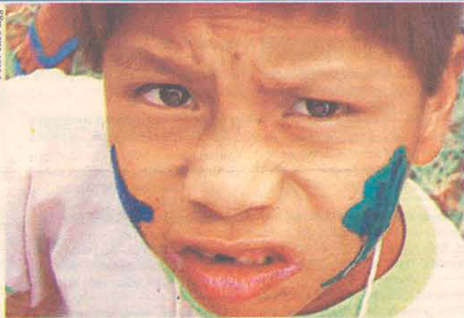
Com o novo terreno, índios esperam uma vida mais digna

Na quinta-feira (19), dia em que é comemorado o "Dia do Índio", pelo menos 28 guaranis que vivem em terras catarinenses têm motivo para comemorar. O grupo foi transferido na quarta-feira (18), de um terreno com quatro hectares próximo ao morro do Cambirela, às margens BR-101, em Palhoça, para uma terra