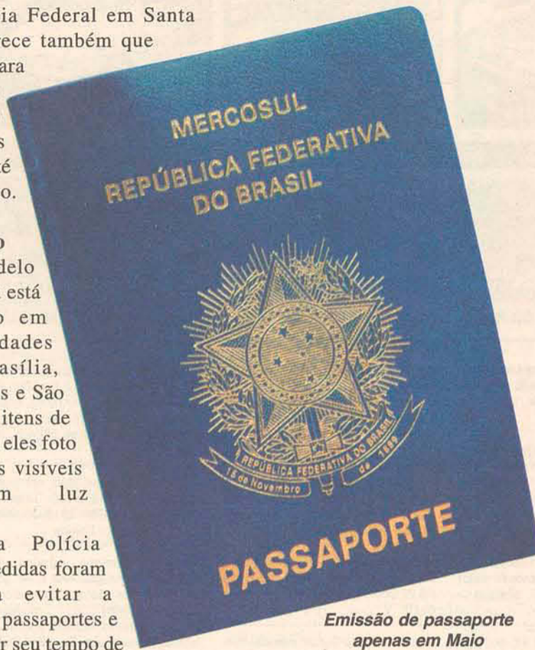
Emissão de passaporte apenas em Maio

Enquanto o modelo antigo leva 15 dias para ficar pronto, o novo deve ficar