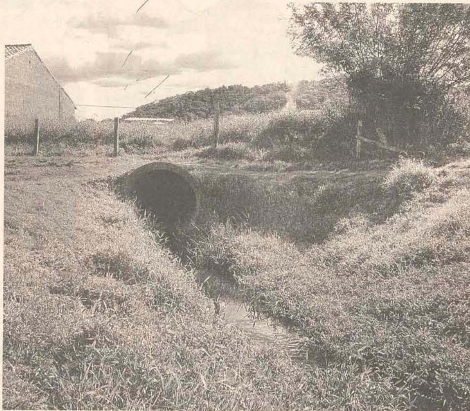
O esgoto sem tratamento acaba desaguando no rio Itajaí-Açu

Na ocasião participaram membros do Ministério Público, Ministérios das