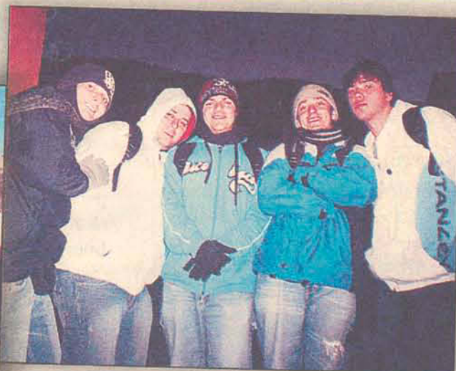
Em Park City, enfrentando o frio de menos 10 graus