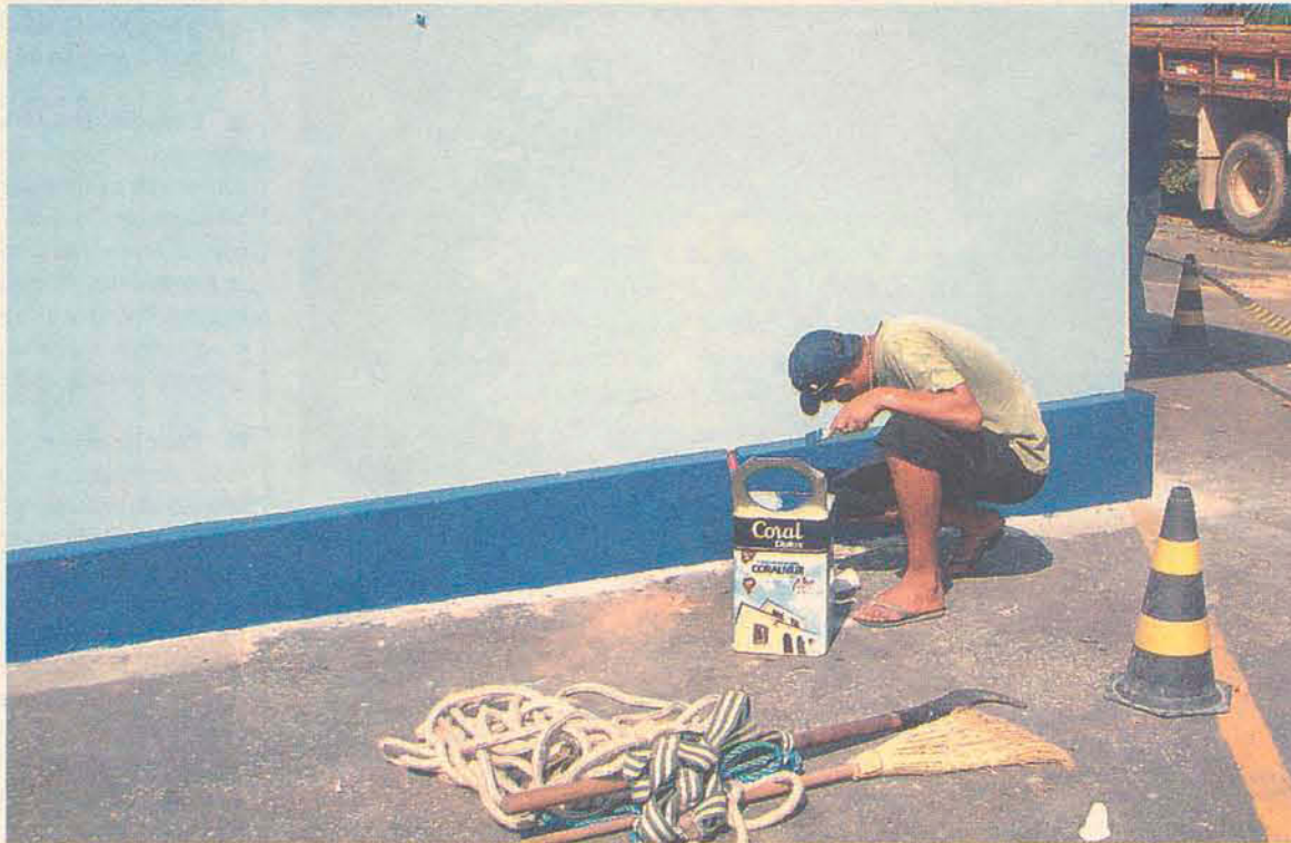
Pintura da parte externa do prédio do hospital já está sendo realizada para melhorar a aparência

Segundo o Conselho do Hospital, por sua história, a instituição dispõe de todas as condições de permanecer aberto e ser referência em saúde no Vale do Itajaí, porém algumas mudanças, não tão simples e fáceis, precisam ser realizadas. “Uma reforma administrativa e física precisa ser feita para que o Hospital de Gaspar possa oferecer