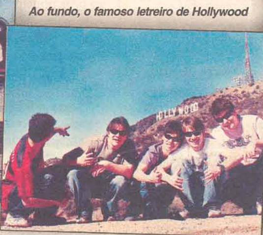
Ao fundo, o famoso letreiro de Hollywood