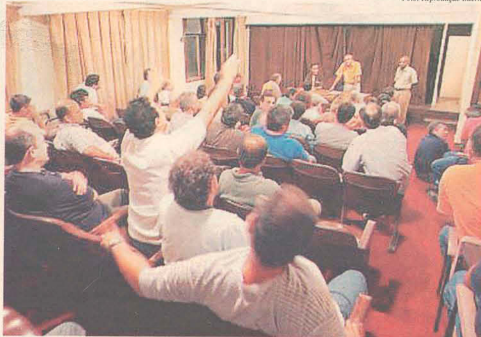
Impasse entre governo, militares e controladores de vôo pode causar nova paralisação

Pelo plano em andamento, o passo seguinte é outra ação para forçar o governo a retomar as negociações: desencadear um processo de pedidos de baixa coletivos dos controladores