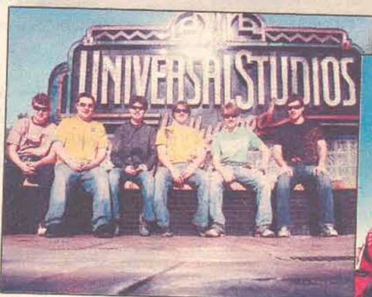
Jovens visitam Los Angeles

Como não há ondas e a neve dificulta o impulso com os pés, o único jeito de fazer o esporte é descendo montanhas. Outras modalidades incluem Half-Pipes compridas e inclinadas e rampas artificiais para a realização de grandes saltos onde pode-se fazer várias manobras antes de chegar ao chão.