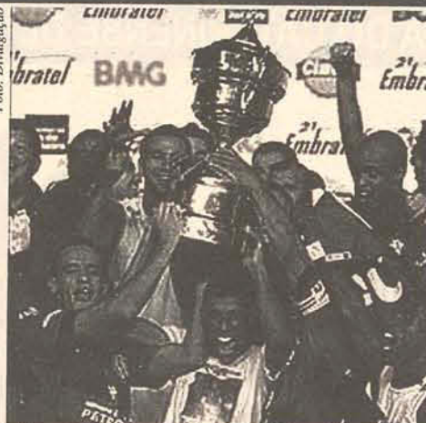
Flamengo levanta sua 17ª Taça Guanabara