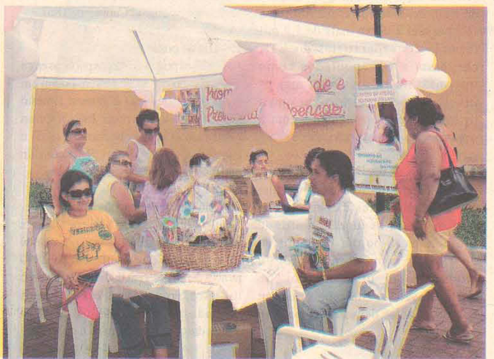
Agentes da saúde distribuíram brindes e informaram as mulheres na praça