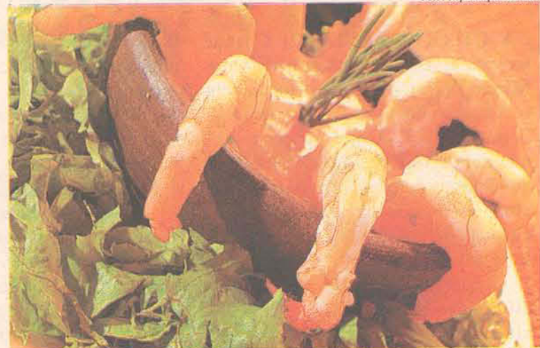
Com o baixo preço, camarão tornou-se acessível a mesa dos catarinenses

A professora Jodete Fullgraf, outra compradora, avalia que os valores praticados deveriam ser sempre estes. "Acho que tem que ser assim mesmo, acessível às pessoas", afirma.