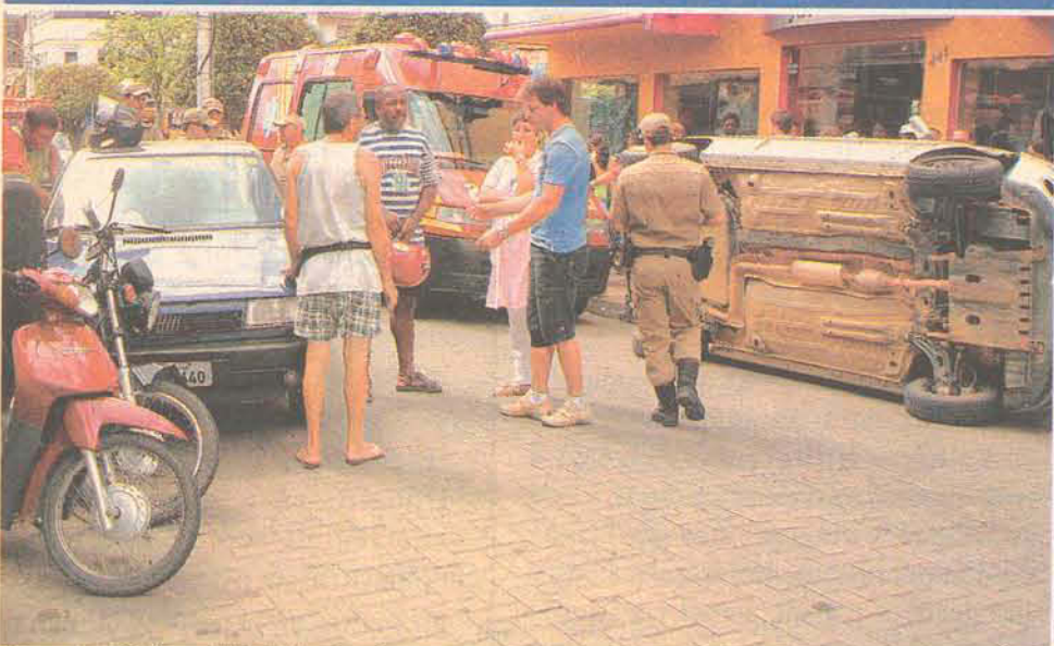
Com a colisão o Fiat Palio tombou e causou tumulto no centro de Gaspar

Os comerciantes da Rua Cel. Aristilianos Ramos levaram um susto na manhã da última quinta-feira (8). Uma colisão entre um Fiat Uno de Gaspar e um Fiat Palio de Indaial, resultou no capotamento do último, chamando atenção de quem passava por ali. O palio acertou a lateral do uno e acabou capotando em frente a loja Júlio Schramm, e por pouco não atingiu um poste que havia próximo ao local.