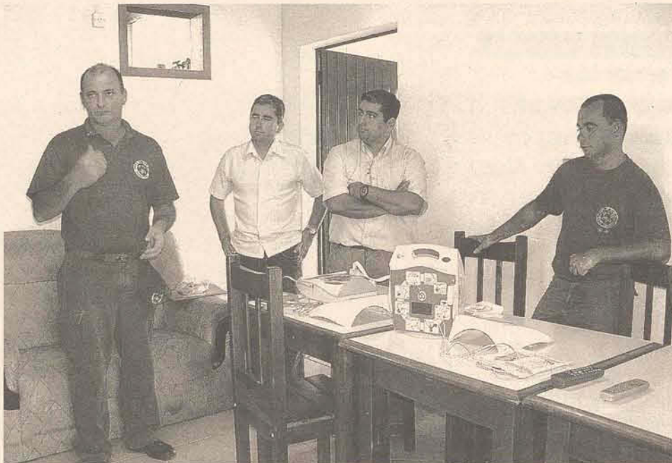
Em entrega técnica, bombeiros explicaram como o desfibrilador deve ser usado

O desfibrilador é normalmente utilizado para restabelecer o ritmo cardíaco decorrente em uma parada cardiorrespiratória e circulatória. Com o desfibrilador é possível reanimar uma vítima de parada cardiorrespiratória ainda no local da emergência e ganhar tempo ao conduzi-la para um hospital, aumentando significativamente as