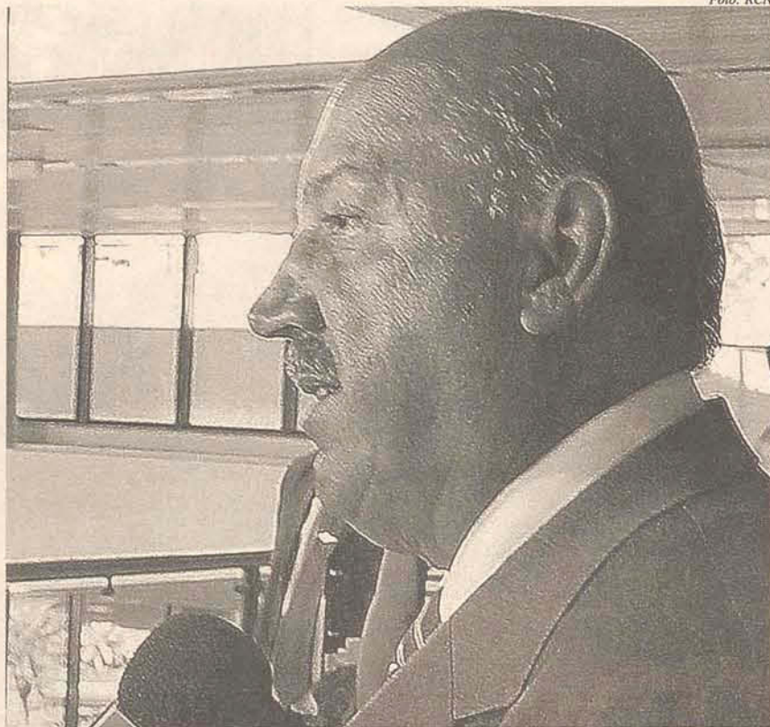
LHS não compareceu ao lançamento do PAC em Brasília

LHS: Com certeza. Por isso nem dei muita importância ao evento. O Plano foi feito sem a consulta aos governadores. Foi feito de cima para baixo e tudo que é feito de cima para baixo não funciona. Deveria haver, primeiro, uma consulta aos técnicos dos governos estaduais, depois aos governadores. Não vi nas medidas anunciadas nada capaz de resolver efetivamente as questões de