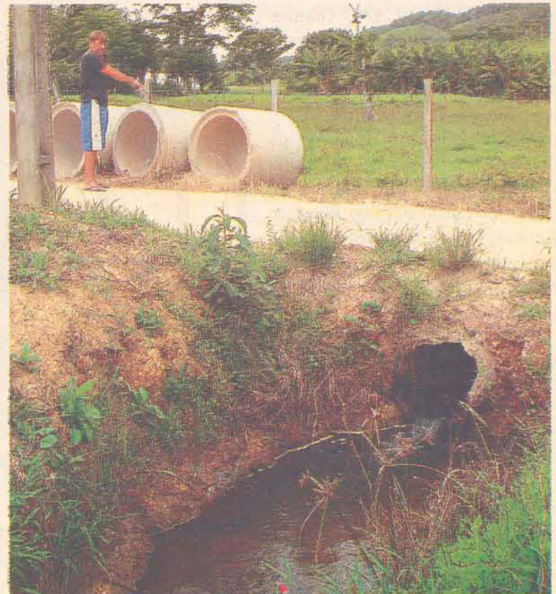
Tubos foram trazidos pela secretaria de obras mas não foram colocados