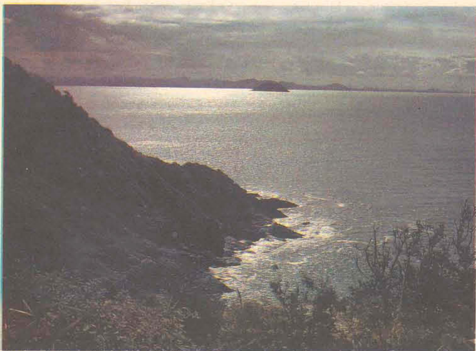
O visual das praias encanta turistas que visitam Penha

■ Beto Carrero World: O maior centro de lazer da América latina e o quinto do mundo, o Parque é um dos roteiros turísticos mais procurados no Brasil e América do Sul. Com grandes investimentos em diversões eletrônicas, shows ao vivo, ambientações, zoológico e inúmeros outros atrativos, já foram aplicados mais de US$ 125 milhões em sua estrutura. Desde a abertura do parque, em 28 de dezembro de 1991, mais de quatro milhões de pessoas já o visitaram, o que apresenta uma média de frequência/dia de 7 mil pessoas, número que chega ao pico de 25 mil durante a temporada de verão/férias. Beto Carrero World está instalado na praia de Armação, município de Penha, em uma área de 14 milhões de metros quadrados, com área urbanizada prevista que se aproxima dos 2 milhões de metros quadrados.