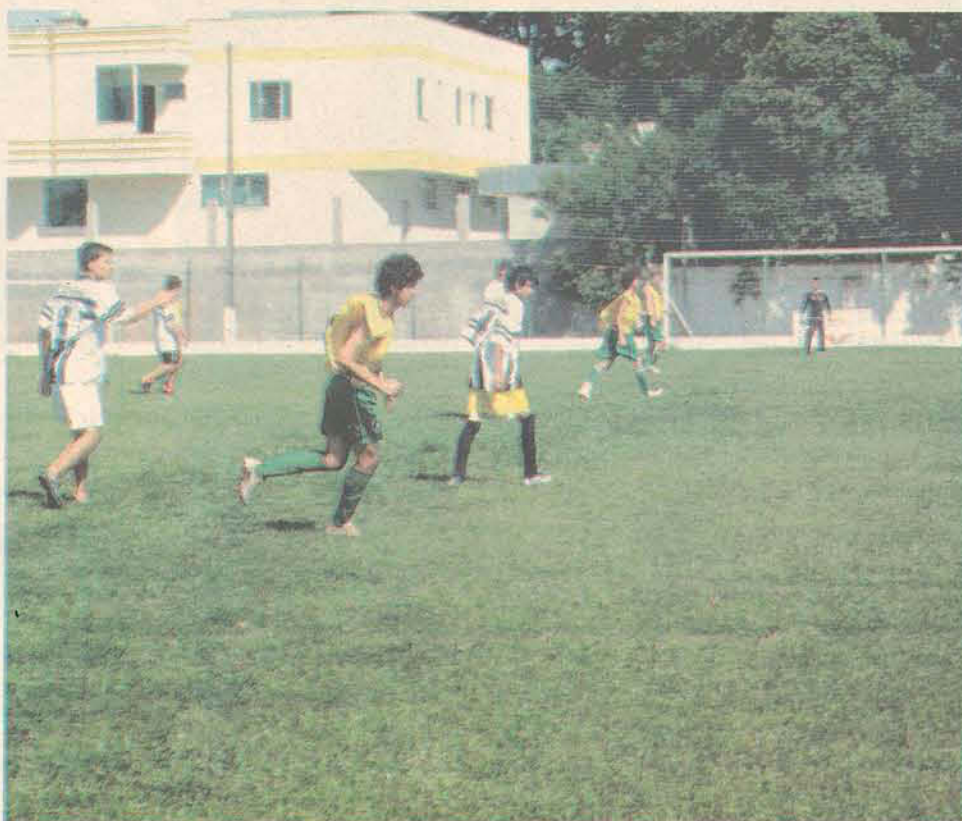
Garotos já estão preparados para os desafios da Taça Umbro.

A competição será realizada do dia 27 de janeiro até quatro de fevereiro e os adversários só serão conhecidos quando chegarem à cidade sede do torneio.