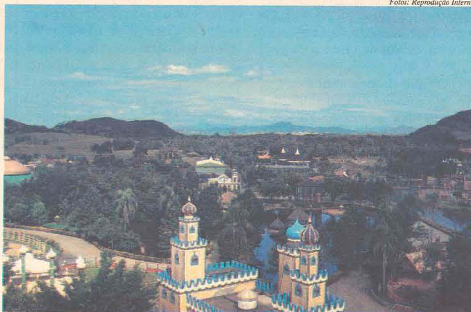
Parque Beto Carrero é um dos responsáveis pelo desenvolvimento de Penha