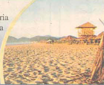
Cultura & Lazer B1

A cidade portuária de Itajaí reserva belezas naturais aliadas à cultura e diversão