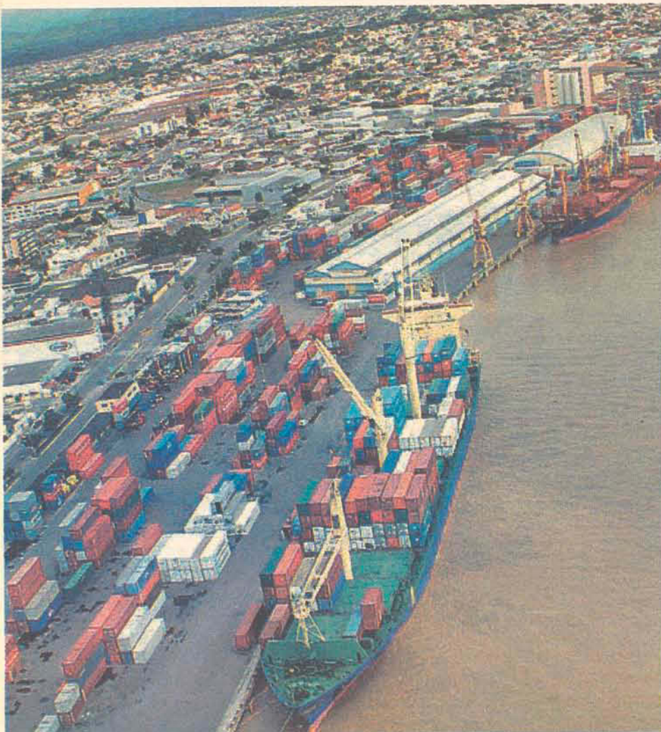
Porto de Itajaí: são mais de 31 mil m 2 para armazenagem de contêineres

Praia de Cabeçudas: É onde estão localizados os casarões que já abrigaram a nata da sociedade catarinense, um passeio pelo bairro é de encher os olhos. Tem mar calmo e por oferecer boa infra-estrutura turística com restaurantes e hotel é uma das praias preferidas pelas famílias. Na elevação no pontal sul, está localizado o Farol de Cabeçudas