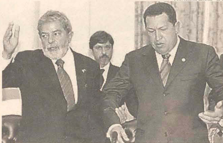
Lula e Hugo Chávez foram centro das atenções no primeiro dia de reunião

tivermos disposição política de compreender que somos diferentes, que vivemos em Estados e países diferentes, com realidades diferentes, e precisamos aceitar o parceiro como ele é, não tentar fazer o parceiro ser como a gente. Assim não dá certo” disse. “Se não compreendermos as assimetrias entre nós, a cada reunião estaremos fadados a voltar para casa frustrados porque as coisas não aconteceram. Para elas acontecerem, temos que mudar muito” acrescentou.