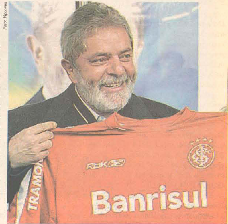
Lula condecora colorados e recebe camisa do Inter de presente

Os suspeitos de terem agredido o ex-presidente colorado foram identificados por meio de imagens das câmeras de monitoramento da Infraero e de testemunhos de outros torcedores presentes no local.