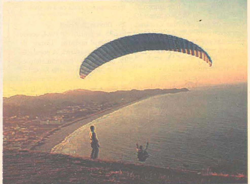
Da pedra do Careca pode-se avistar a praia dos Amores e ao fundo a Praia Brava

Itajaí também se destaca por seus recantos naturais e belas praias. A praia Brava se destaca pelas ondas, conhecida nacionalmente pelos surfistas, e pelos turistas que vêm do