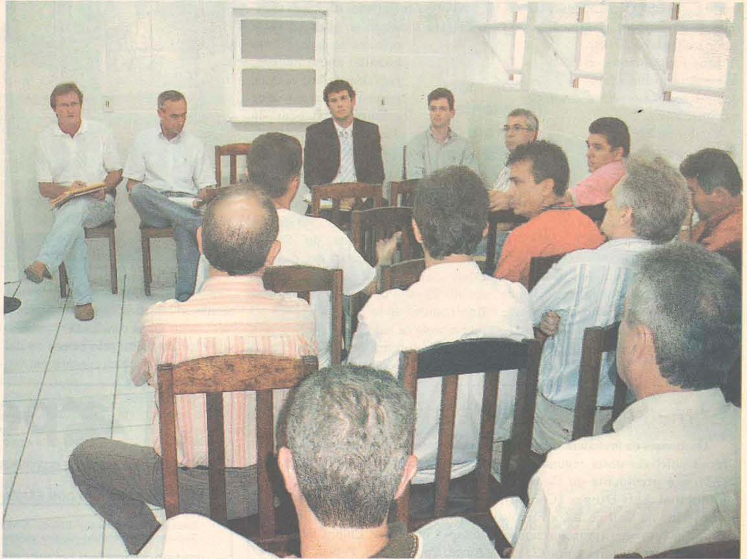
Conselho administrativo e corpo clínico se reuniram para decidir o pagamento do sobreaviso

Também ficou decidido que conselho e corpo clínico estarão conversando sobre as decisões que lhes cabem.