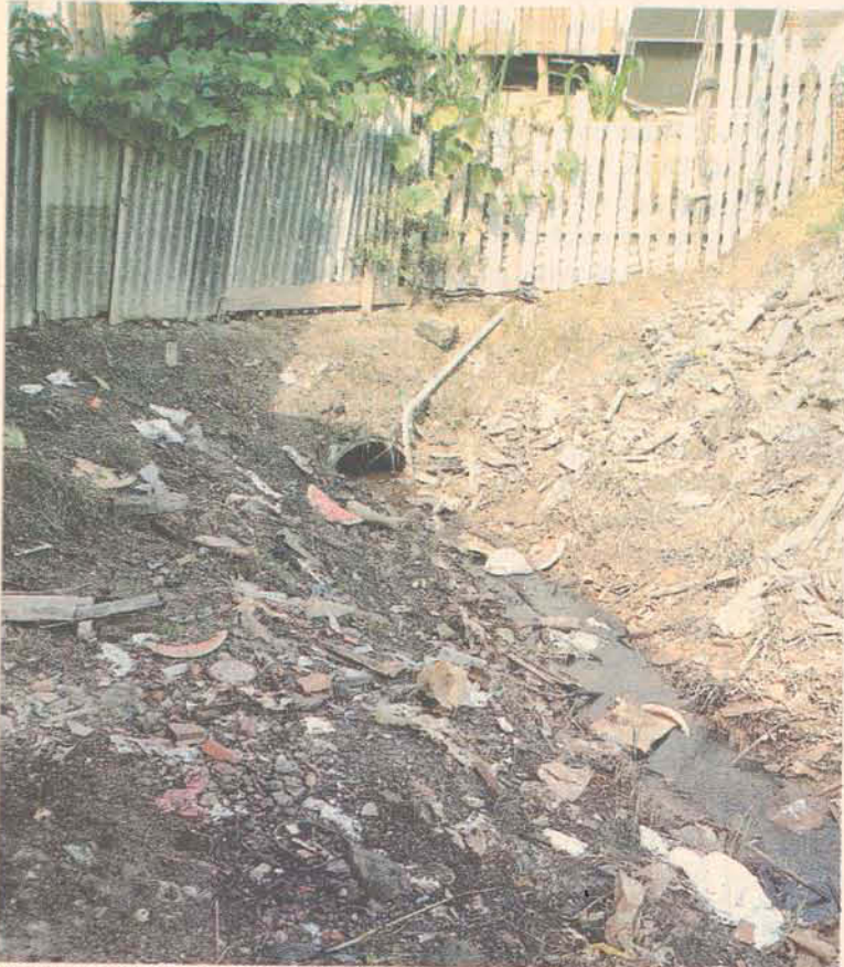
Pequeno trecho sem tubulação causa transtorno em dias de chuva