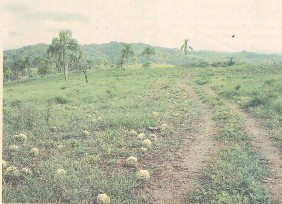
Após 4 meses do plantio, a fruta começa a ser colhida.

500 toneladas de melancia devem ser colhidas na propriedade de Wilmar.