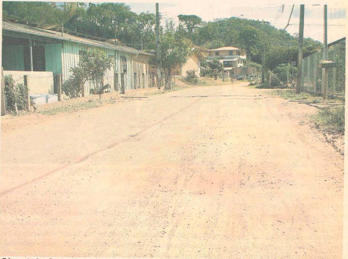
Só a patrola não resolve os problemas de buracos na via