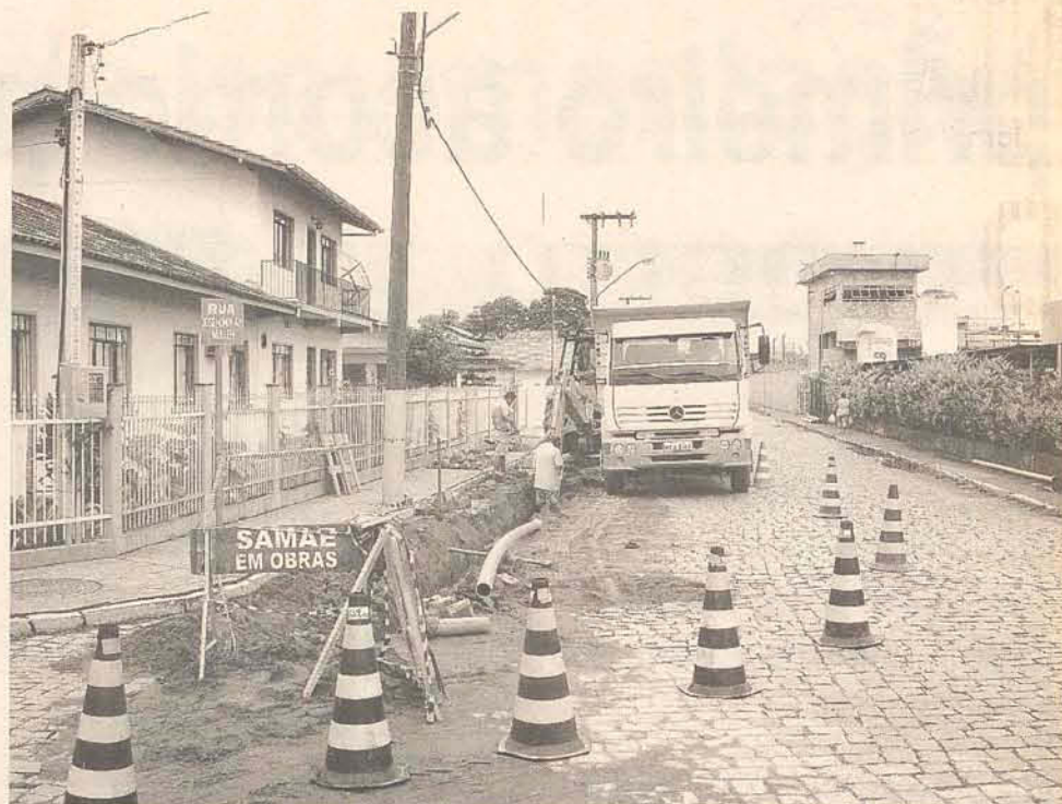
Obras começaram na terça-feira e devem se estender até a próxima semana

ressalta também que assim que os tubos estão sendo colocados já estão recolocando os paralelepípedos, finalizando todo o trabalho. "O rompimento da rede sempre pode existir, porém com essa rede nova e com tubos de maior diâmetro é muito mais difícil de