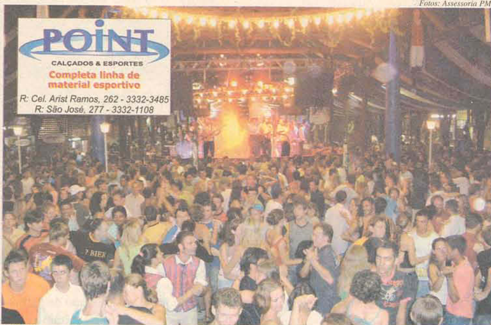
Público se diverte ao som de músicas típicas

Na programação desta edição da Festa Pomerana inúmeras atrações prometem divertir o público, entre elas o desfile cultural, competições típicas e o casamento que é realizado durante a Festa.