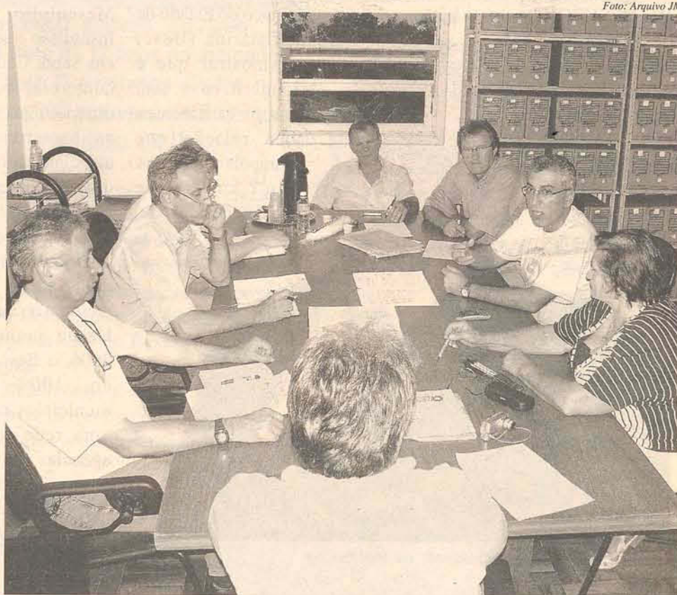
Conselho se reuniu para fazer balanço de 2006 e tomar decisões para 2007