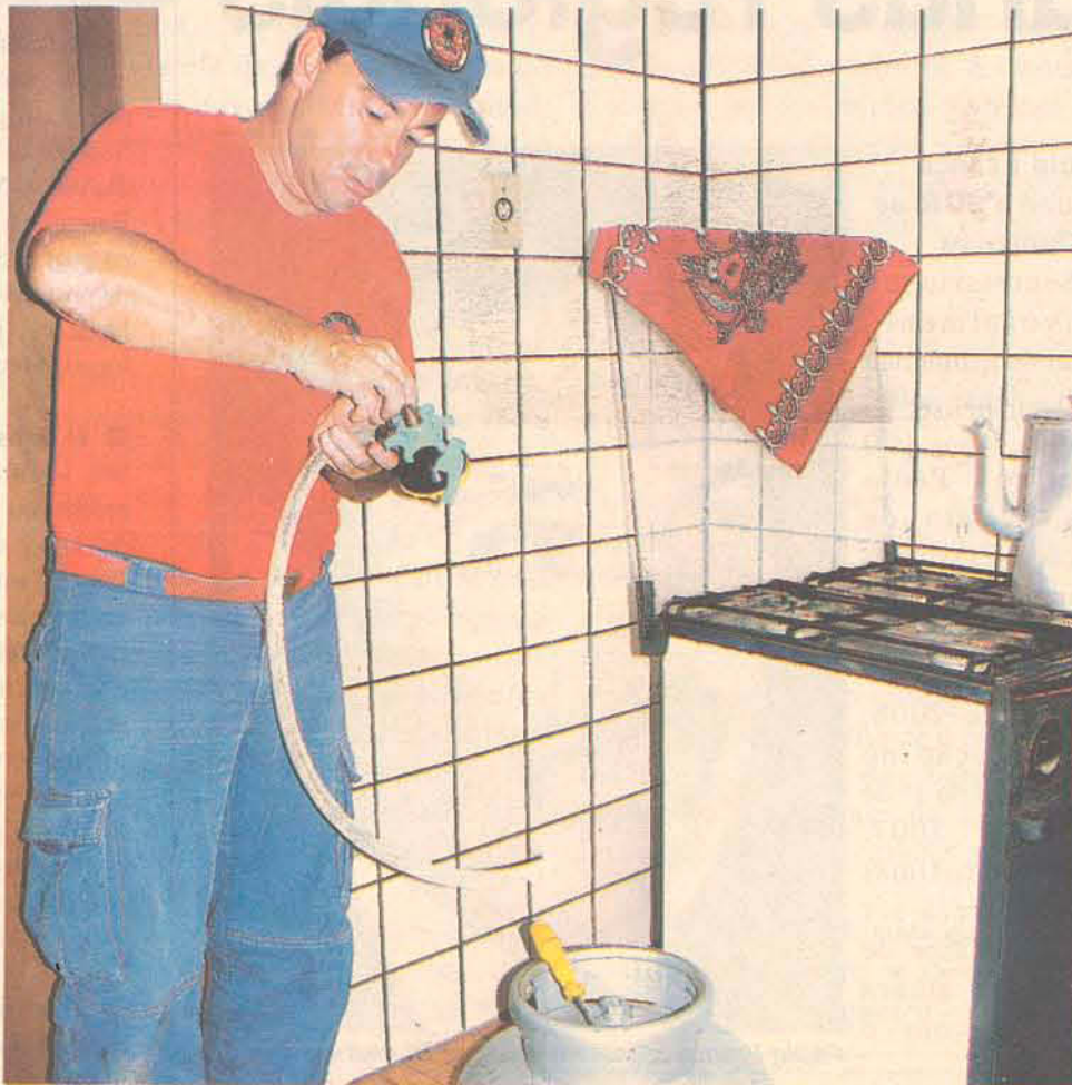
Mangueira de 60 casas foram trocadas pelo Corpo de Bombeiros

Além das trocas de mangueiras, o trabalho de prevenção também foi realizado. Cerca de 600 fôlderes informativos sobre o uso correto do GLP foram distribuídos para a comunidade. Para o soldado Gil, esse trabalho é muito importante, uma vez que o maior índice de incêndios em residências é causado por vazamento do gás de cozinha.