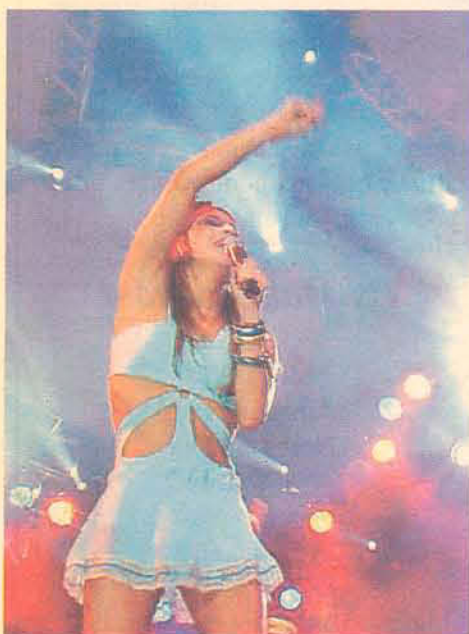
Cláudia Leite promete levantar o Planeta

os ingressos. Para as noites de sexta-feira e de sábado o preço do ingresso é R$ 45,00 e o passaporte para os dois dias de festa custa R$ 80,00. Os camarotes custam R$ 140,00 e só podem ser comprados nas Lojas Renner de Florianópolis.