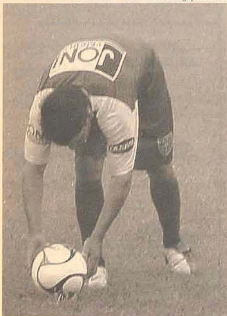
Jogadores do Metropolitano já treinam com a bola amarela

O CAMPEONATO CATARINENSE começa no dia 17 de janeiro, mas a cor da bola já está gerando polêmica. No ano passado a Federação Catarinense de Futebol (FCF) optou por mudar a cor da bola para a disputa Catarinense, fugindo da tradicional bola branca, foi colocada em campo uma de cor