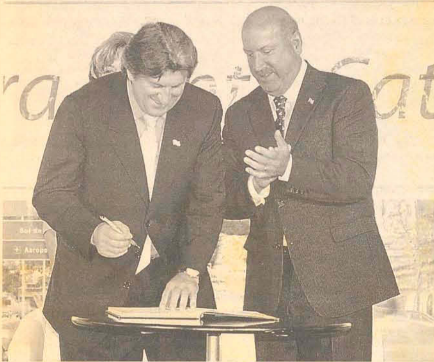
LHS e Leonel Pavan assumiram o Governo do Estado na última segunda-feira

PRIMEIRO GOVERNADOR REELEITO de Santa Catarina, Luiz Henrique da Silveira (PMDB) e seu vice Leonel Pavan (PSDB), tomaram posse na última segunda-feira (1º) no centro de eventos, Centro Sul, em Florianópolis. No discurso, Luiz Henrique voltou a defender a descentralização e