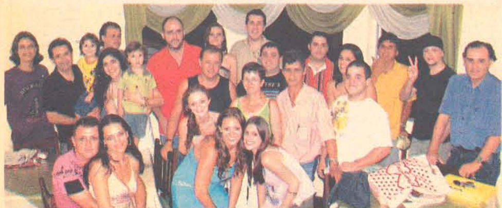
O Jornal Metas reuniu sua equipe no dia 19 de dezembro, na pizzaria Reinado da Pizza, para confraternizar e brindar mais um ano de trabalho dedicado a seus assíduos leitores e anunciantes. O Jornal Metas vem se consolidando a cada dia mais e mais, fruto da confiança depositada pela comunidade e da dedicação de toda equipe, hoje faz parte do cotidiano das pessoas, que têm o jornal como sua fonte de informação.