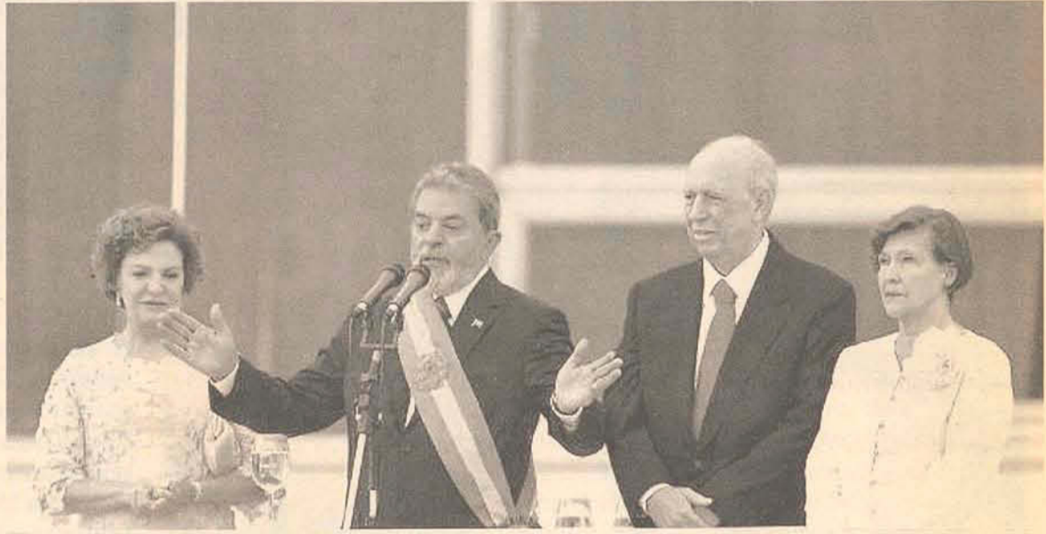
Lula discursa no parlatório do Palácio do Planalto

Lula pede "pressa e ousadia", promete governo popular e ignora aliados