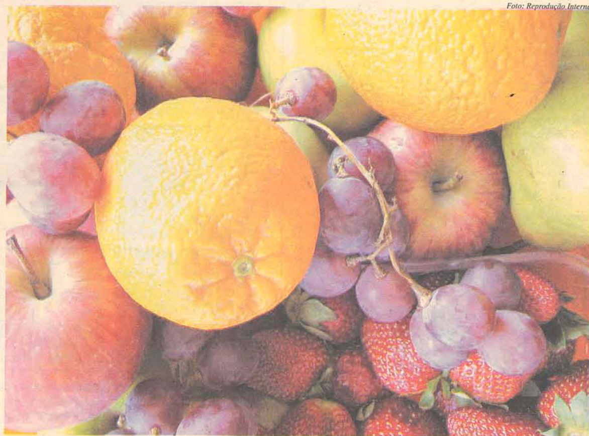
Os produtos orgânicos são mais rentáveis para os agricultores e mais baratos para os consumidores

As empresas e produtores que participam do OrganicsBrasil estão à frente de um mercado extremamente exigente que demanda conceitos de: preservação ambiental, sustentabilidade, respeito ao homem e suas culturas regionais, ecologicamente correto e justiça social. “A busca é sempre por produtos novos,