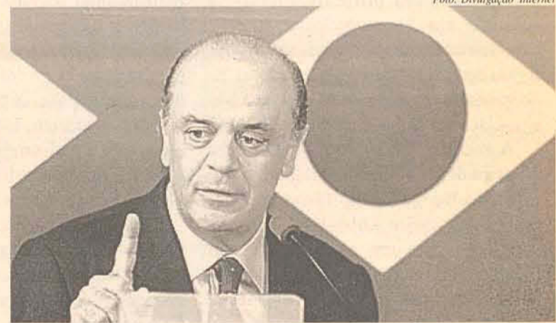
Serra diz não as contratações do Governo

Os concursos cujos editais ainda não tenham sido publicados deverão ser encaminhados aos respectivos secretários de Estado para reavaliação.