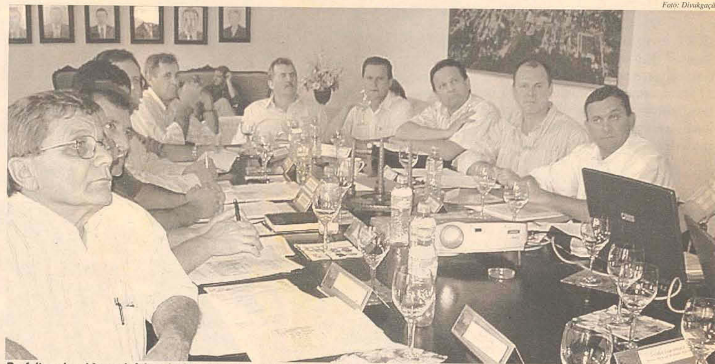
Prefeitos dos 14 municípios da Ammvi estão satisfeitos com os resultados de 2006

"No município de Timbó, o ramo metalúrgico cresceu, em nível nacional, cerca de 26%, o que já era de se esperar, pois as empresas do mesmo ramo em Indaial também tiveram um crescimento representativo" destaca. Simão complementa que no município de Indaial o setor que despontou foi o