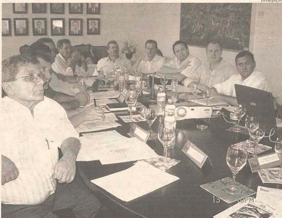
Além da eleição, reunião discutiu as questões do município

*Gervásio escreve aos Sábados neste espaço