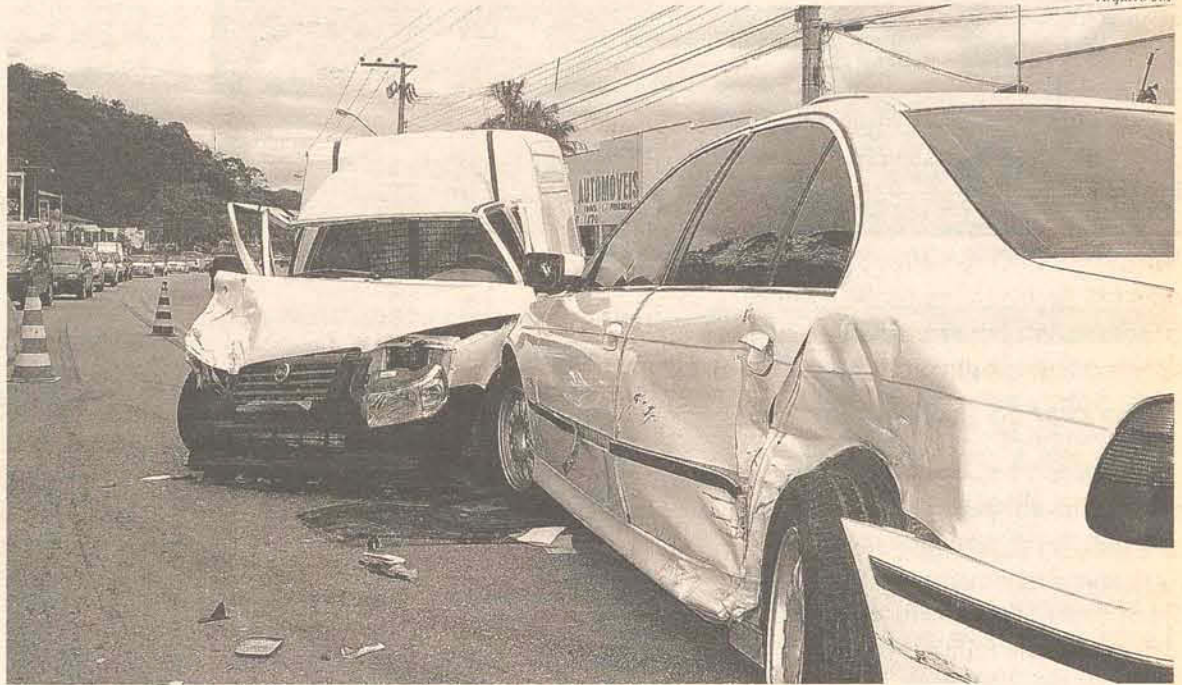
Segundo estudo, colisões frontais são as que mais matam

O estudo mostra que, nas rodovias federais, seis em cada dez acidentes ocorrem de dia, com tempo bom e nos fins de semana ou meses de férias. A maioria dos acidentes com