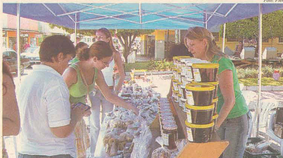
Produtos coloniais estarão à venda na Praça

A Secretaria de Desenvolvimento Social marcará presença com os lindos artesanatos confeccionados pelos grupos de Terceira Idade. A conferência Vicentina também irá expor os dotes artísticos de alguns gasparenses. A Secretaria de Agricultura estará dando mais uma vez seu apoio ao evento em parceria com a Cooper Gaspar, que comercializará seus deliciosos produtos coloniais durante o evento. A Secretaria de