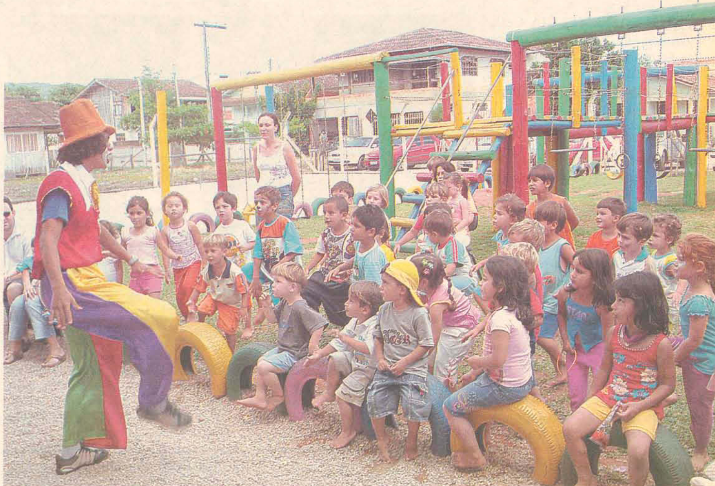
Palhaço pirulito animou a criançada no CDI Vovó Lica

Mais de 100 pequenos, de zero a seis anos, puderam desfrutar das