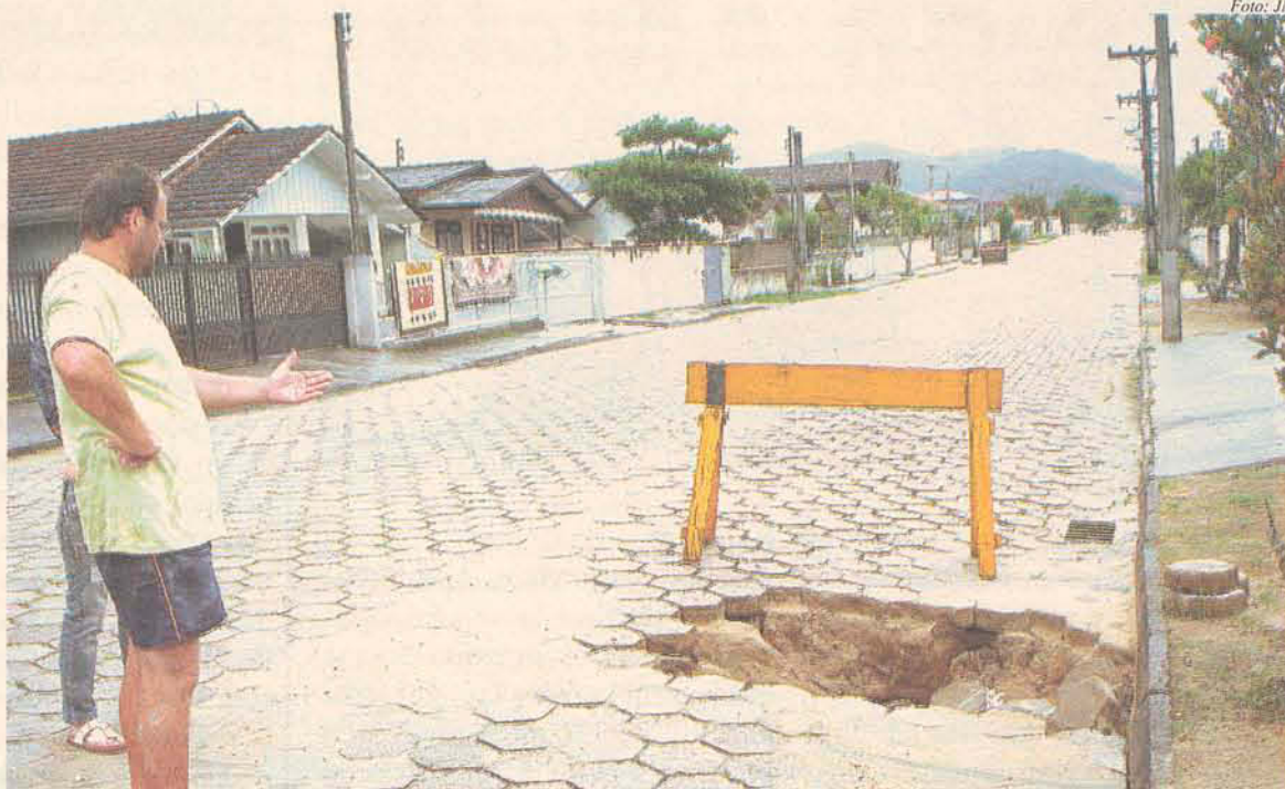
Alcides acredita que o buraco pode ser um perigo aos moradores

Alcides Denzer é um dos muitos moradores que está preocupado com a situação. Ele diz já ter tampado um buraco em frente a sua residência. “A