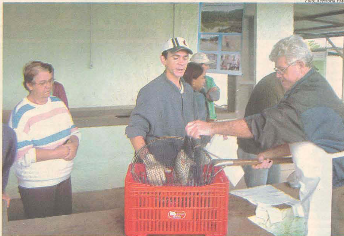
Organizadores da feira pretendem comercializar 200kg de tilápia

A nova diretoria estará responsável por desenvolver os