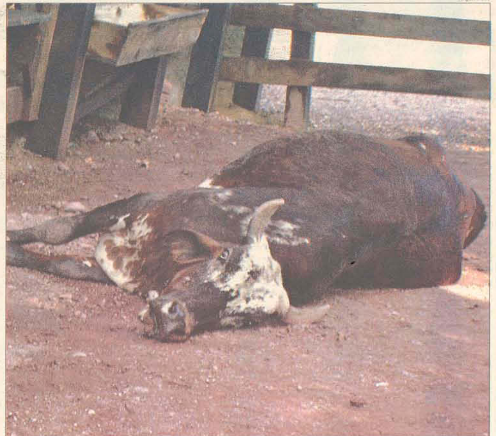
Animais catarinenses não devem mais sofrer com a aftosa

10 mil exames de sanidade animal deverão ser mostrados