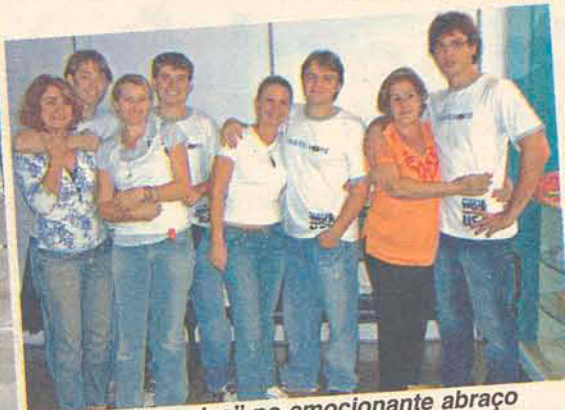
As mães "corujas" no emocionante abraço minutos antes do embarque em Navegantes