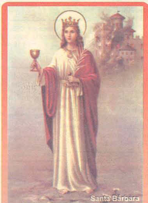
Santa Protetora das Tempestades. Raios, Trovões e Morte Repentina

Uma jovem inteligente, bonita, de família muito rica fanáticos pagões, que às ocultas dos pais consegue instruir-se na religião cristã e se torna evangelizadora. Por este motivo, foi condenada à morte. Seu próprio pai, cego em seus barbaries, não poupou nem a vida da própria filha, foi o executor da sentença, cortou a cabeça da filha com um golpe de espada, logo após à execução, o carrasco caiu fulminado por um raio.