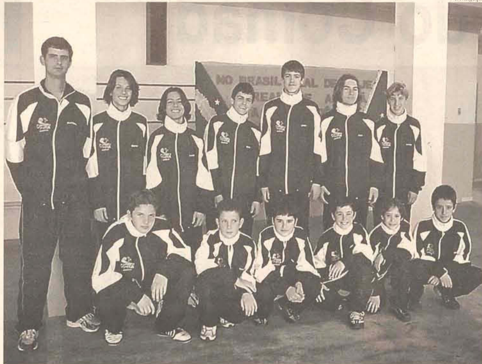
Meninos do Frei Policarpo conseguiram resultado inédito