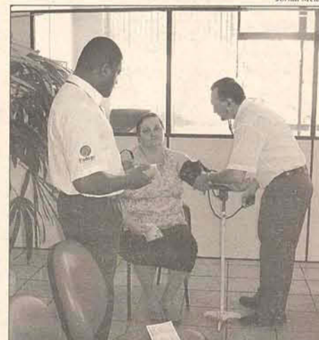
Aposentados medem pressão no BESC