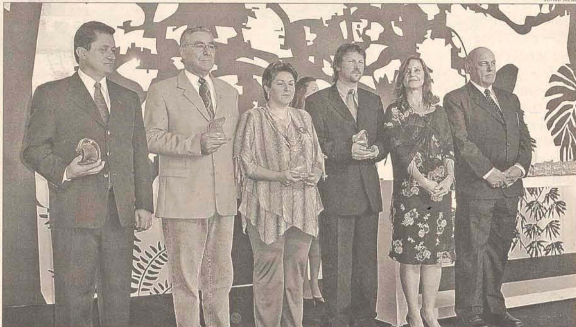
Vencedores das ações e projetos de Preservação da Biodiversidade e dos Recursos Naturais

Nesta edição foram realizadas 122 inscrições, foram premiados 28 projetos em cinco categorias, Preservação da Biodiversidade e dos Recursos Naturais, Controle dos Impactos Ambientais, Reciclagem e Recuperação de áreas degradadas, Educação e