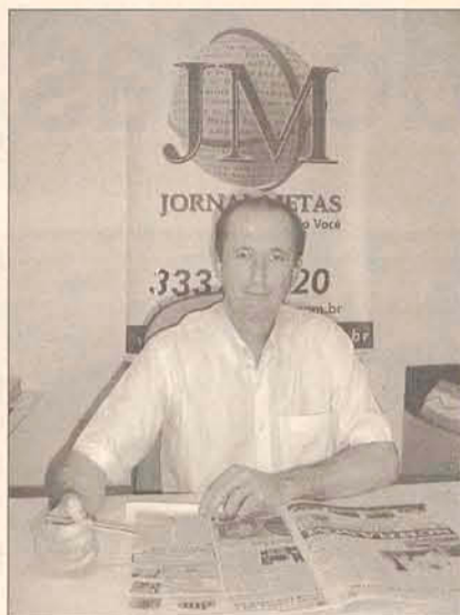
Ademar: comprometimento social

município de Ilhota está garantido e será depositado nas contas dos funcionários no dia 15 de dezembro.