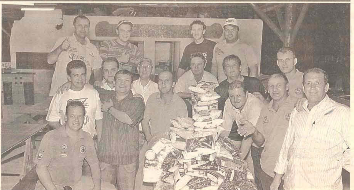
Equipe do Jeep Club de Gaspar com os alimentos arrecadados