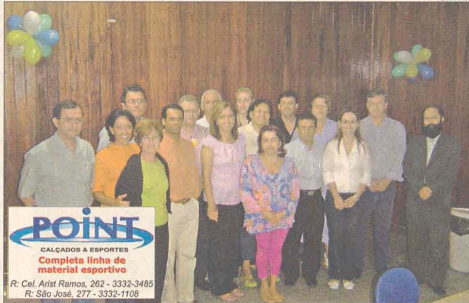
Prefeito, o vice e a secretária de saúde estiveram presentes na posse dos conselheiros