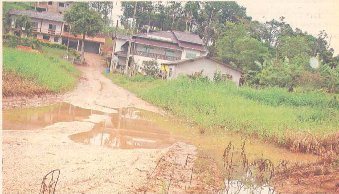
Por causa de uma boca de lobo entupida, a rua Edésio Maia ficou alagada

A moradora diz já ter tido prejuízos até com o seu carro, que estragou por ter que passar dentro da água. "Quando o tempo está bom e sem chuvas, nosso