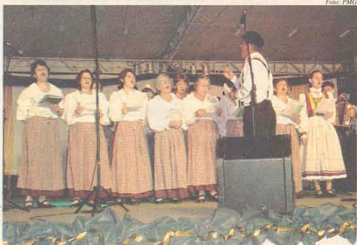
Apresentações culturais irão inaugurar o Natal de Gaspar

Gaspar abrirá oficialmente suas portas para a chegada do Natal. Amanhã (26), às 20h, a Praça Getúlio Vargas servirá de palco para as diversas apresentações culturais e para a inauguração da iluminação e decoração natalina da cidade, que vão marcar a abertura do “Gaspar Natal em Festa 2006”, sob a coordenação