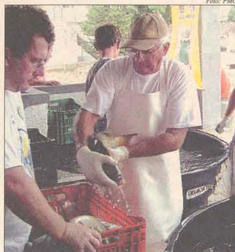
Feira deve comercializar 200Kg de Tilápia