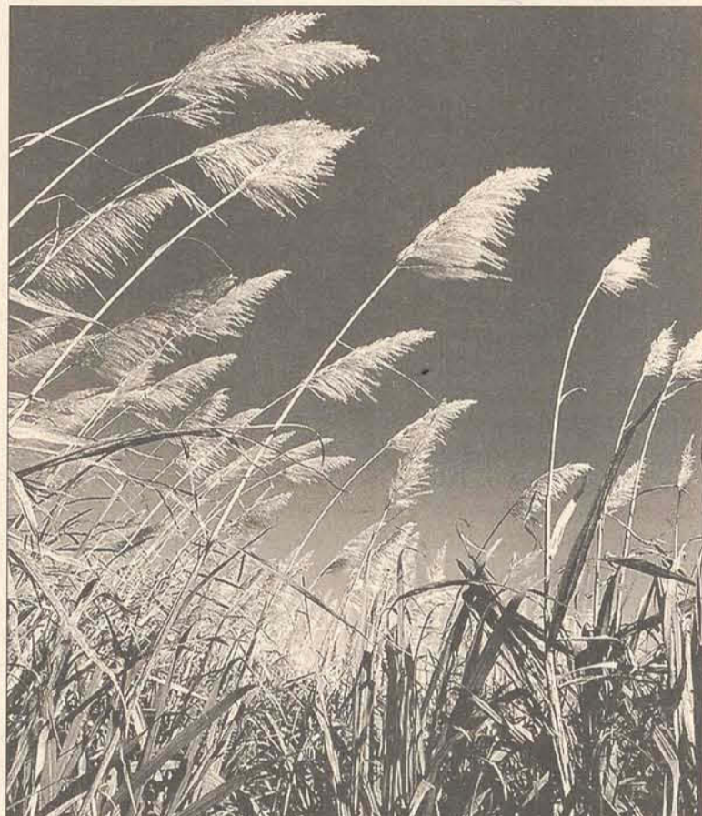
Produção de álcool obtido através da cana-de-açúcar deve aumentar