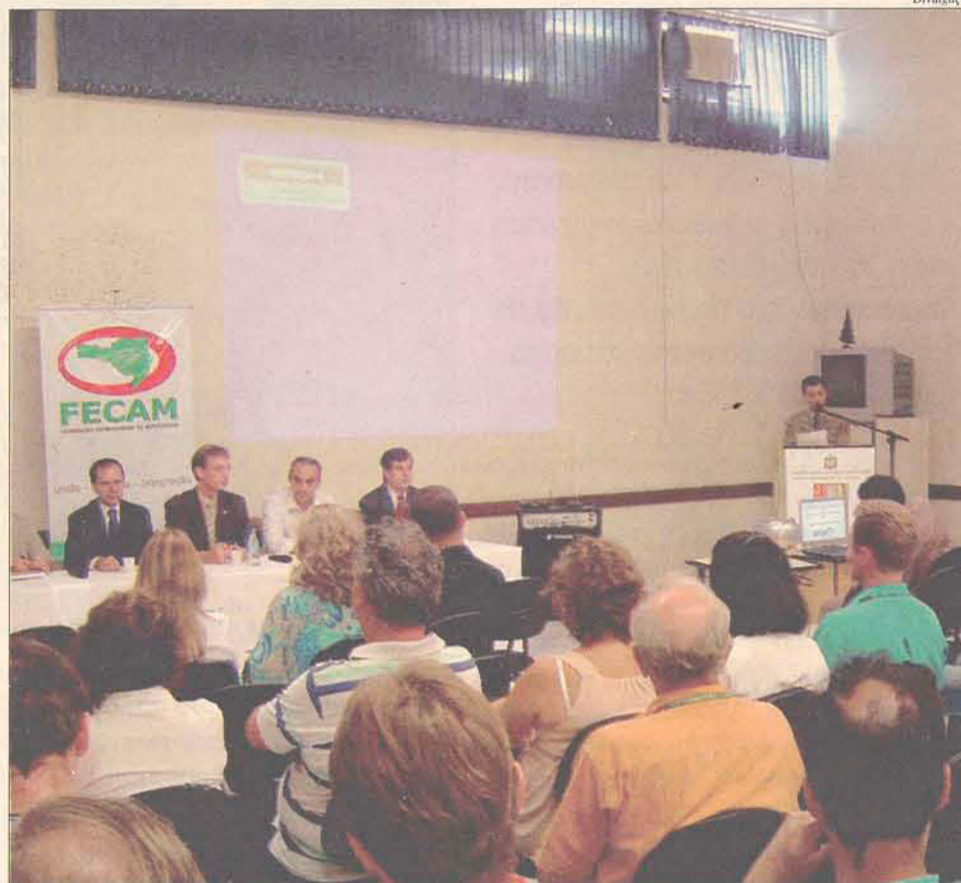
Foram discutidas as dificuldades enfrentadas nos programas de segurança sanitária

Chinato também informou que os municípios menores, sem condições de contratar servidores em número adequado para a efetivação dos serviços, têm possibilidade de, através de lei municipal, formar convênios com outros municípios para participar do custeio de um órgão ou serviço regionalizado de orientação e fiscalização.