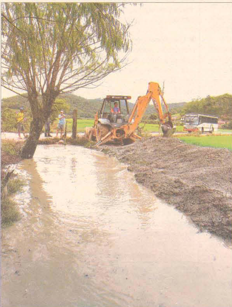
Ribeirão após o desassoreamento: problema não está solucionado