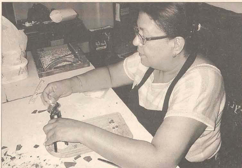
Aluna do curso de mosaico finaliza suas peças

apresentações musicais e teatrais dos alunos das oficinas de música e teatro. Cerca de doze peças musicais serão executadas pelos alunos do curso de música e a peça "Diante da Morte", de August Strindberg, será encenada pelos atores amadores.