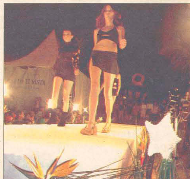
Desfile mostrou a qualidade do calçado de SJB