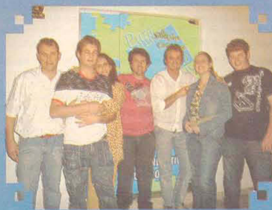
As imagens mostram a inauguração da Pura Arte, em 20 de novembro