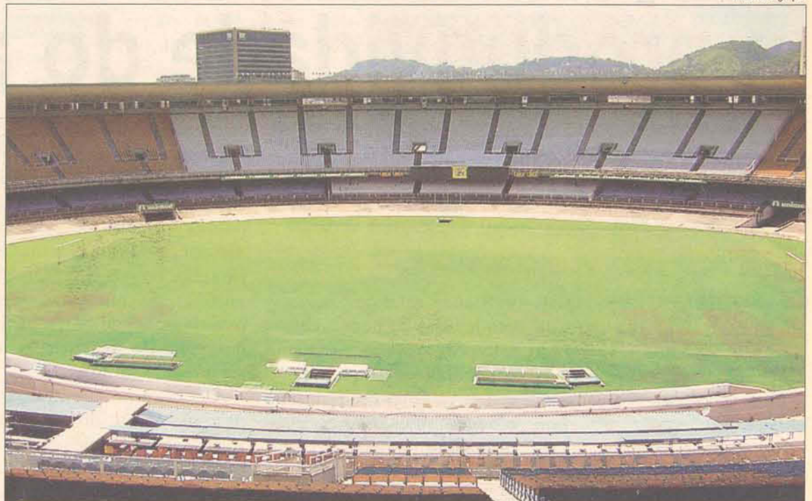
Teixeira acredita na recuperação do Maracanã para Copa 2014

O ministro afirmou ainda que a Vila Olímpica no Rio de Janeiro, que vai abrigar os Jogos Pan-Americanos, está