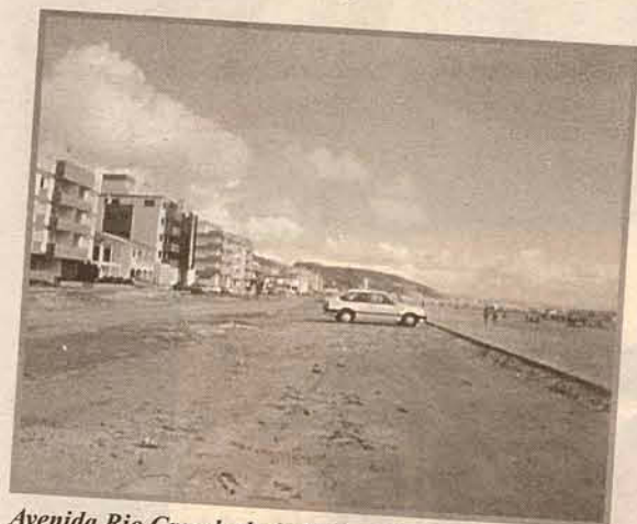
Avenida Rio Grande do Sul/Maurílio Kfourri, na praia do Mar Grosso nos anos 70.