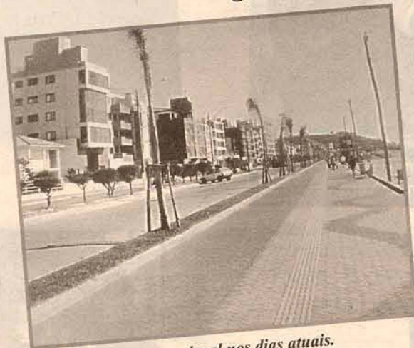
O mesmo local nos dias atuais.