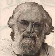
Leonardo Boff Teólogo, escritor e professor universitário

Por fim, para uma percepção da fé bíblica, o pobre sempre será a imagem desfigurada de Deus, a presença do pobre de Nazaré, crucificado que deve ser baixado da cruz. E por fim, no entardecer da história universal, os pobres serão os juizes de todos, porque, famintos, nus e aprisionados, não foram reconhecidos como a presença anônima do próprio Juiz Supremo face ao qual, um dia, todos compareceremos.