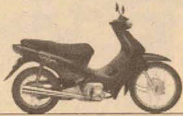
C 100 Biz