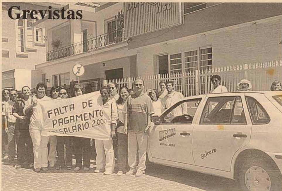
Funcionários grevistas do Hospital de Caridade Senhor Bom Jesus dos Passos, estiveram em frente à Rádio Difusora, agradecendo o apoio dispensado pela emissora ao movimento. Aqui o registro.

O tempo passa... Quem tem vinte aninhos já viveu mais de 10 milhões de minutos... Ao completar 28 anos, já terá ultrapassado a marca dos 10 mil dias de vida... Pouco... Pouco antes de completar 42 anos você atingirá os 500 meses de vida... Aos 80 anos, o vovô já terá vivido 700 mil horas... Pra quem pensa que a vida começa aos 40, nessa idade já terá vivido mais de 1,2 bilhão de segundos.