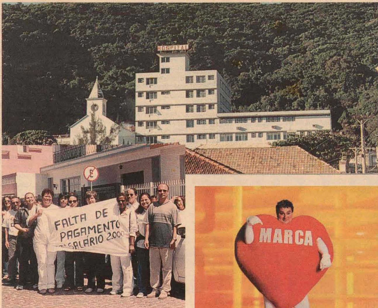
Servidores do hospital continuam em greve