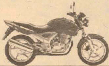
Twister CBX 250