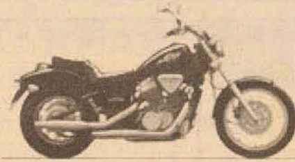
Shadow VT 600

Nesta semana, você compra a sua moto 0Km ou usada e ganha o emplacamento!