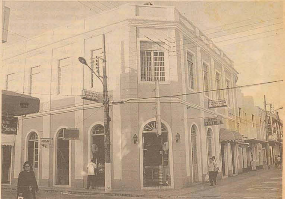
O mesmo local.