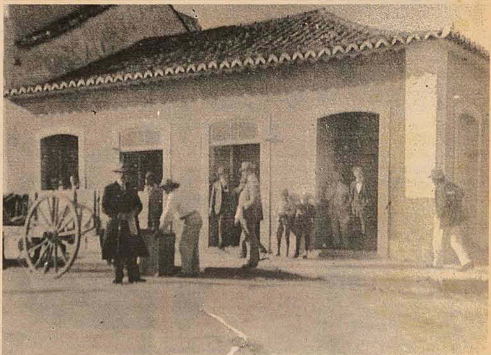
Esquina das ruas Raulino Horn com XV de Novembro, em 1925.