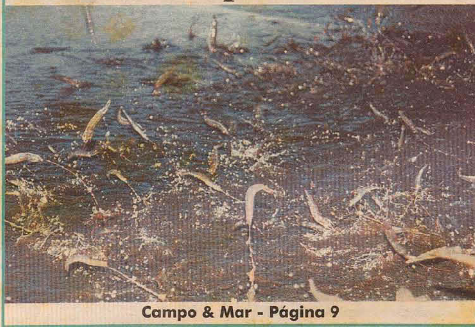
Campo & Mar - Página 9