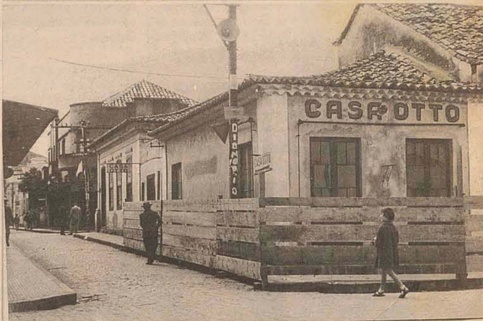
Rua Tenente Bessa, esquina com Gustavo Richard, em 1965.