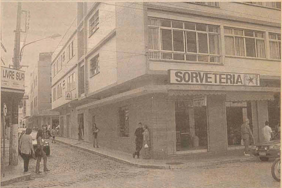
No mesmo ângulo.