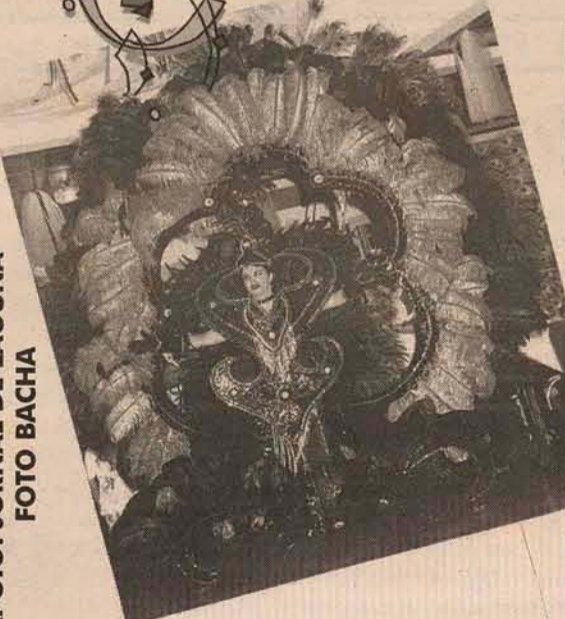
APOIO: JORNAL DE LAGUNA