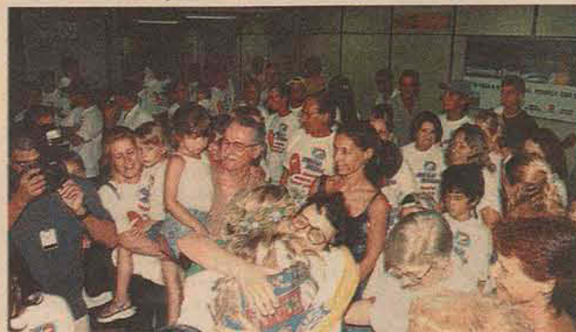
Flashes da chegada no Aeroporto Hercílio Luz e no caminhão do Corpo de Bombeiros, já em Laguna