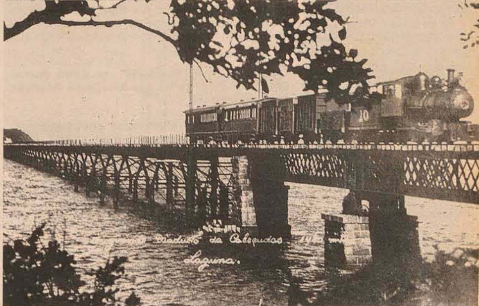
Ponte ferroviária de Cabeçuda, em 1935