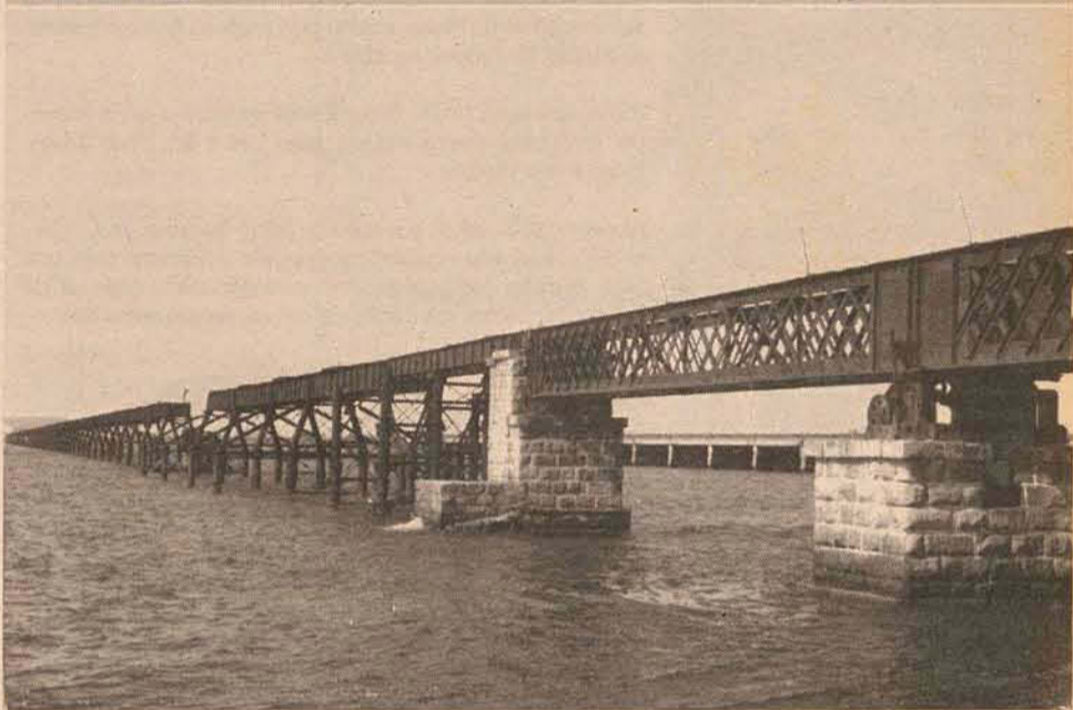
No mesmo local.

EXISTE UM LUGAR EM LAGUNA QUE VOCÊ NÃO CONHECE