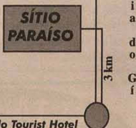
Rótula do Portinho