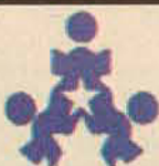
FOTO BACHA REVELAÇÃO COLOR EM 1 HORA FUJI IMAGE PLAZA Praça República Juliana Centro - Laguna - Fone: 646.0840

Dentre as opções noturnas do último sábado, em Laguna, Mystura Fina foi a que mais agradou. A festa Ladies First atraiu um grande público. Apesar do clima estar animado, a boate acabou esvaziando mais cedo que o habitual. Quem conseguiu arrumar sua lady pode curtir mais algumas horas de prazer na noite de sábado.