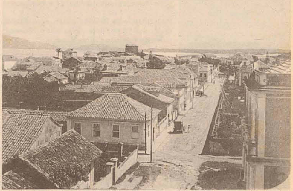
Rua Voluntário Firmiano, em 1940.