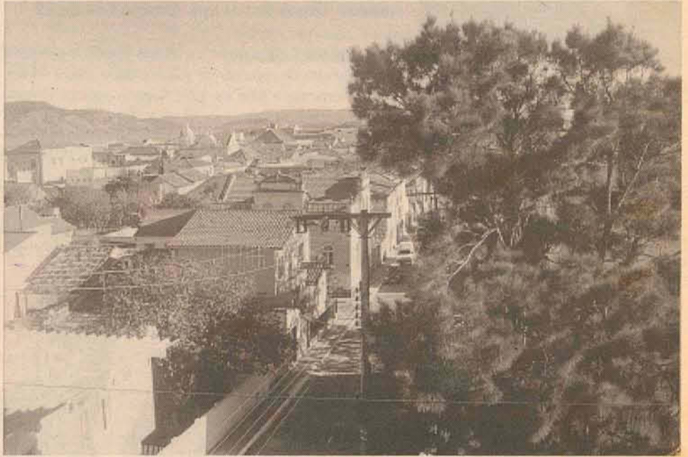
No mesmo ângulo.