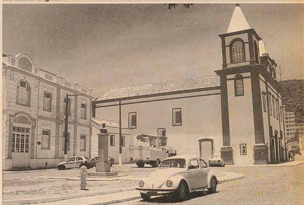
No mesmo ângulo.