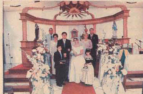
Os noivos com o pai na Capela Santa Teresinha