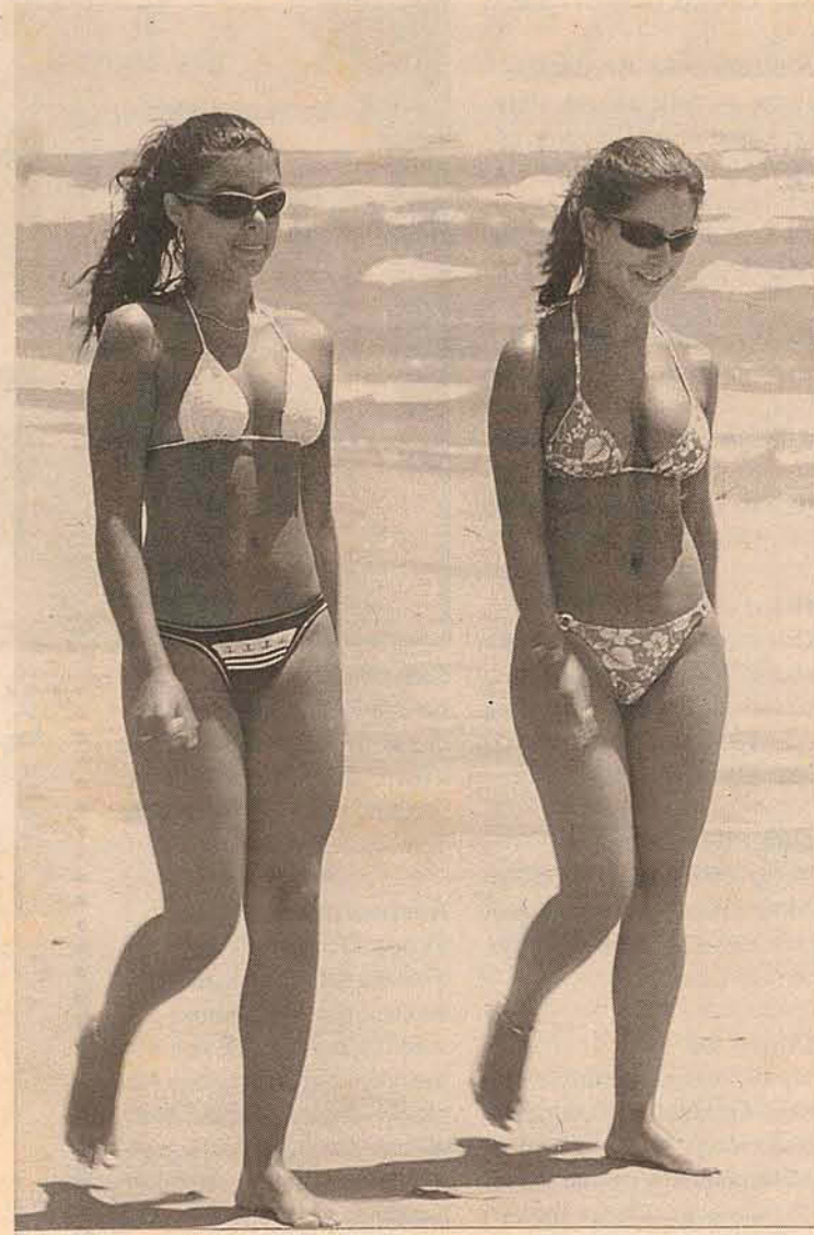
Ai que saudade do verão...

Safadinhas: cidadão que pensa entrar para a Marinha tem que saber nadar. E se fosse para a Aeronáutica, teria de saber voar? // Do fósforo para o cigarro: por sua causa perdi a cabeça.