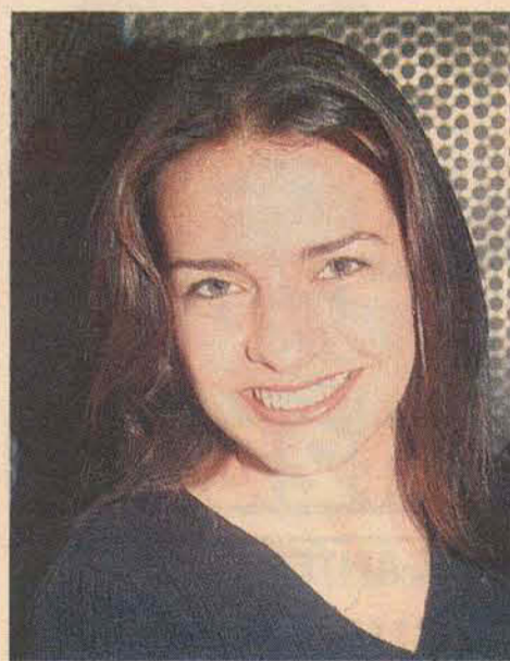
Belas mulheres como a da foto marcando presença no show de Djavan, na Probusul

Hoje, amanhã e domingo, excursão para os shows da Probusul ao preço de 5 reais. Para maiores informações e reservas de lugares, falar com Rodrigo Bento (Corôa), fone: 644.0337 (Rádio Garibaldi).