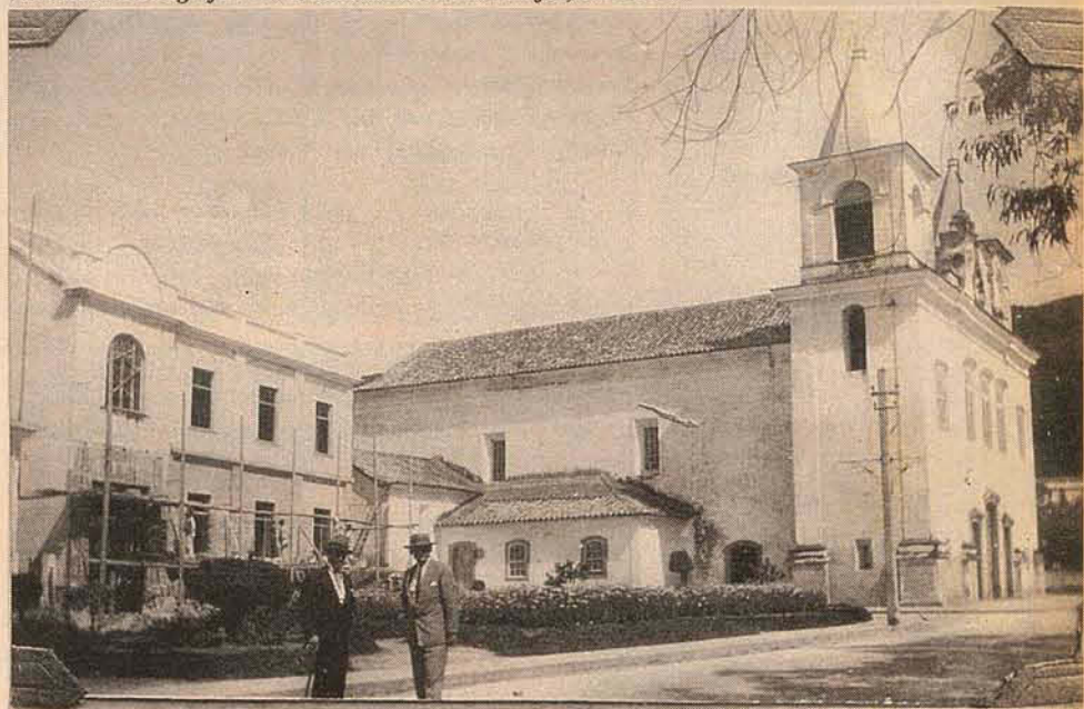
Vista lateral da Igreja Matriz Santo Antônio dos Anjos, em 1929.