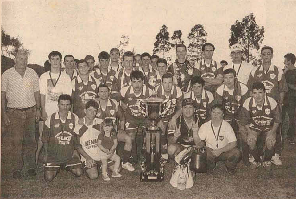
Água Verde, de Barreiros, o grande campeão de 99, buscará o bi-campeonato.