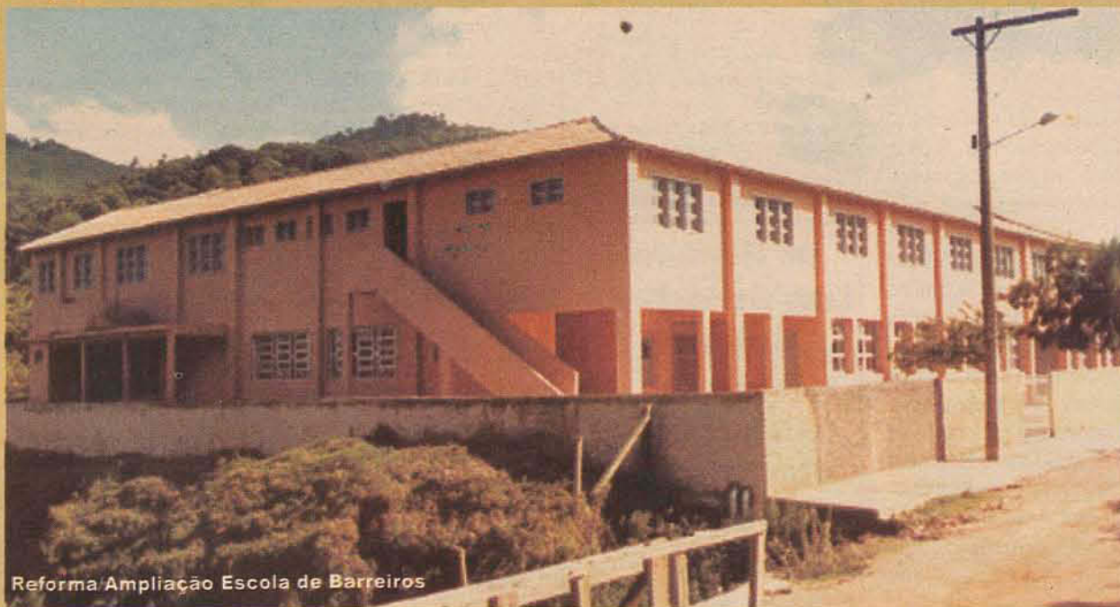
Reforma/Ampliação Escola de Barreiros