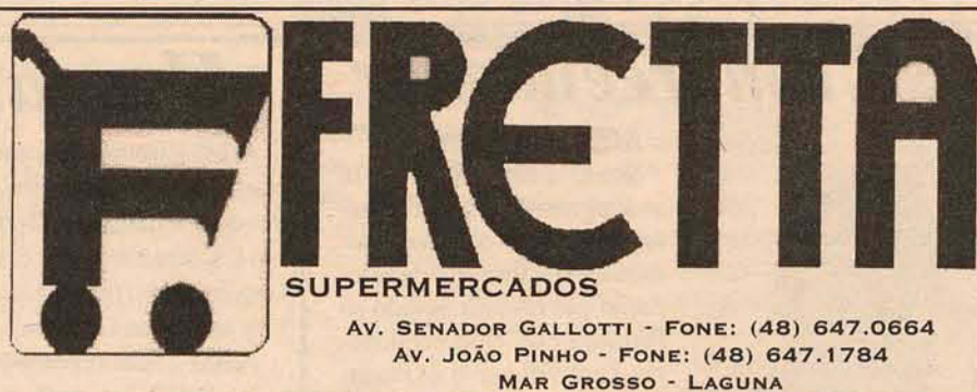
TABELA DE PREÇOS DA CESTA BÁSICA