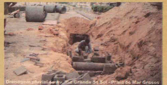
Drenagem pluvial de Av. Rio Grande do Sul - Praia do Mar Grosso