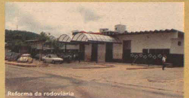
Reforma da rodoviária