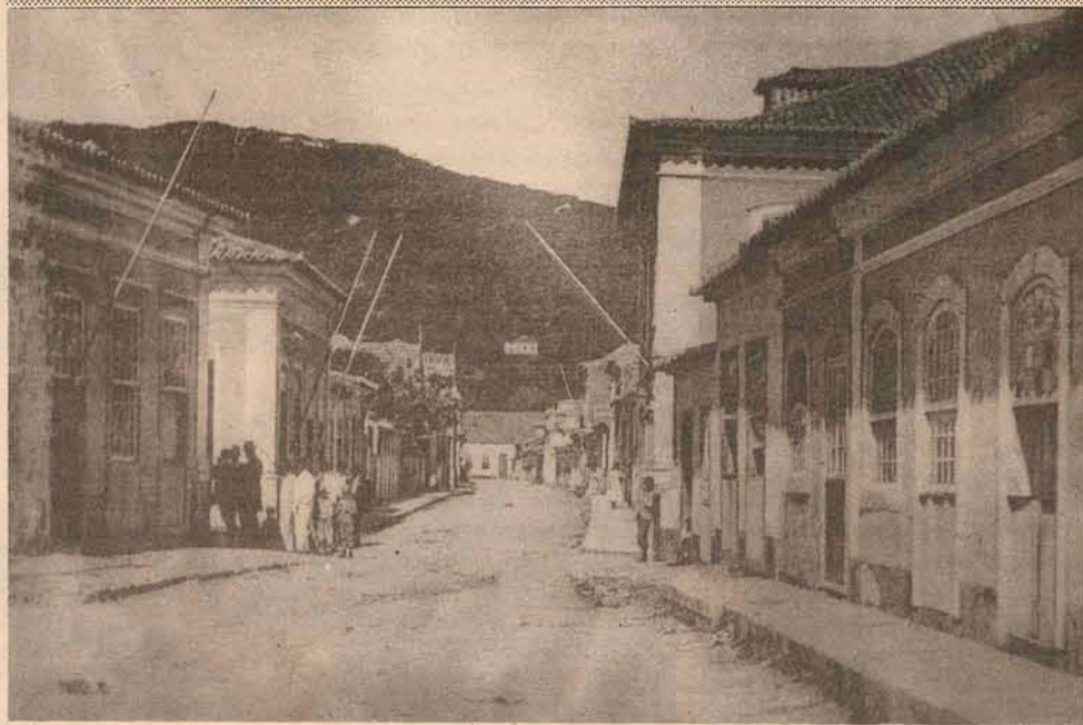
Rua Raulino Horn, no centro da cidade, em 1935.