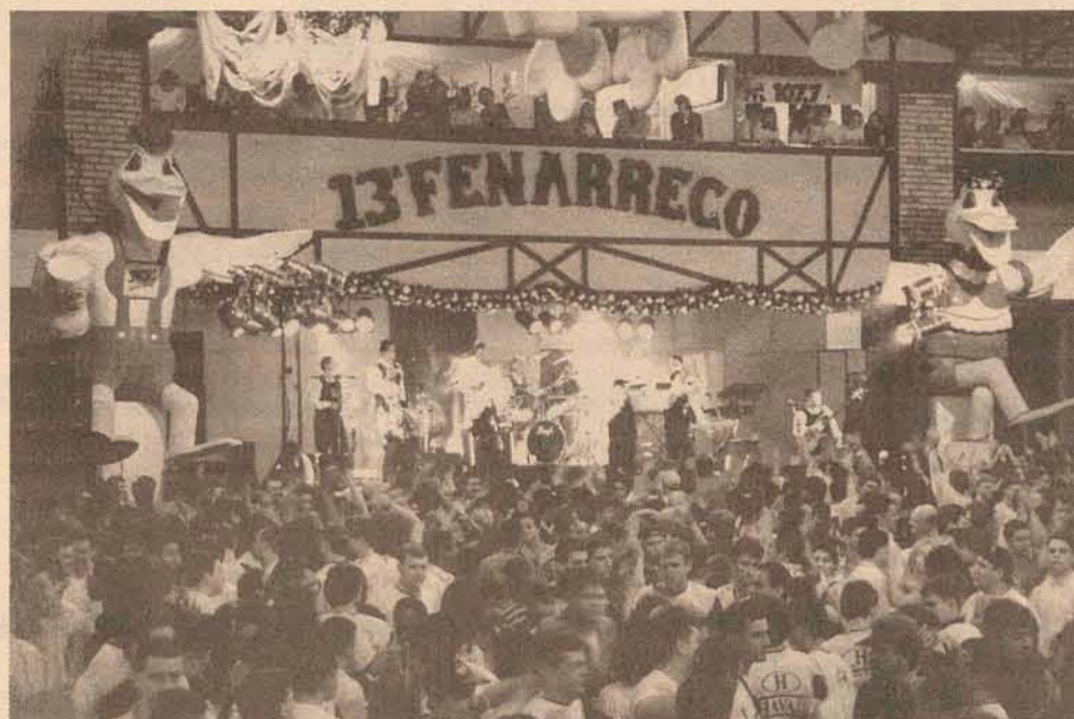
Vai começar em Brusque, a 14ª Fanarrecó - Festa Nacional do Marreco - que tem a maior concentração de loiras por metro quadrado (e pra quem gosta é um prato cheio, mano véio). É nos dias 7 a 12, 15 a 17 e 21 a 24 de outubro. O JL apresenta reportagem completa semana que vem. Prosit !!!

Laguna, SC, em 16 de setembro de 1999 Anibal Jeremias Delegado Regional de Polícia