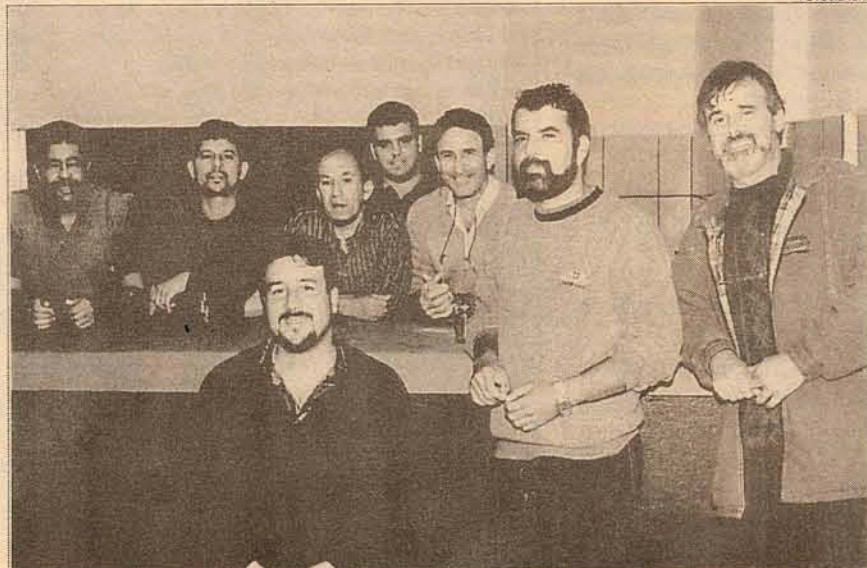
Ativos diretores da Sociedade Recreativa 3 de Maio, anunciando baile de aniversário, dia 2 de maio, com uma famosa orquestra do Paraná.