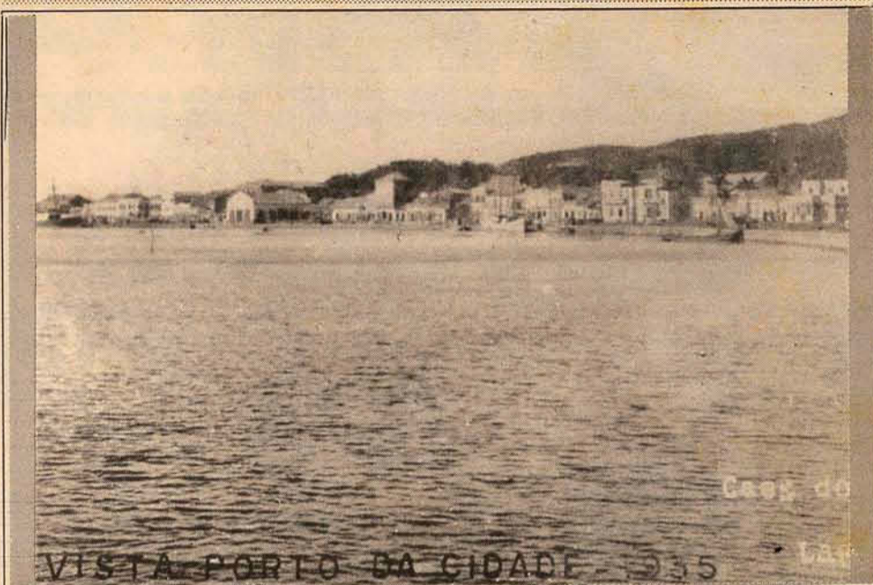
Vista da cidade, junto ao cais, em 1935.