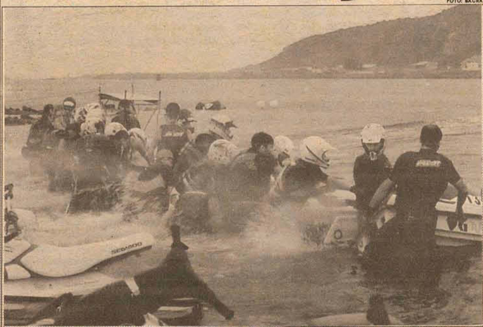
Disputada aqui no final de semana, a 5ª etapa do Estadual de Jet-sky.