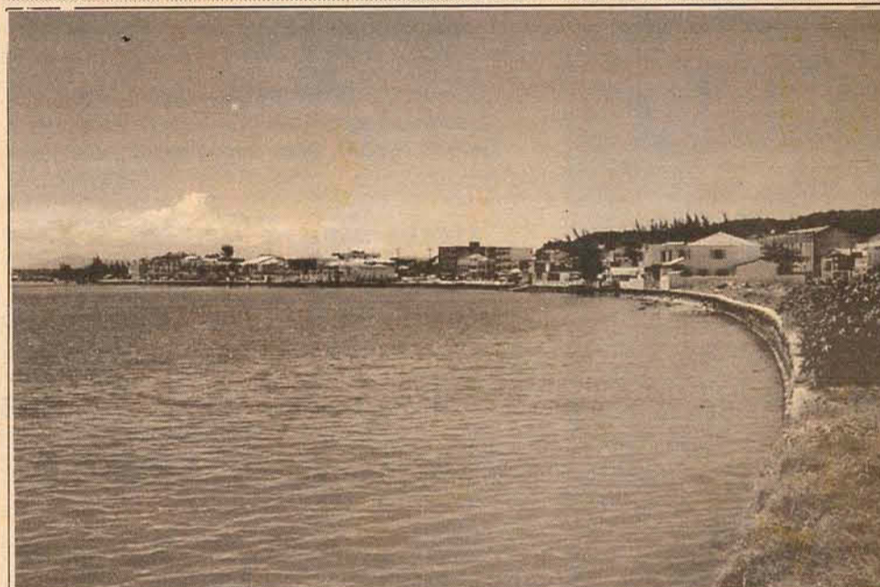
Mesmo local, hoje.