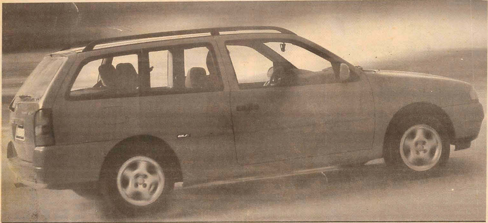
Este veículo está em conformidade com o PROCONVE.

Para shows, contate com a Art 5 Empreendimentos Ltda, pelo fone (011) 851.0090. Outros artistas da empresa: Só Pra Contrariar, Piloto Automático (banda formada pelos atores da Rede Globo, Kadú Moliterno, Marcelo Serrado e Rômulo Arantes).