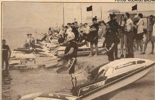
Gente bonita, de olho na competição e os preparativos para 2ª bateria