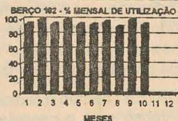
% DE UTILIZAÇÃO DOS BERÇOS Porto de S. Frco. do Sul - 1996