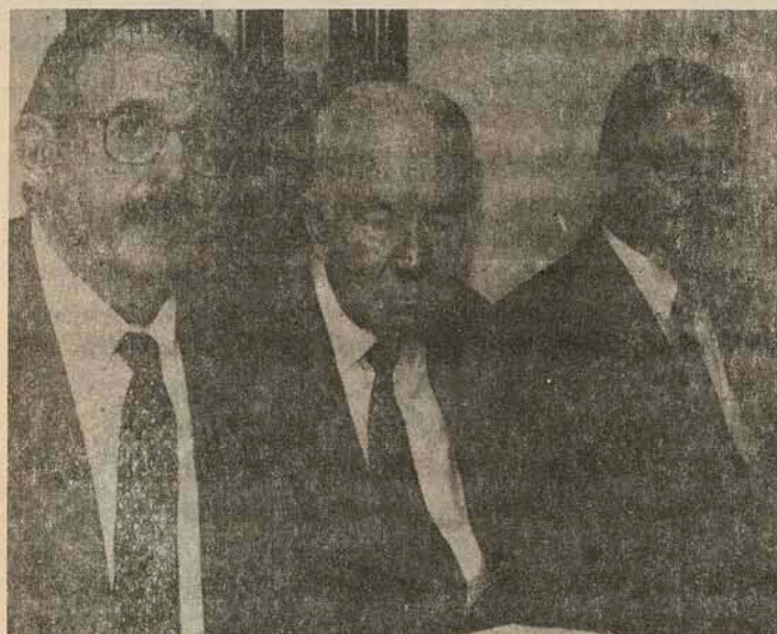
Ministro Jobim anuncia instalação da PF em Joinville

Em reunião no gabinete do prefeito Wittich Freitag, o ministro da Justiça Nelson Jobim anunciou segunda-feira a criação da Delegacia da Polícia Federal em Joinville. O decreto foi publicado no Diário Oficial da União sexta-feira passada.