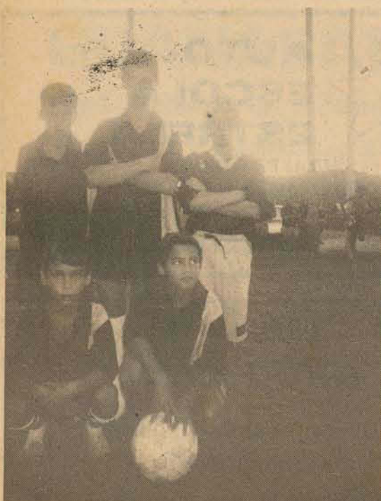
Equipe Rua Diogo Soares Pereira

Rua Guanabara, 778 - Nosso telefone: (0474) 36-0406