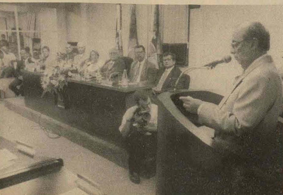
O Homenageado quando discursava