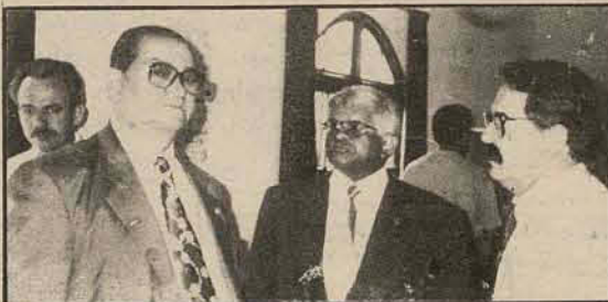
Dirigentes da Confederação prestigiaram o Encontro