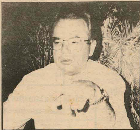
NINFO: Muitos aeroportos são medíocres.

Difundido a idéia de qualidade e produtividade no governo, Ninfo proferiu uma palestra na Assembléia Legislativa de Santa Catarina, para mais de 400 funcionários, que foi uma iniciativa da presidência daquele poder. O presidente da ACIJ disse ainda da necessidade de imbuir no funcionalismo público este tema. "Os deputados sentem a necessidade de fazer a perna do serviço público andar, se ma-