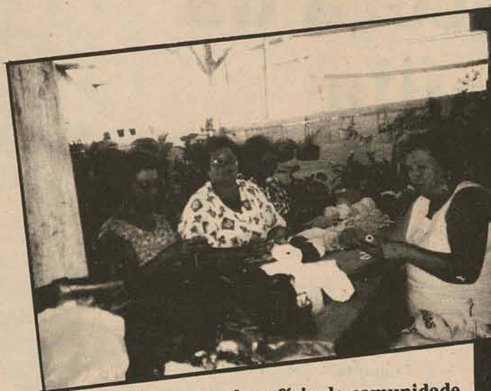
realizam tarefas em benefício da comunidade

As interessadas deverão procurar os membros da secretaria para obterem maiores informações. Lembramos que a sede da associação dos moradores do bairro Guanabara está localizada na rua Graciosa, em frente a Igreja Nossa Senhora do Rosário. A diretoria espera a presença das mães e das gestantes.