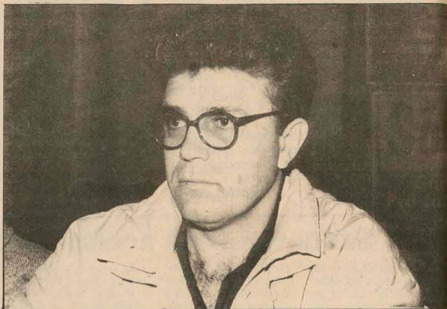
Tebaldi investindo no setor habitacional

Segundo a proposta de projetos para a atual administração, são necessários R$ 1,2 milhão. Entre os trabalhos realizados e os que serão