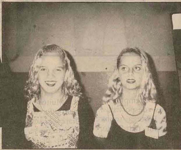
Belas candidatas ao título de rainha