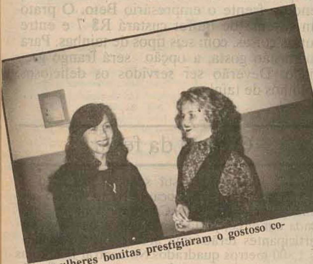
As mulheres bonitas prestigiaram o gostoso coquetel.