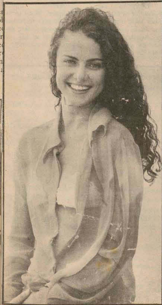
A gatinha estava gostosamente na praia, quando uma chuva fina começou cair. Vestiu-se com uma blusa muito fina, no momento o visual captado foi este. Mesmo assim mostrou belo sorriso e continuou divinamente linda.