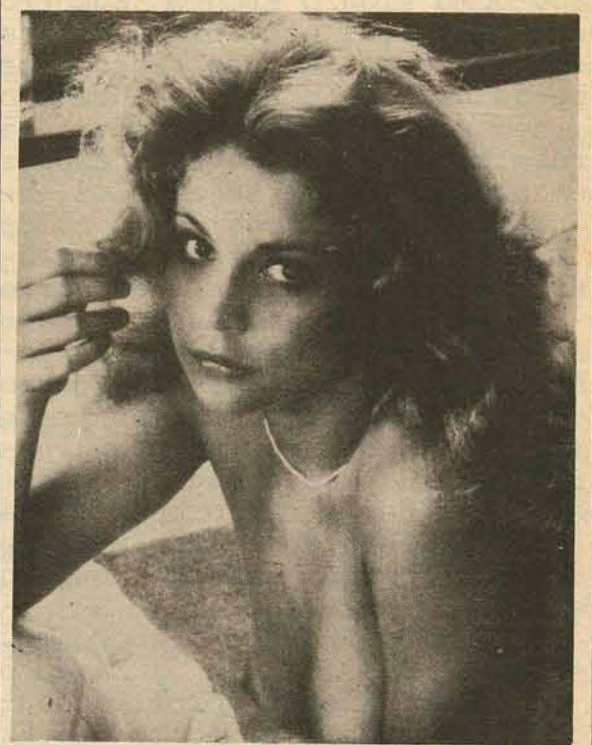
Com a falta do leite de vaca, a solução está aí: Leite de Moça..