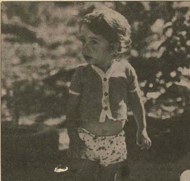
"Espero que depois desta confusão, não falte leite prá mim..."

Problemas e mais problemas/ foram enfrentados pelos consumidores, quando operava em Joinville a Usina de Leite Catarinense-