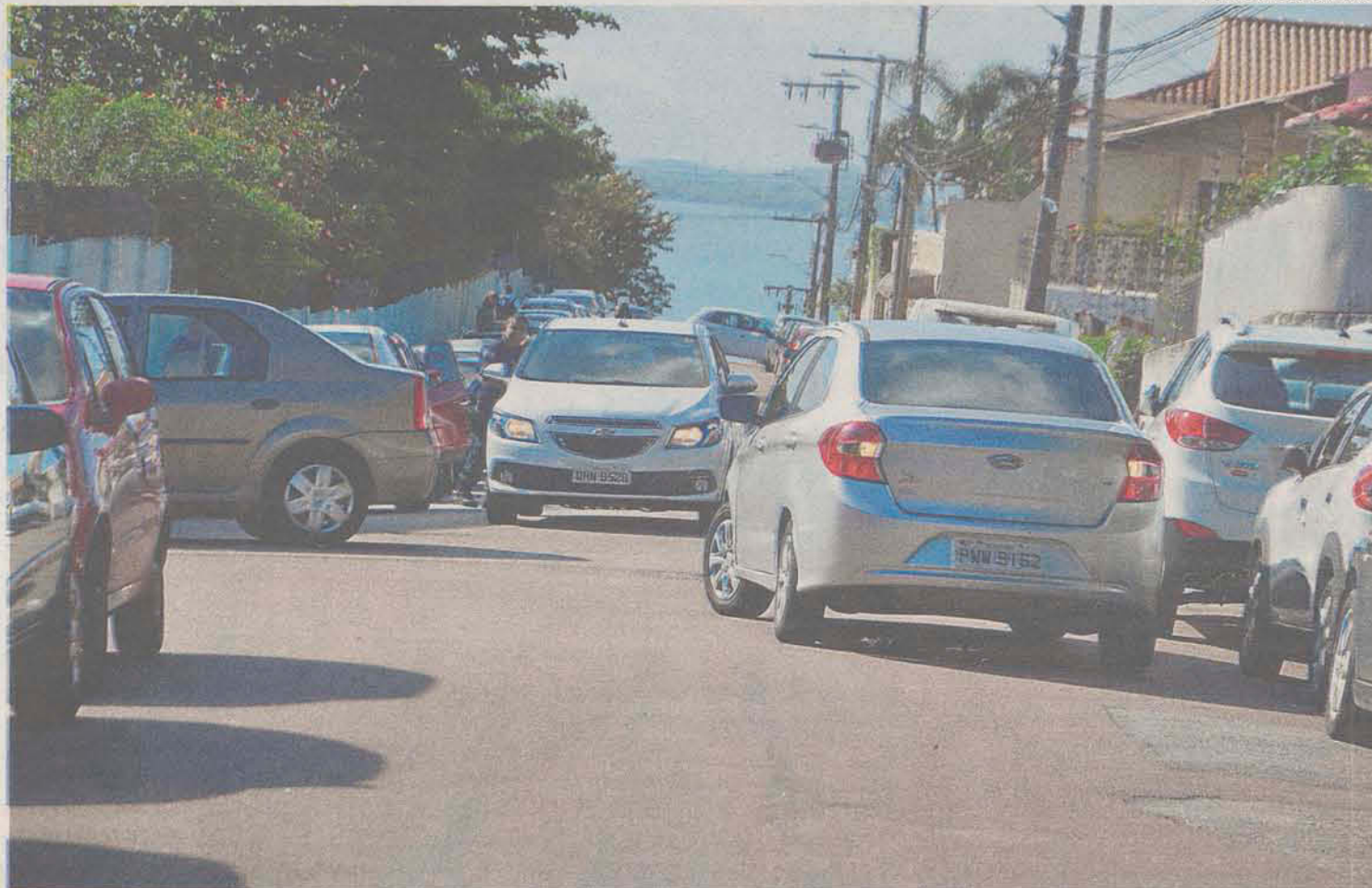
Prefeitura implanta um binário na Pascoal Simone - que apenas sobe - e São Cristóvão que dá acesso à Desembargador Pedro Silva

MAIS SEGURANÇA: Para os moradores da Rua Pascoal Simone e do entorno, a troca para apenas um sentido da via vem contribuir para a segurança de pedestres e dos próprios motoristas que acessam à Avenida Desembargador Pedro Silva. "Só posso agradecer pela iniciativa, especialmente pela segurança das crianças da Escola Presidente Roosevelt que, devido às condições das cal-