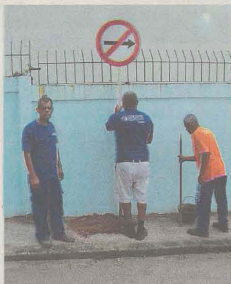
Mais de 50 placas foram instaladas