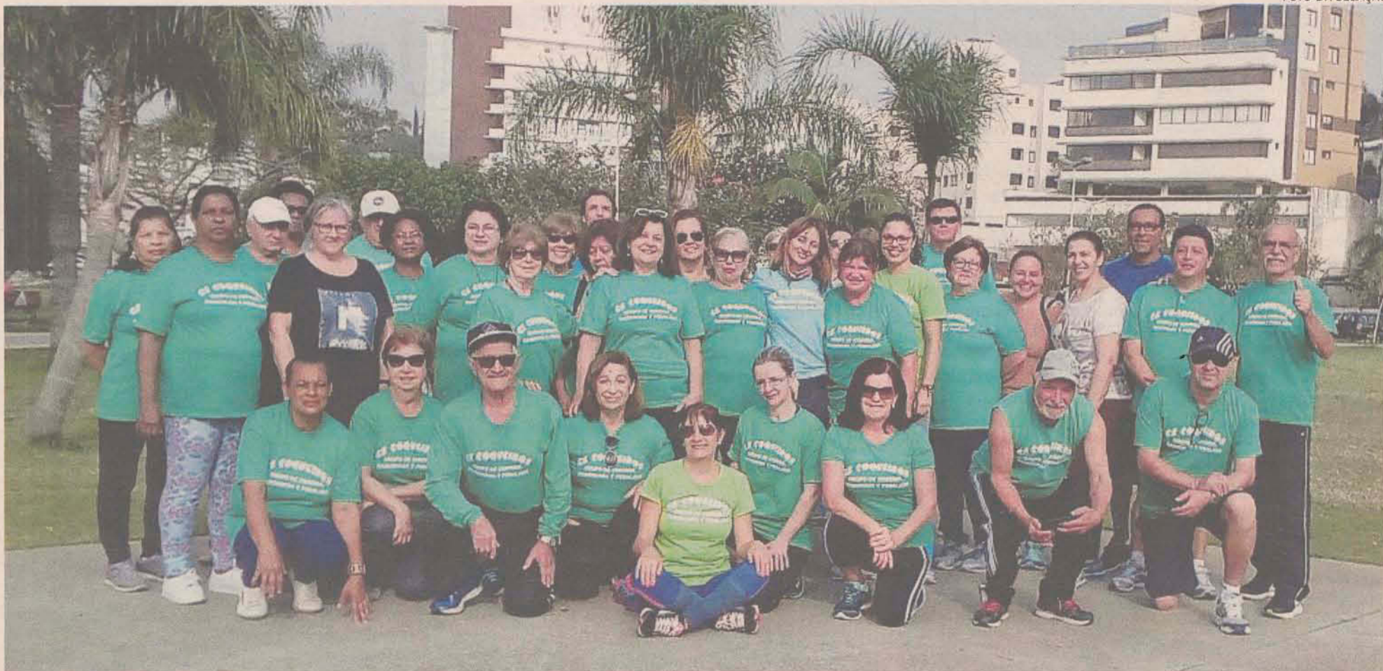
Grupo de Corrida Caminhada e Pedalada comemora quatro anos de atividades. Palestras e exercícios no Parque de Coqueiros fazem parte do tratamento