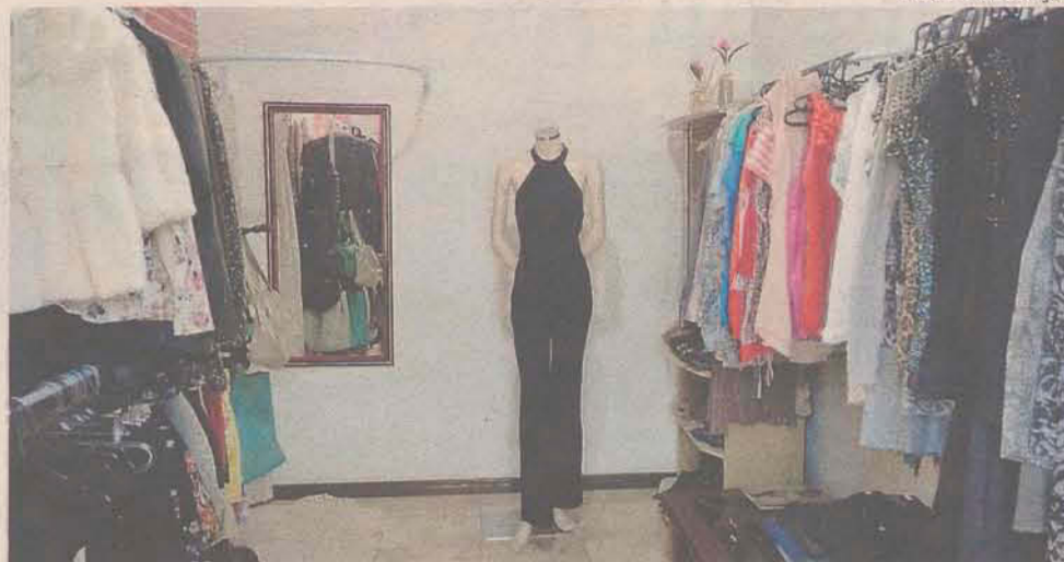
Lis de Flor: roupas femininas com preços acessíveis

Focado no público feminino, o Lis de Flor conta com peças novas e seminovas de diversos tamanhos e modelos, bijuterias, bolsas e calçados. Tudo com preços superacessíveis. E para quem quiser participar de cursos, a loja oferece costura básica, artes aplicadas e noções de patchwork.