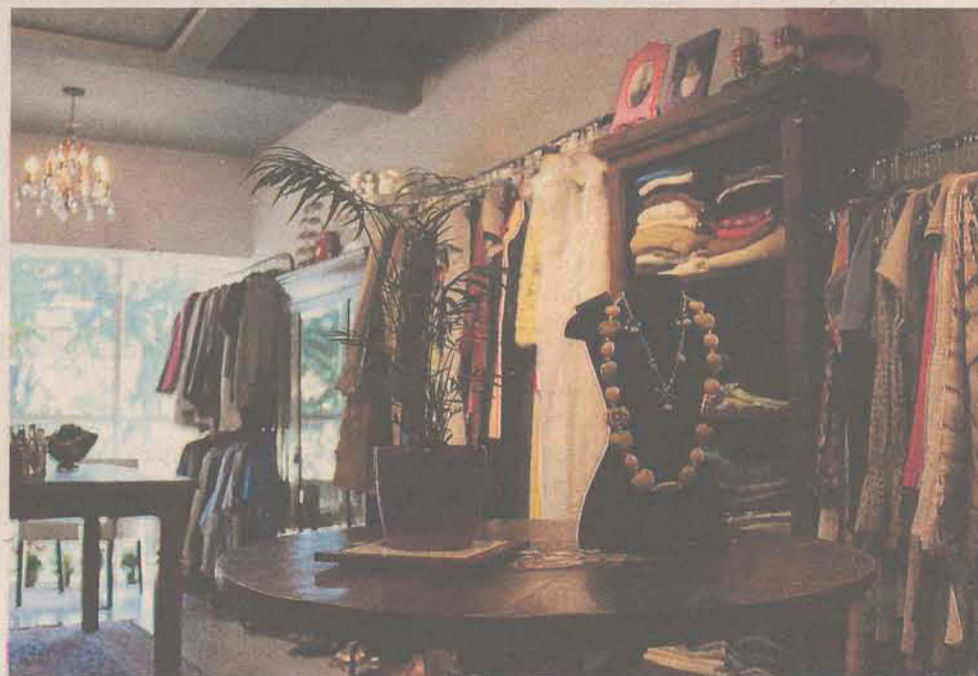
Urbana: peças de segunda mão, arte e objetos de bazar

Para elas, o hábito de comprar artigos usados, até alguns anos atrás, era rodeado pelos mais variados tipos de questionamentos, sobretudo o preconceito. "Mas isto está mudando aqui no Brasil, pela nova forma de pensar dos consumidores e, principalmente, pela economia que se consegue fazer. Segundo pesquisas realizadas pelo Sebrae, essa economia pode chegar a 80% em relação às compras em lojas tradicionais", apontam.