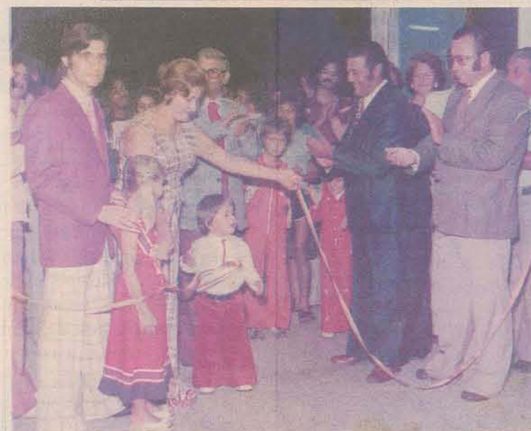
Supermercado foi inaugurado em 1976. Local abriga hoje o Imperatriz