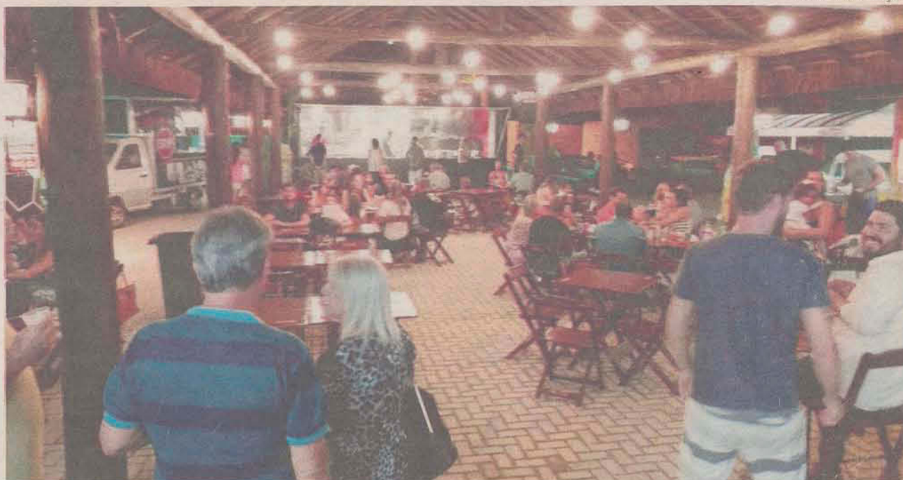
Coqueiros Food Park, localizado no bairro Itaguaçu, reúne cinco food trucks e um bar