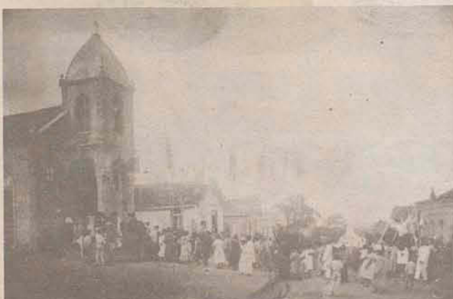
A procissão de Corpus Christi, em 1925, na então Capela de Santa Cruz de Coqueiros