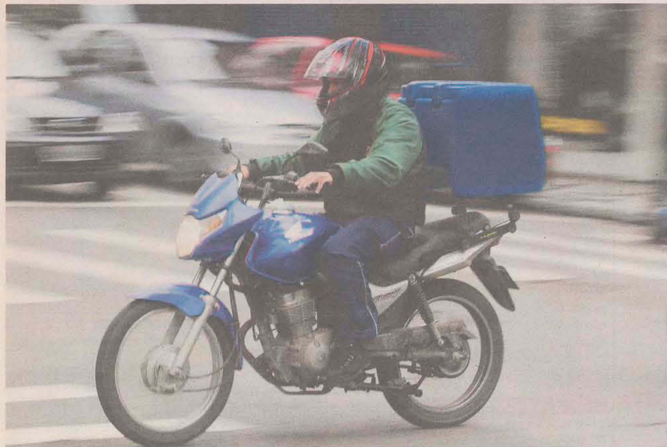
Mercado de delivery se expande e facilita a vida do consumidor