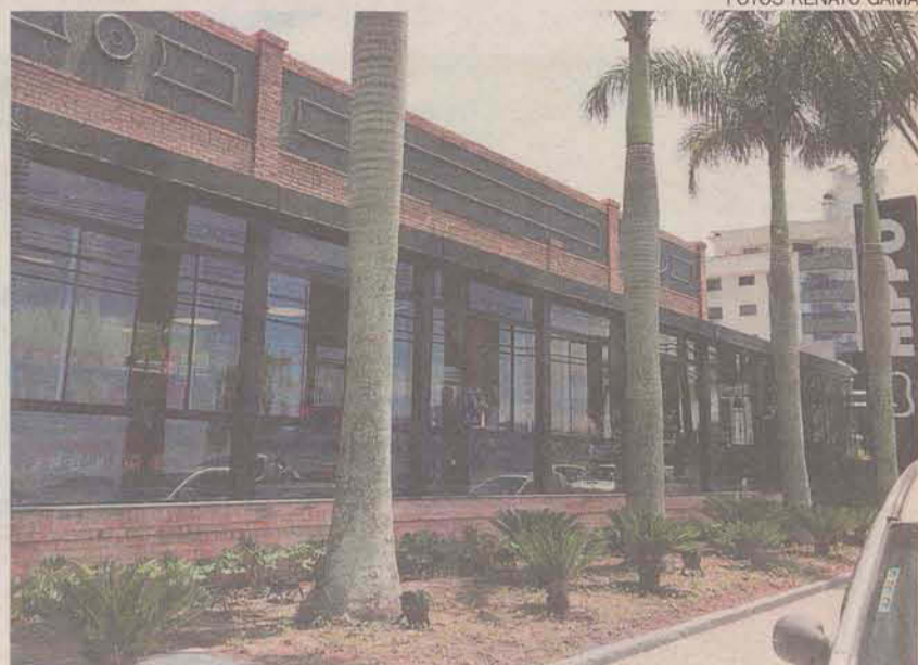
Supermercado Hippo de Coqueiros fica na Praia do Meio