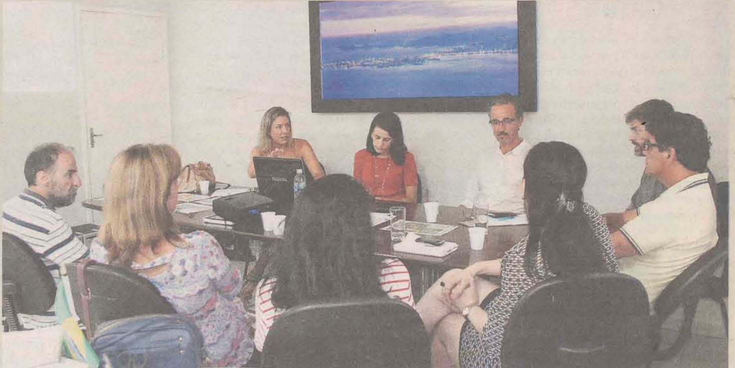
Secretário e equipe técnica do IPUF definem prazos para início das obras

Neste encontro, foi destacada a necessidade de se garantir a ocupação do espaço, ou seja, trabalhar na área pertencente à prefeitura, de aproximadamente 12 mil metros quadrados, que não é alvo de nenhum litígio. Ficariam de fora o espaço hoje reivindicado pelas famílias que vivem no terreno, bem como aquele de domínio da União. “Estamos criando uma força tarefa e tenho certeza que vamos tirar o Parque do Abraão do papel”, afirmou o secretário, que manifestou seu desejo de elaborar uma agenda positiva de atividades no local, com eventos e shows, que incentivem a ocupação.