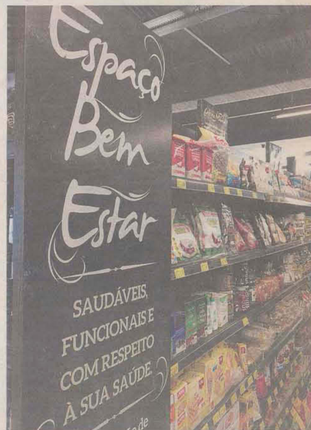
Lugar para alimentação saudável