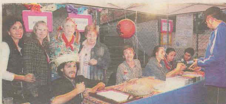
Parte da equipe de voluntários que garantiu o sucesso do evento