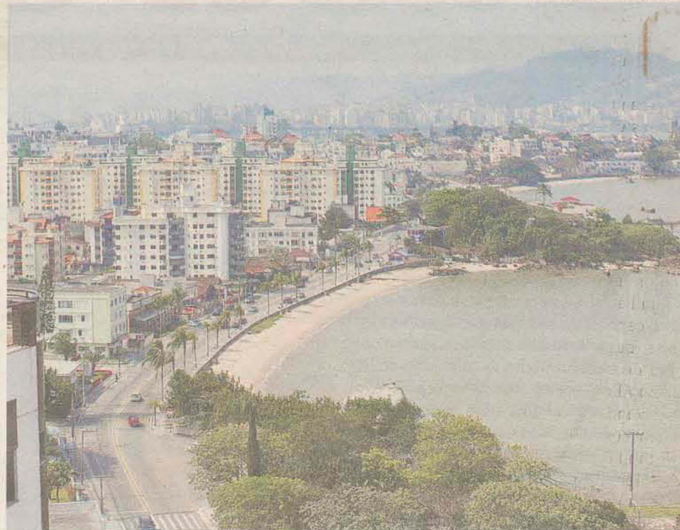
Belezas naturais e infraestrutura são atrativos para os negócios

quarta-feira é dia de dobradinha; quinta-feira, comida alemã; sexta-feira, frutos do mar e sábado feijoada. O diferencial da casa é o amplo ambiente: são 150 lugares e mais um deque. Para aproveitar o espaço, o empresário está trabalhando com reservas para eventos, e para café colonial. O