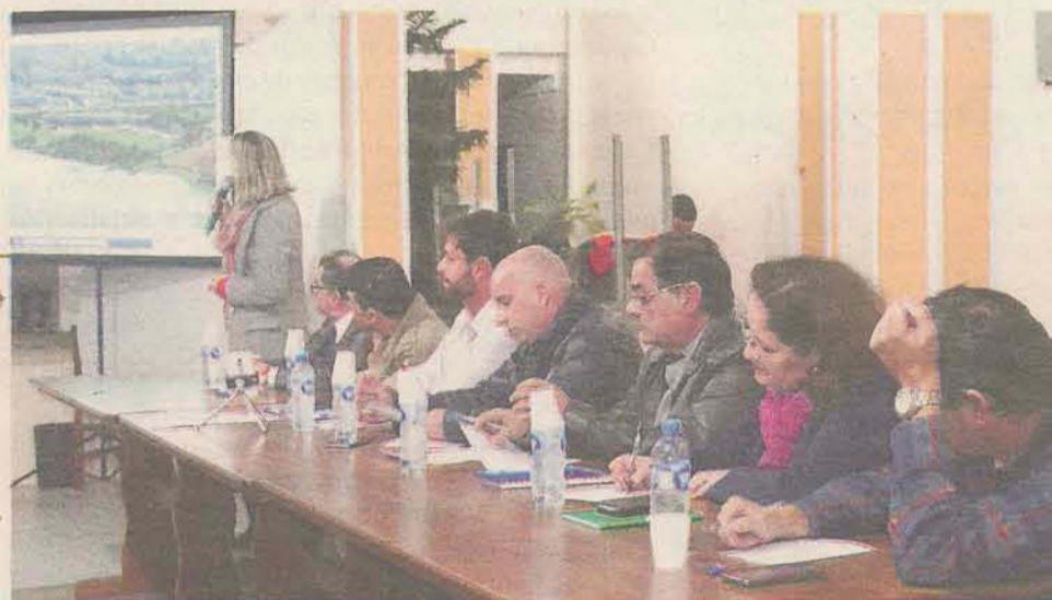
Representante do Ipuf mostra o novo projeto para o parque