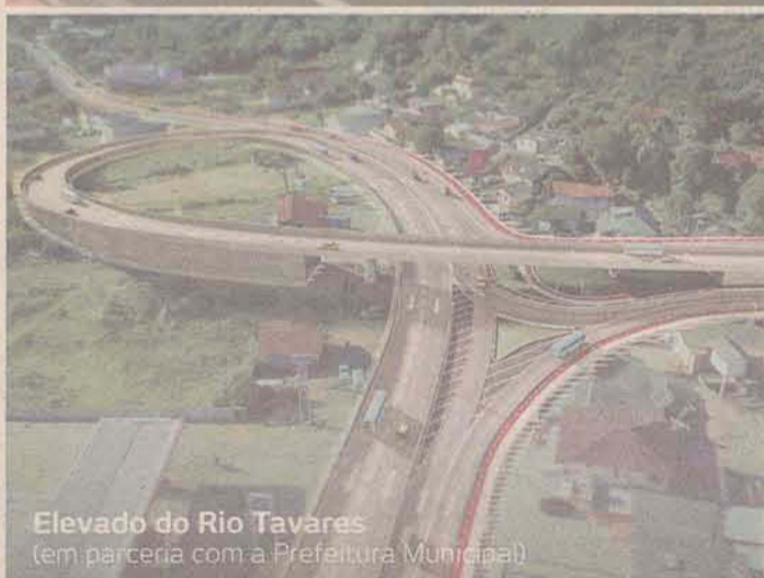
Elevado do Rio Tavares (em parceria com a Prefeitura Municipal)