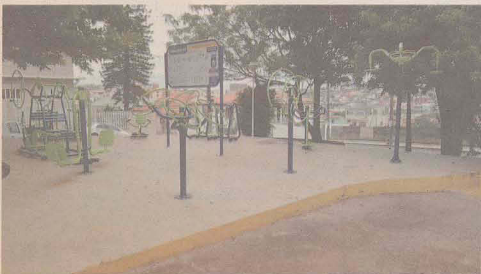
Academia Ginástica - Praça João Batista Vieira

de Rua, atividade que consiste em tentar encaminhar os moradores que se encontram em locais como casas abandonadas, viadutos, passarelas, praças e logradouros públicos na região continental aos serviços sociais da prefeitura. No total foram realizadas sete operações. Muitos aceitaram o apoio e encontraram uma nova oportunidade de vida.