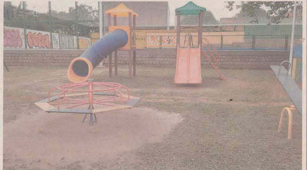
Parque infantil - Praça João Batista Vieira - Coloninha

Além destes locais, a Praça Nagib Jabor, em Capoeiras, também recebeu melhorias