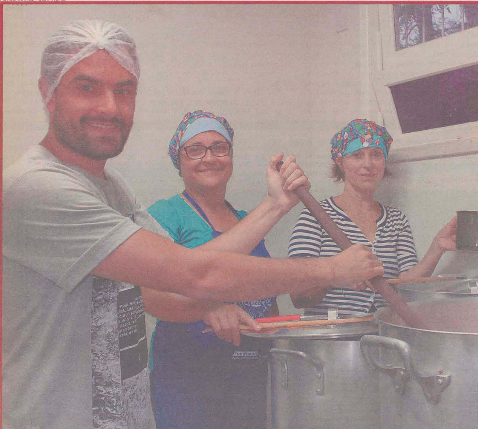
Gente que faz a diferença como o grupo do Projeto Resgate (foto) se mobiliza em favor de ações sociais