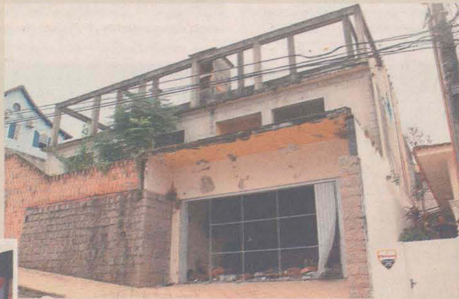
Rua Senador Milton Campos - Coqueiros