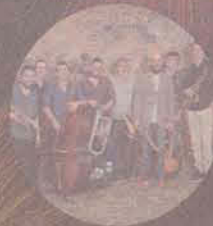
BRASS GROOVE BRASIL