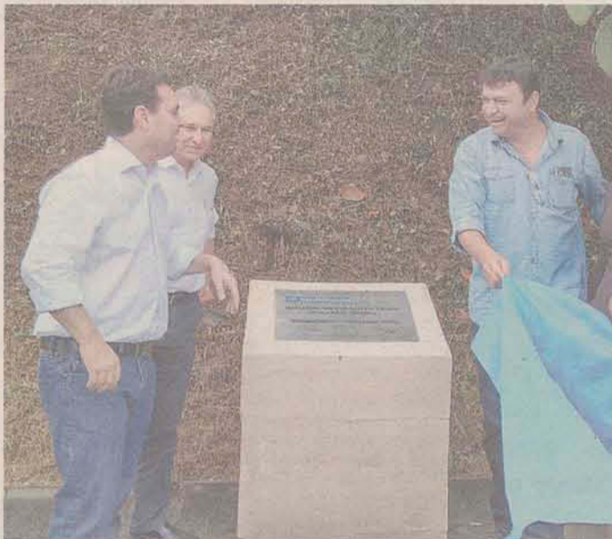
Inauguração Praça Arno Shaffer- Estreito

Na comunidade Chico Mendes e Novo Horizonte, no bairro Monte Cristo as obras nas áreas de lazer foram amplas com a construção de quadra de grama sintética, reforma na quadra esportiva e de areia, instalação de academia de ginástica, parque infantil, colocação de bancos, lixeiras e feita pintura em geral.