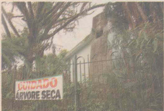
Rua Fernando Ferreira de Mello - Bom Abrigo