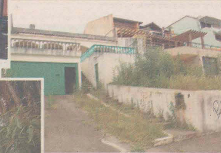
Rua Plácido de Castro - em frente ao mar do Bom Abrigo