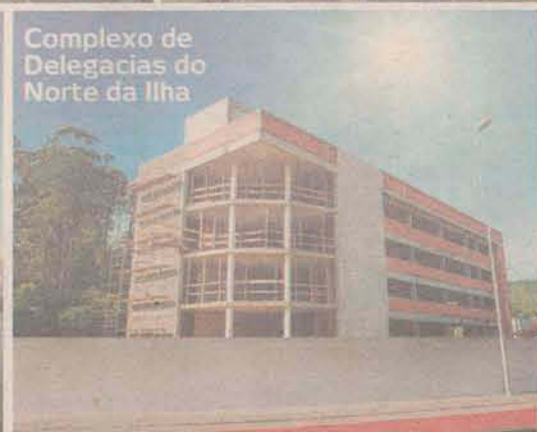
Complexo de Delegacias do Norte da Ilha