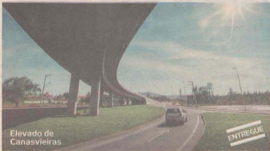
Elevado de Canasvieiras