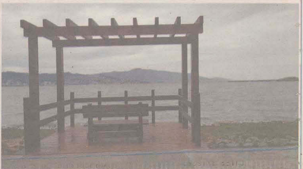
Pergolado Parque de Coqueiros