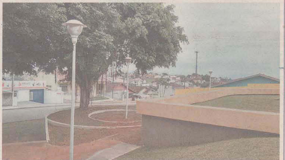
Nova iluminação Praça João Batista Vieira