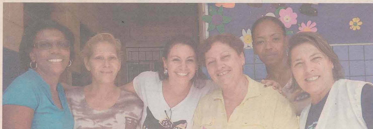
Equipe do Cevahumos atende cerca de 120 crianças nos períodos em que não estão na escola