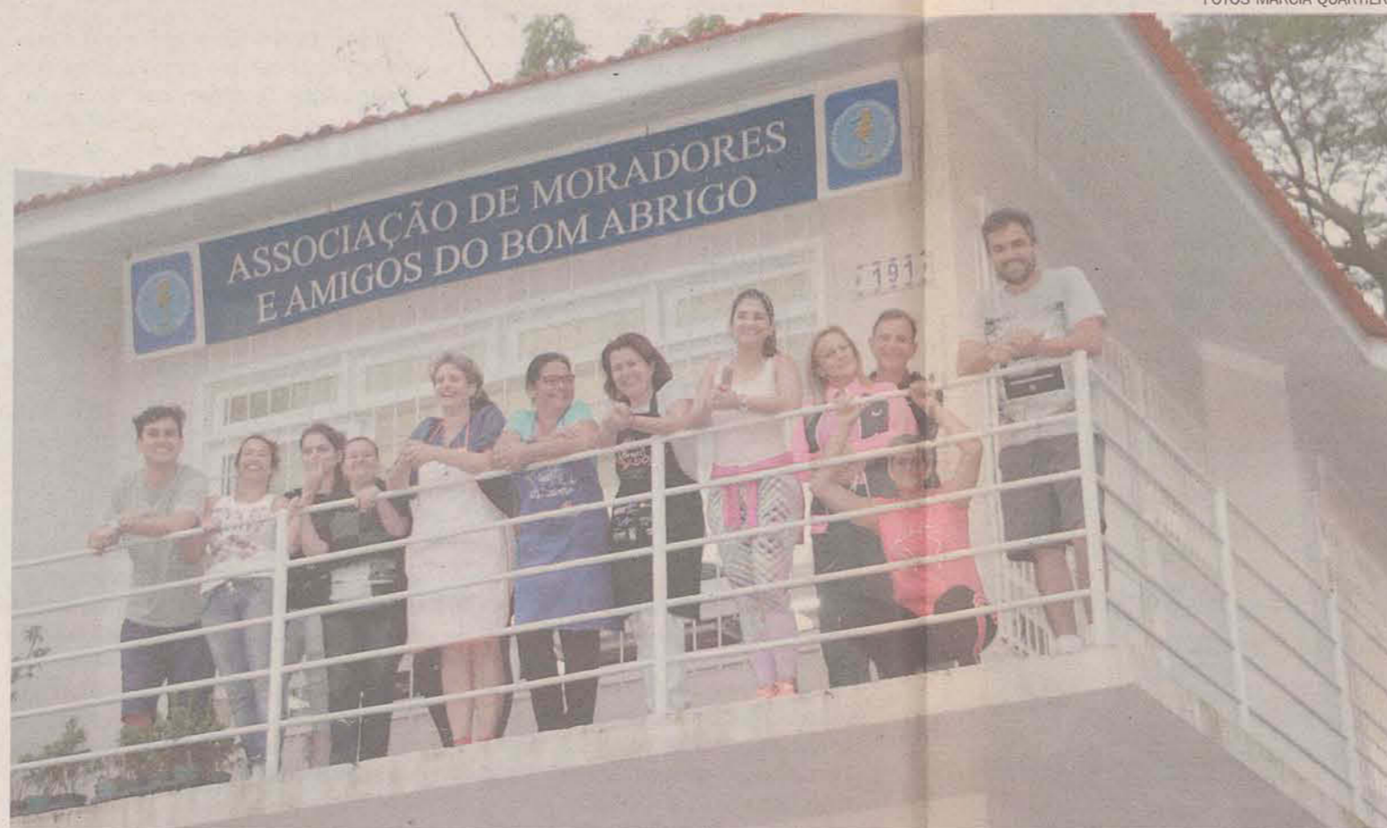
Grupo de voluntários do Projeto Resgate prepara sopão para alimentar moradores de rua

Doações para o sopão especial de Natal também são bem-vindas.