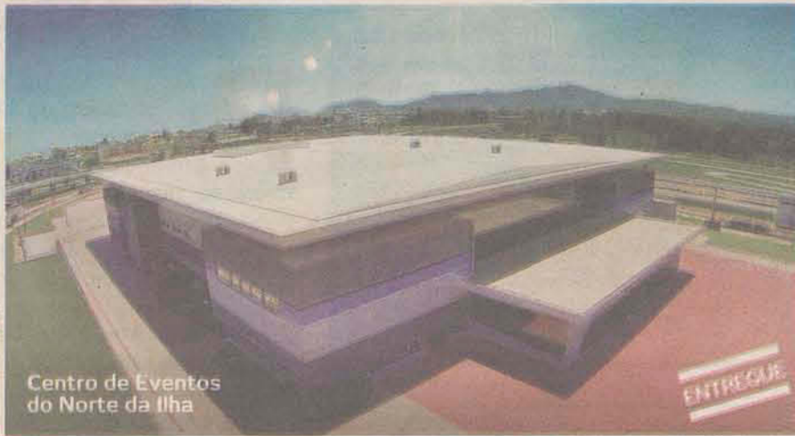
Centro de Eventos do Norte da Ilha