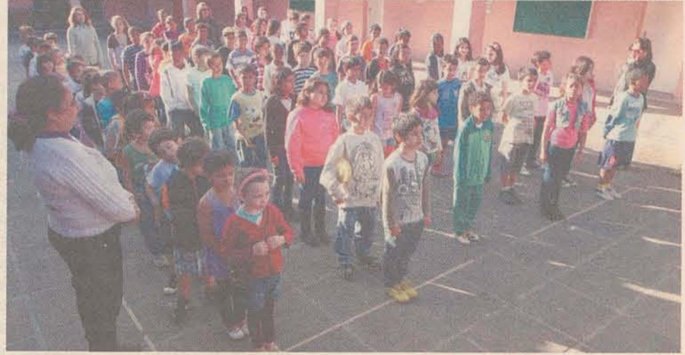
TRADIÇÃO: colégio mantém 450 alunos do ensino fundamental e médio

As novas instalações foram inauguradas em 15 de outubro de 1995 pelo ex-governador Paulo Afonso Vieira ex-secretário de Educação João Matos.