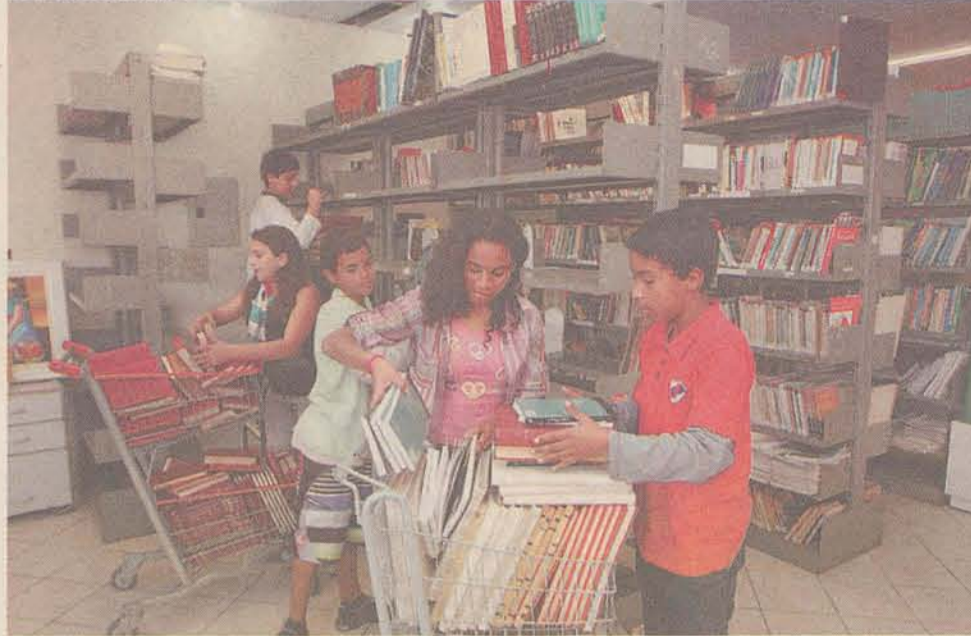
BIBLIOTECA: reforma prevê troca do telhado danificado pela chuva