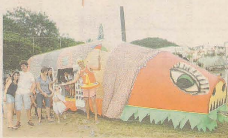
Festa da Praia do Meio foi promovida pelo Bloco da Bernunça e pela AMPIMS

Mesmo sem a figura carismática do Paru, que foi hospitalizado às vésperas da Folia de Momo, o carnaval em Coqueiros teve dois bons momentos: a festa realizada em frente da Merceria do Ori, mais voltada ao público adulto, e a da Praça do Meio, que encantou crianças, pais & cia. Nesta última, os destaques ficaram por conta da bernunça gigante e do boi de mamão.