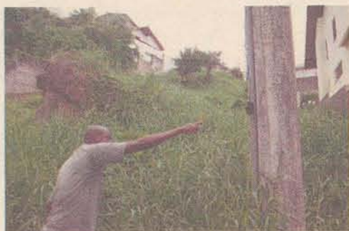
GATO: furto de energia da vizinhança