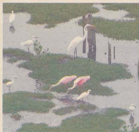
Tânia, da janela de seu apartamento, observa o ir e vir dos pássaros no mangue