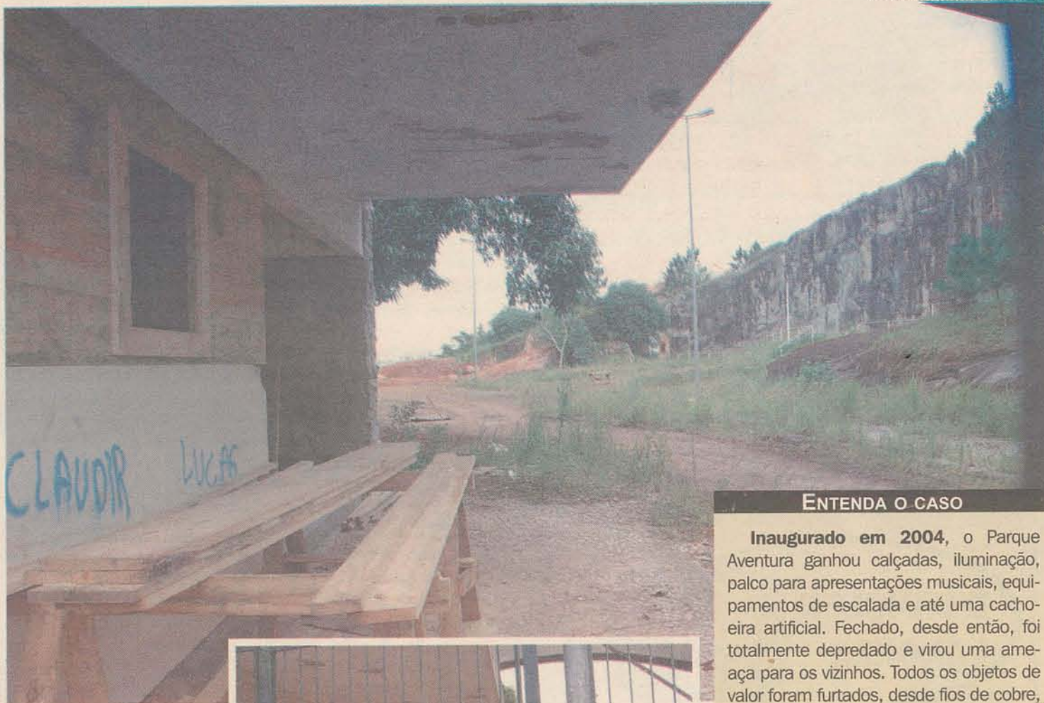
EMPRESA: sem alvará para construção