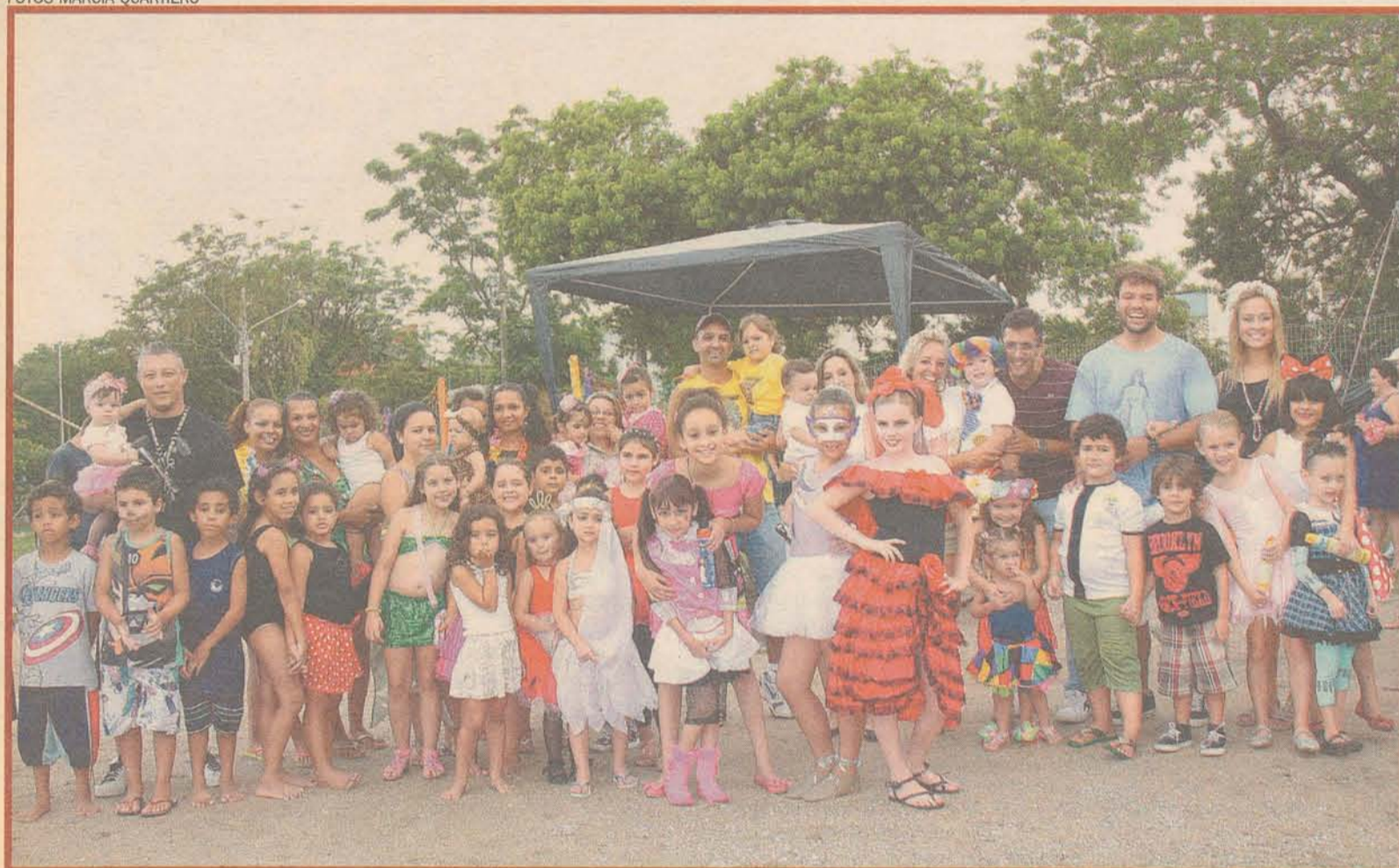
Criançada fez a festa no Carnaval da Praia do Meio. Bernunça gigante e boi de mamão foram as atrações