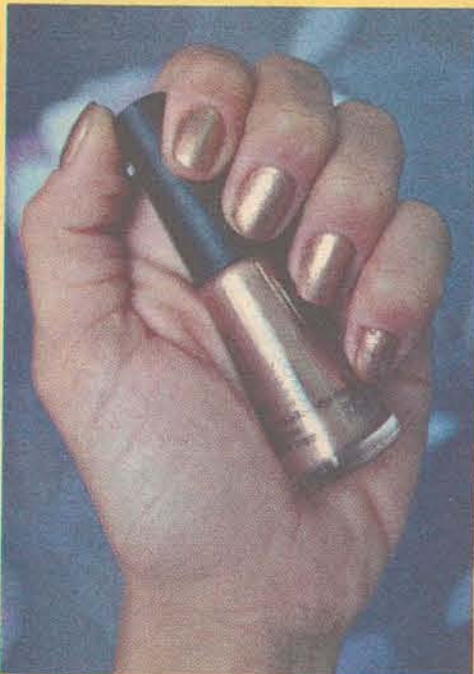
Unhas douradas para o Réveillon

clutch, que também está entre os nossos itens quase que obrigatórios da wish list fashion, faz o papel de acessório principal e rouba a cena. Metalizada, de couro, acrílico, madeira ou raw, a clutch também é conhecida como a bolsa MILK (Money, iphone, Lipstick, Keys), as