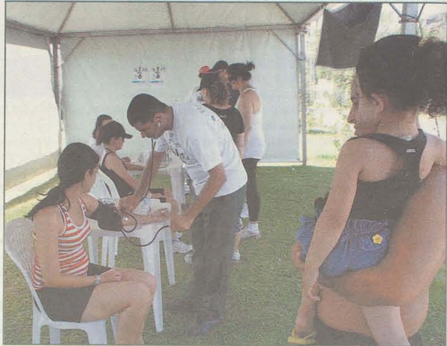
CAMPANHA: abertura do evento foi no Parque de Coqueiros

O Acidente Vascular Cerebral (AVC) é a segunda principal causa de morte no mundo e responsável por cerca de 6 milhões de óbitos a cada ano, matando mais do que a tuberculose e a malária juntas. A doença ocorre em qualquer idade, afetando adultos e crianças. Atentas a esta situação, a Secretaria de Estado da Saúde (SES), Rede Brasil AVC e Associação Brasil AVC promoveram de 23 a 29 de outubro, a Semana Nacional do Combate ao AVC, orientando a população sobre os fatores de risco. A abertura do evento aconteceu no Parque de Coqueiros com caminhada, orientação e distribuição de informativos das 9h às 12h.