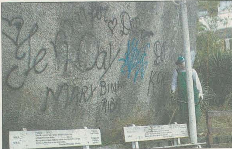
PICHADAS: pedras históricas não escapam do vandalismo