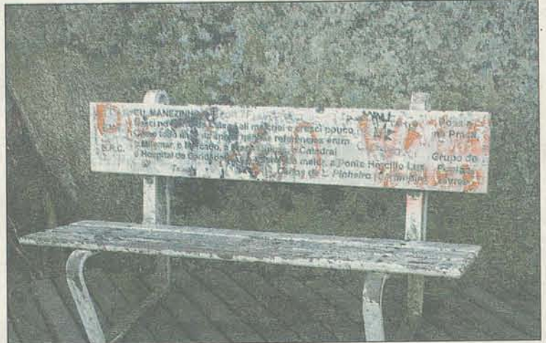
DESRESPEITO: bancos com poemas também estão destruídos