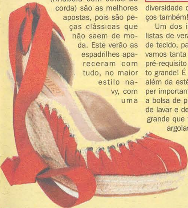
A espadrilhe nunca sai de moda e é um ótimo investimento

Leia mais no site http://www.doque-elasgostam.com.br/site/index.php