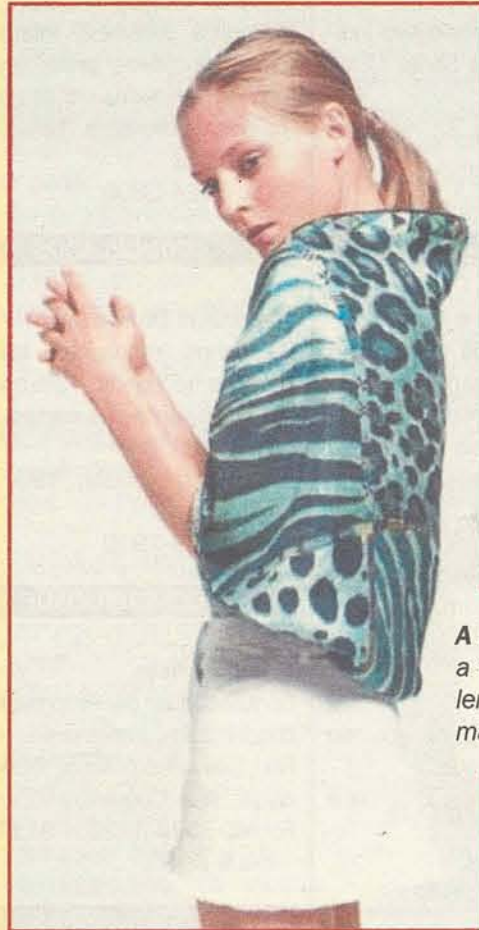
A Hèrmes ensina a transformar um lenço em bolero. O máximo!

diversidade de cores e o melhor, de preços também!