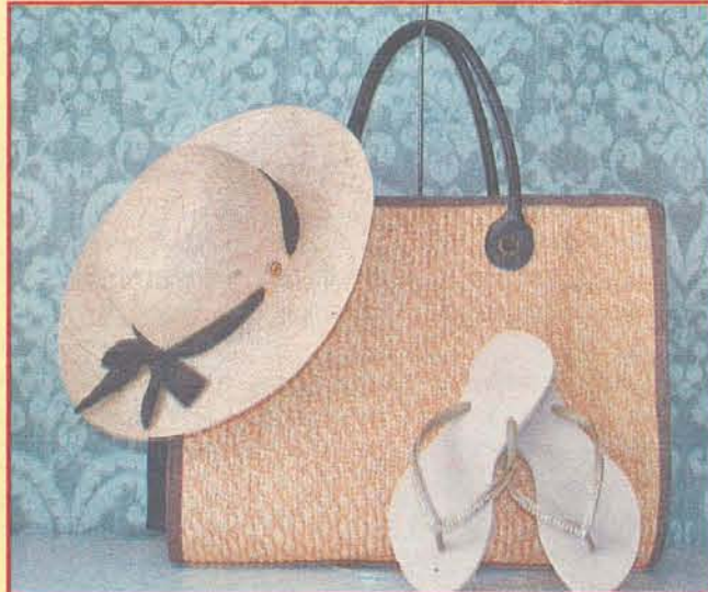
Acessórios indispensáveis para o verão: proteção e estilo

lavar, então considere essas duas possibilidades.