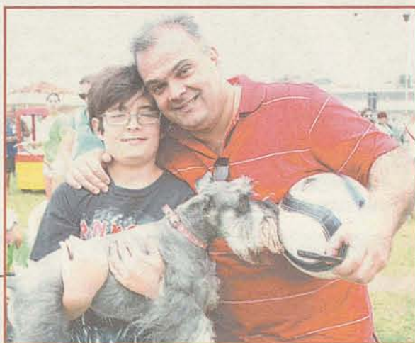
Equipe da SOS Animais