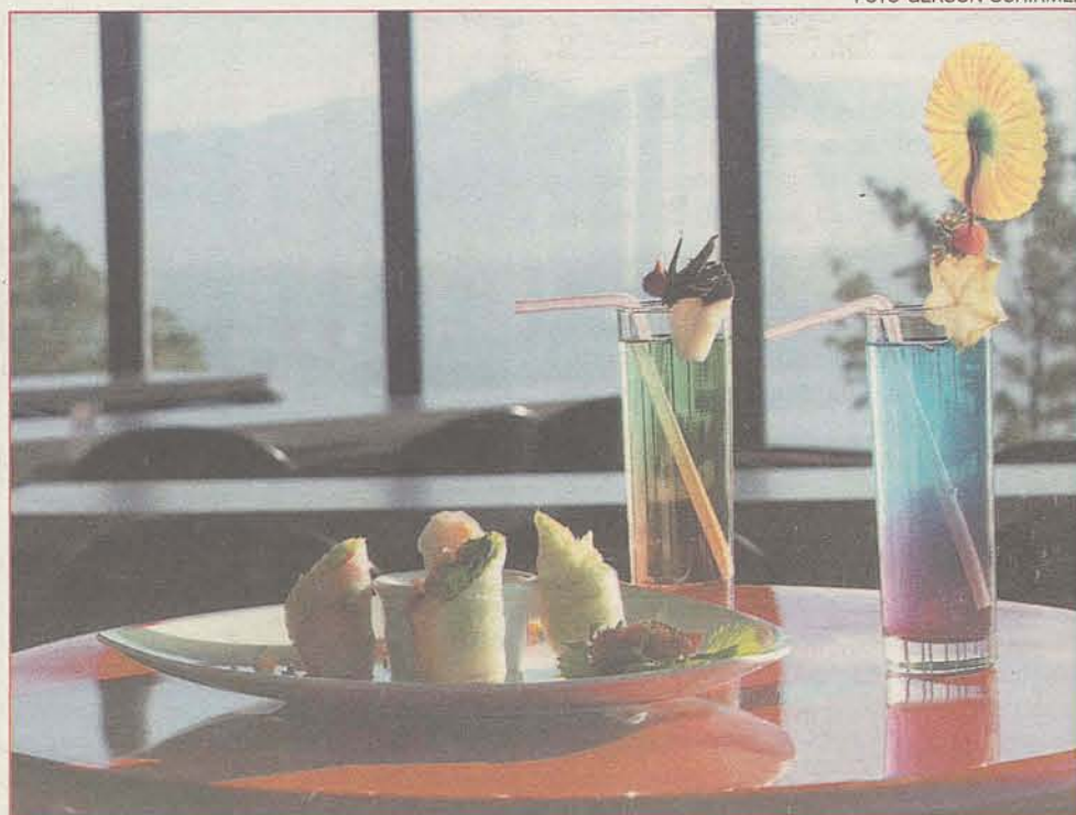
BAR SANTO GRAAL: ambiente para relaxar no final da tarde

Quem gosta de saborear uma boa comida regada à música, drinks variados e cerveja gelada já tem um novo endereço em Coqueiros. É o Bar Santo Graal que abriu as portas dia 8 de agosto com novidades na decoração, no cardápio e na programação. Localizado nas dependências da AABB, a casa oferece espaço com lounge e deck interno, mesas no estilo bistrô e, de quebra, o belo visual de Baía de Itaguaçu. Portanto, quem quiser apreciar o pôr-do-sol da praia degustando pratos assinados pelo chef Narbal Correa está aí uma boa pedida.