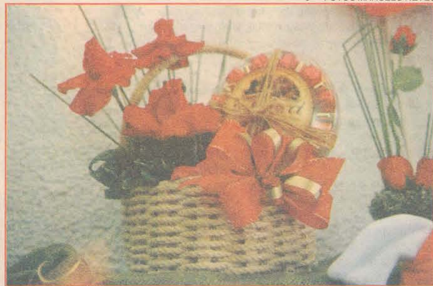
FINA FLOR: floricultura tem cestas com rosas, bombons, vinhos e de café da manhã

Outra alternativa são os pijamas, lingerie e cuecas que podem ser encontrados na MS Moda Íntima. Pija-