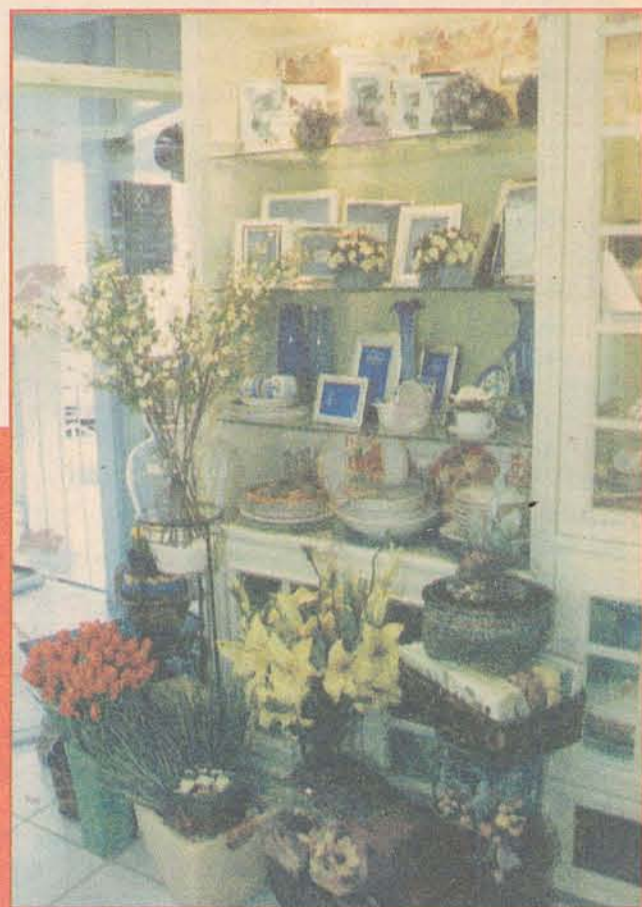
PORTO PRESENTES: porta-retratos até copos de cristal e arranjos de flores