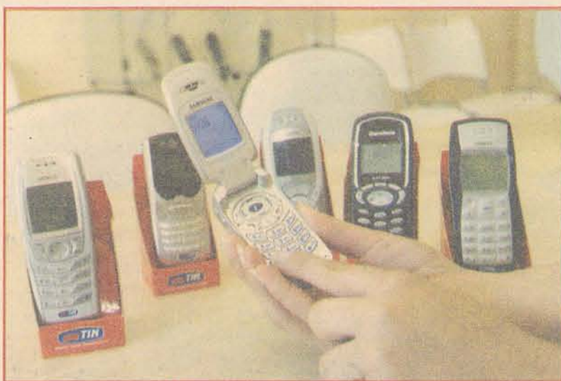
TECCELL: revenda Tim oferece desde aparelhos simples até os mais modernos.

Já para quem pretende gastar mais com o presente, a Teccell Revenda Tim trabalha com diversos tipos de aparelhos, desde os mais simples até os mais modernos, com câmeras fotográficas entre outras funções. Um exemplo é o Nokia 3310, com funções como relógio, despertador, troca de mensagens, e-mail e discagem por voz que sai por R$ 198,00. Há também o Siemens Mobile A50 que tem acesso à internet, alerta vibratório e identificação de chamadas por ícones por R$ 248,00 ou ainda o Siemens Mobile MC60, com display colorido, câmera digital integrada, envio de fotos, imagens e sons, e outras funções que sai por R$ 798,00. A compra de todos os aparelhos pode ser realizada em até 1+4 vezes.