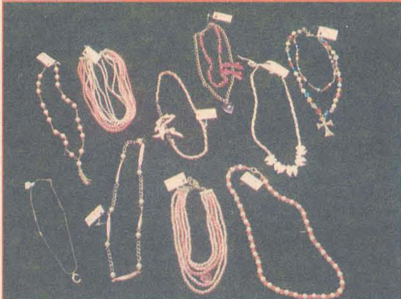
TINA ACESSÓRIOS: além de colares, também dispõe de brincos, pulseiras e cintos