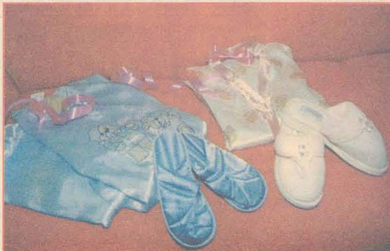
MS MODA ÍNTIMA: pijamas femininos a partir de R$ 29,00

A Pele de Seda, que também trabalha com moda íntima, está com novidades para o Inverno. São pijamas de seda com pelúcia e de cetim longo. Os preços variam de R$ 55,00 a R$ 63,00.