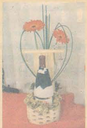
• Páginas 6 e 7

Veja dicas de presentes para o Dia dos Namorados