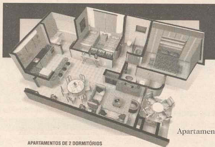
APARTAMENTOS DE 2 DORMITÓRIOS

A preocupação com o meio ambiente é outro fator que se destaca no projeto. Mais uma vez a Formaceo incorpora no condomínio Villa Maggiori os cuidados com a natureza.