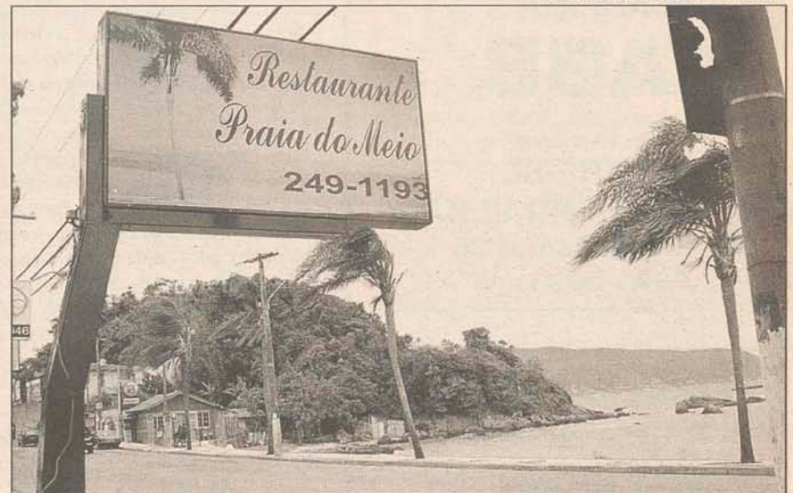
SAÚDE: saladas e alimentos sem gordura estão entre as novidades

TECNOLOGIA- A cozinha do restaurante contará com equipamentos de última geração tecnológica e, por isto, os pratos sairão isentos de colesterol. Tudo será preparado no vapor, garantindo, assim, uma alimentação saudável.