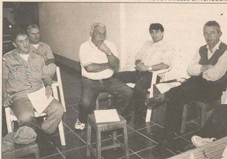
SEGURANÇA: Moradores do Abraão exigem mais proteção da Polícia