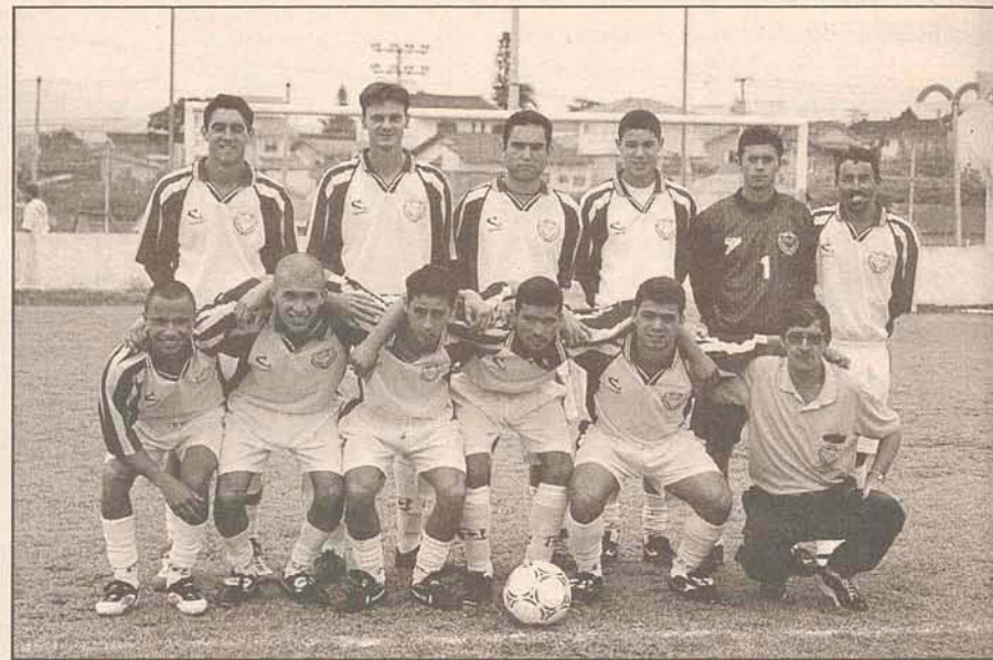
SEM ESPAÇO: Sport Clube Ponte Nova participa de jogos fora do bairro