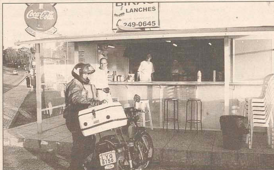
BIKÃO: Prefeitura retira trailer da praia por má ocupação do espaço público

Ao todo, serão 30 bancos de madeira instalados à beira-mar, sete decks pequenos com escadas laterais de acesso à praia, 44 mudas de palmeiras e implantação de nova iluminação pública. A rótula na entrada