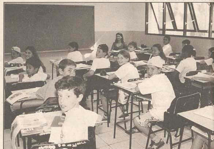
REFORMA: estudantes ganham salas novas em dezembro