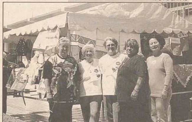
TALENTO: Pessoal da Terceira Idade de Coqueiros comemora sucesso da feira